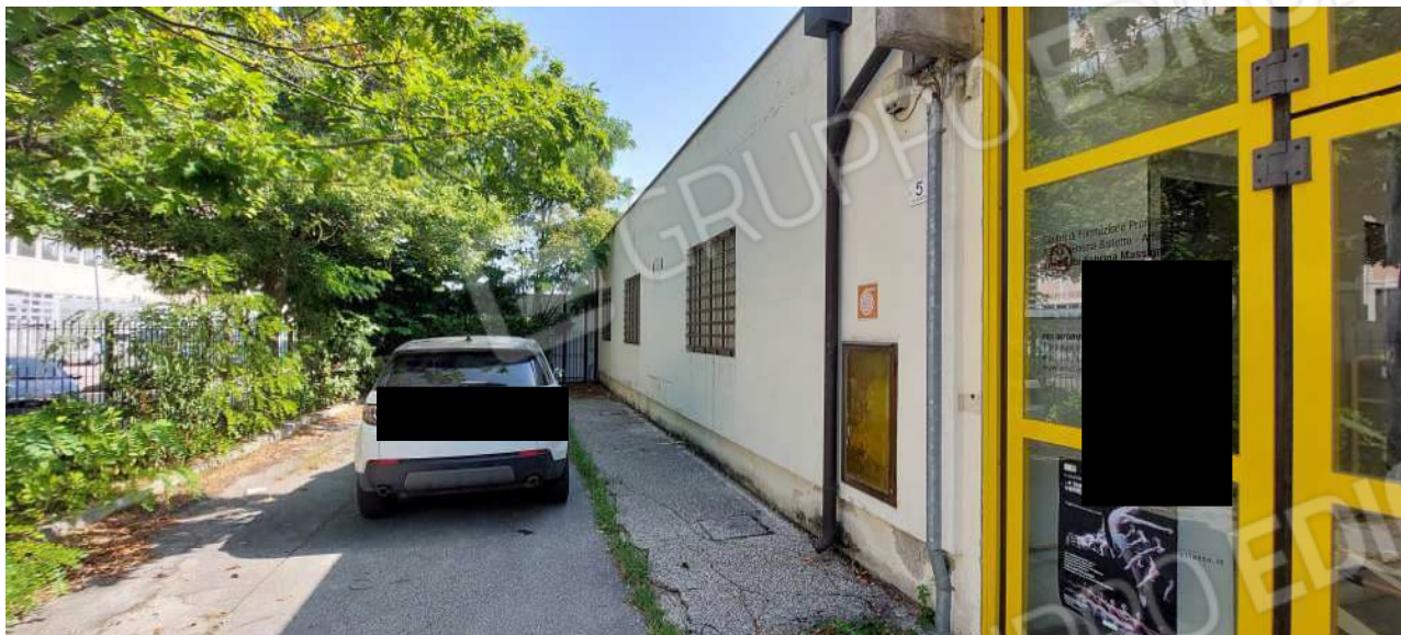
Area scoperta a uso esclusivo