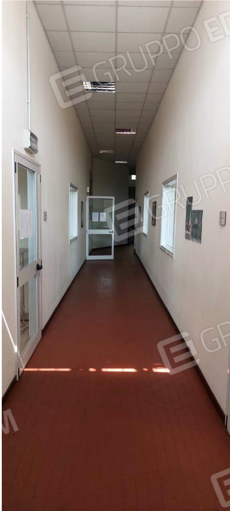
Corridoio centrale di distribuzione sale