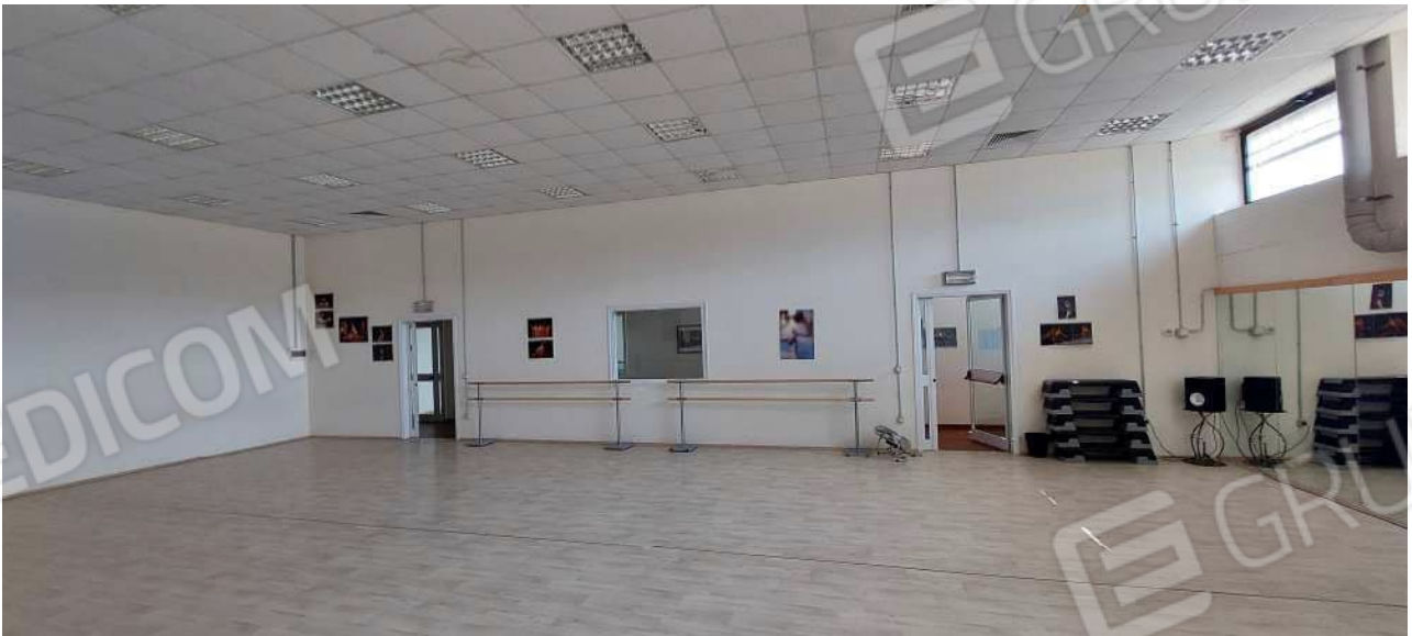
Sala attività n° 2