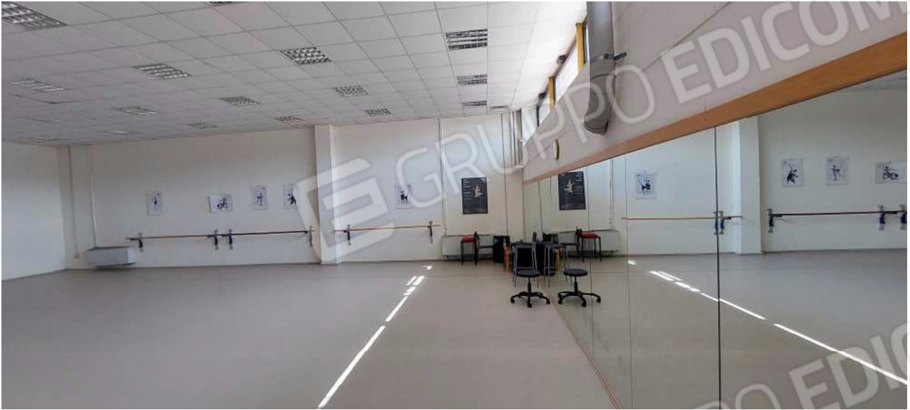
Sala attività n° 1