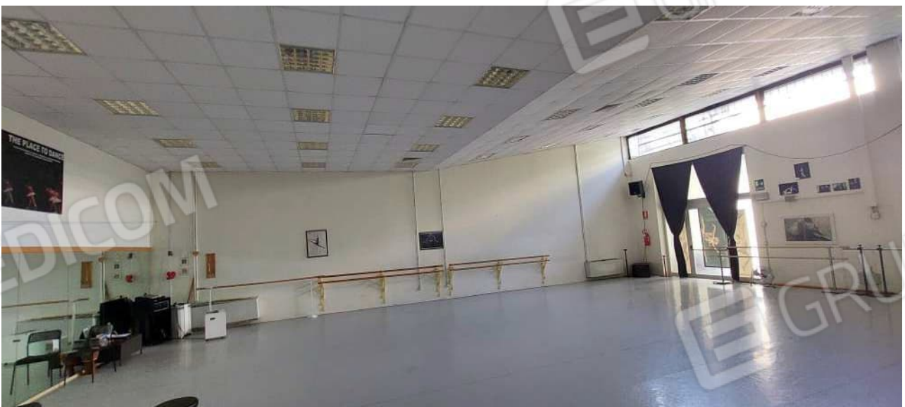
Sala attività n° 3