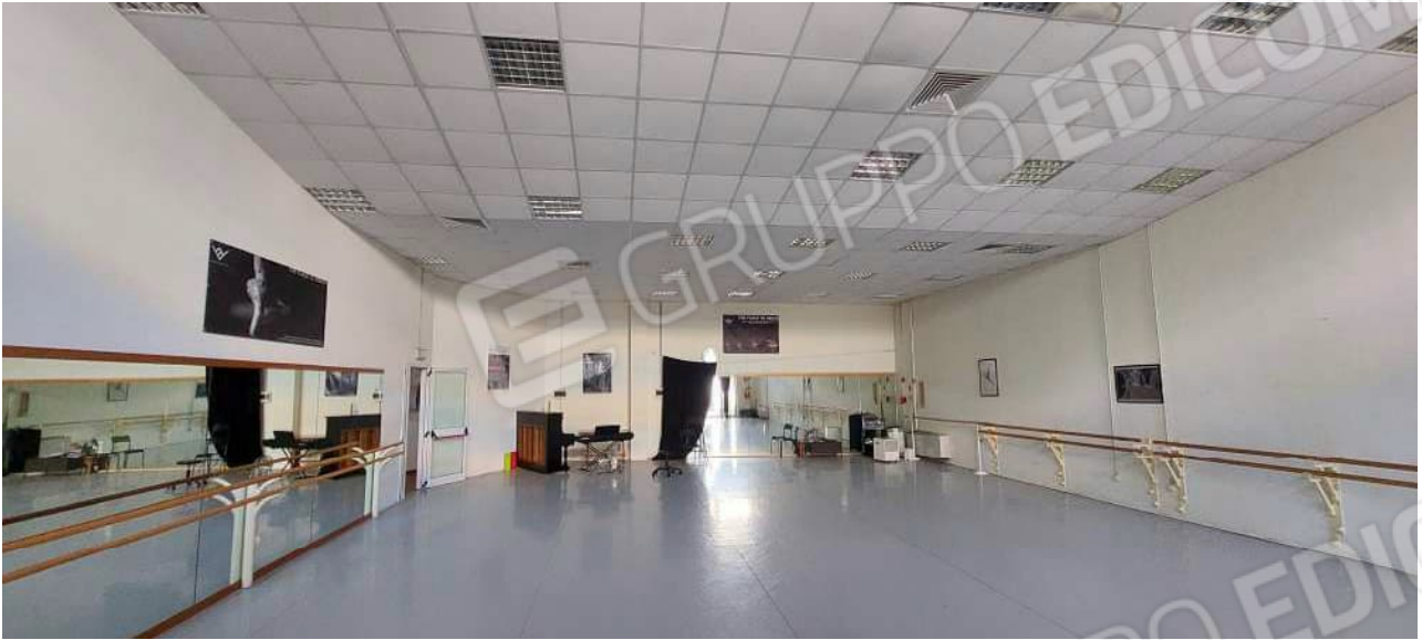
Sala attività n° 3