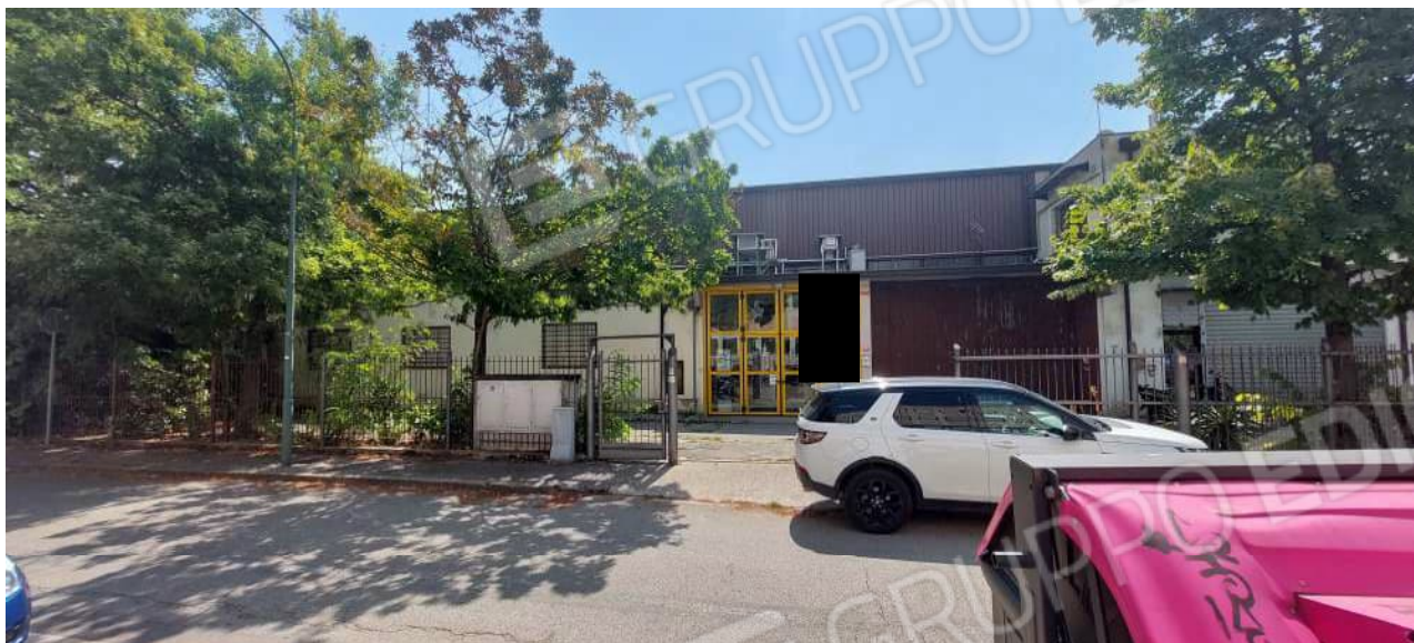
Vista dell'ingresso da Via Rosetto