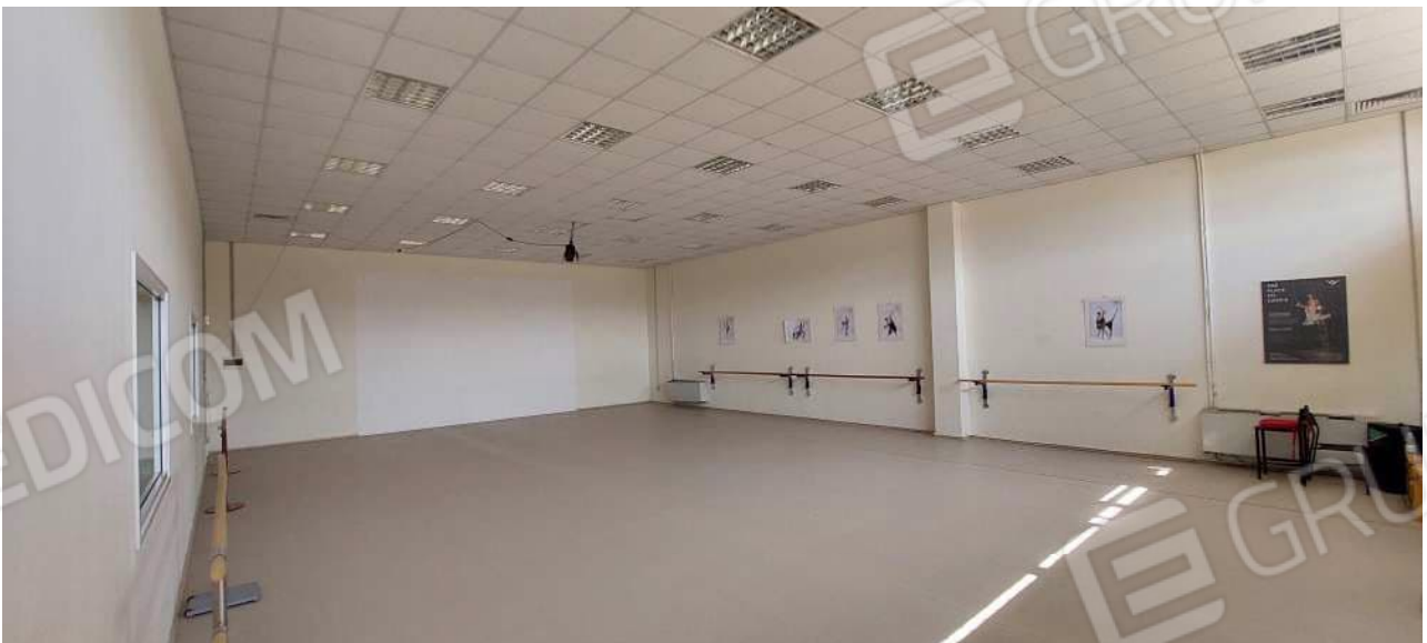
Sala attività n° 1