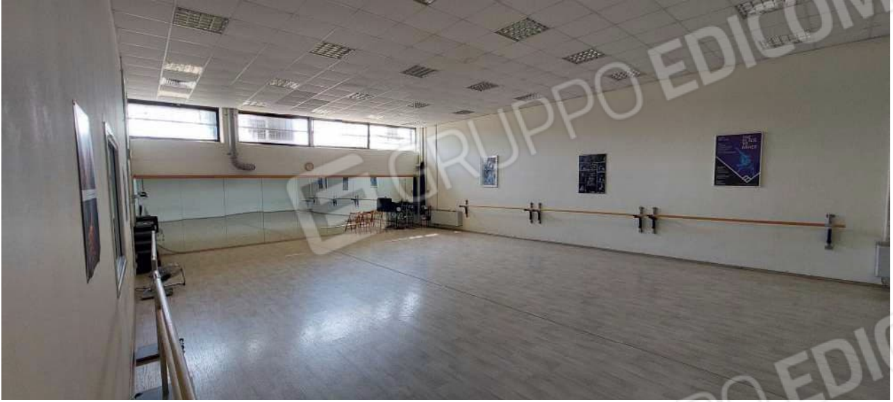
Sala attività n° 2