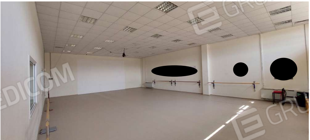
Sala attività n° 1