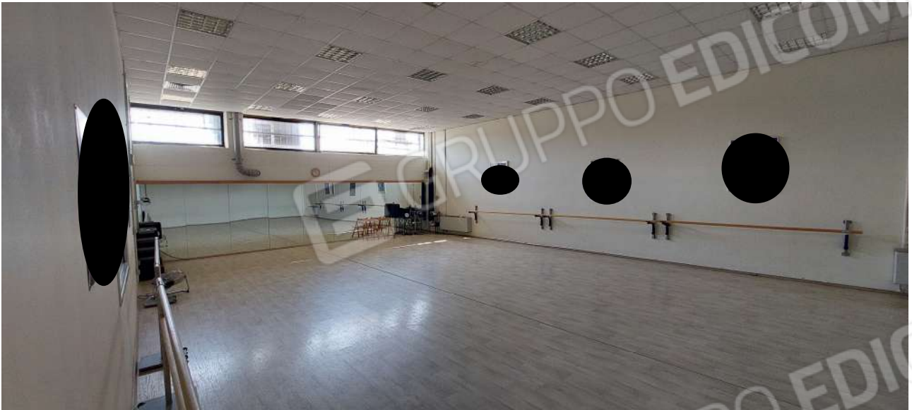
Sala attività n° 2