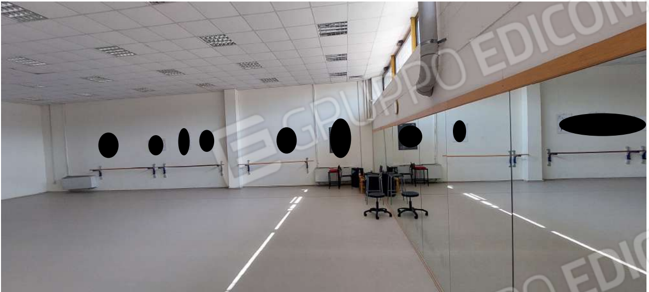
Sala attività n° 1