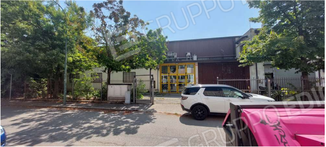
Vista dell'ingresso da Via Rosetto