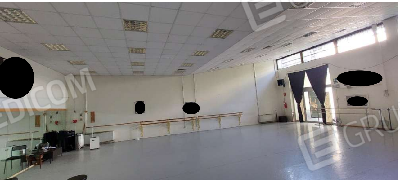
Sala attività n° 3