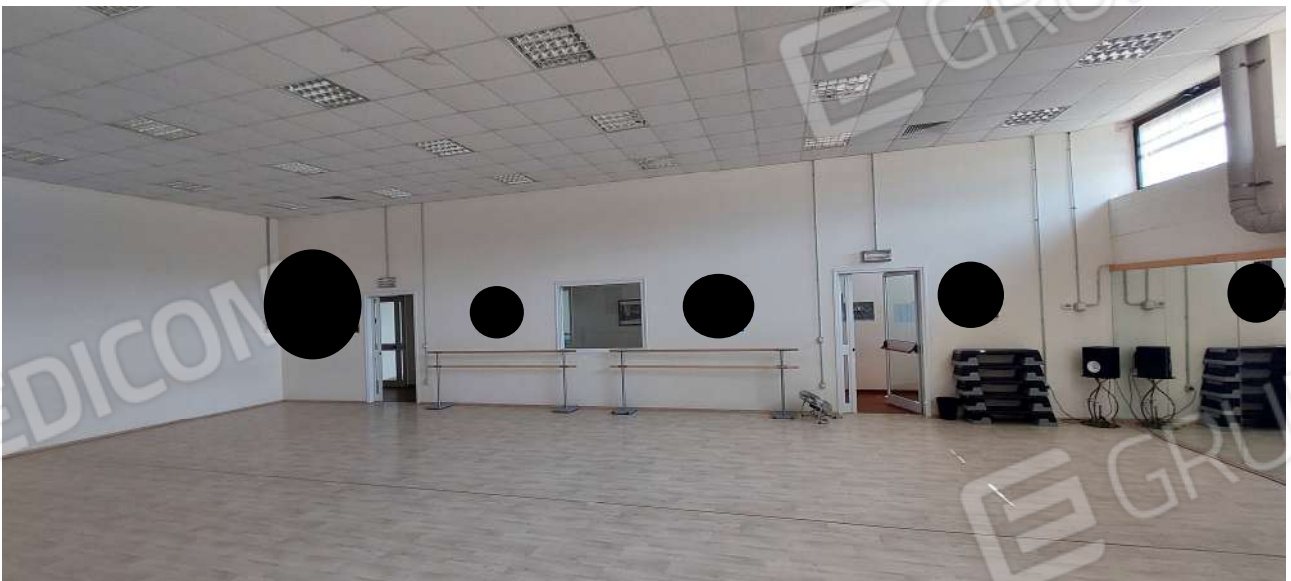
Sala attività n° 2