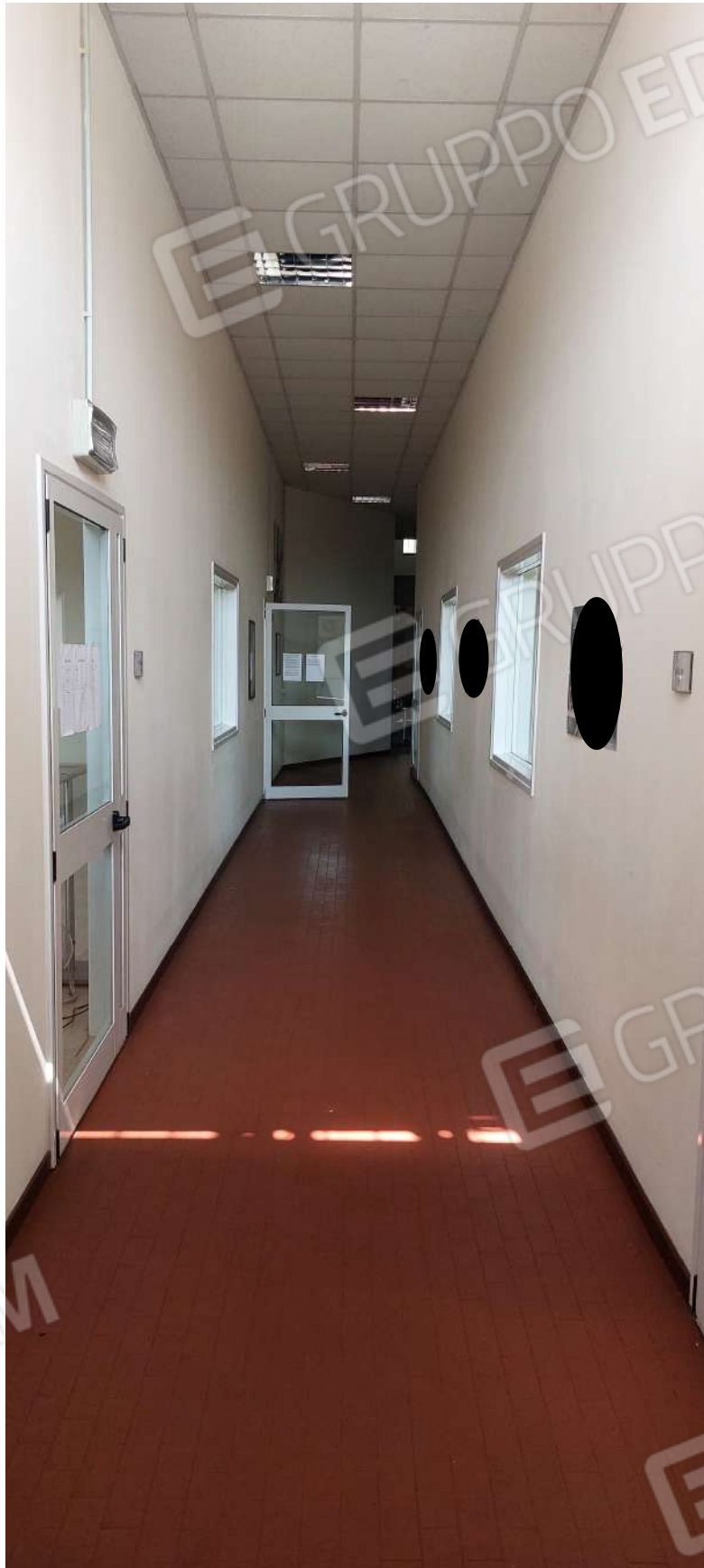
Corridoio centrale di distribuzione sale