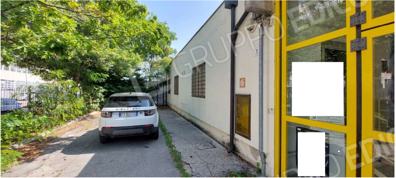
Area scoperta a uso esclusivo