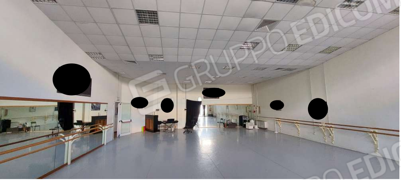
Sala attività n° 3