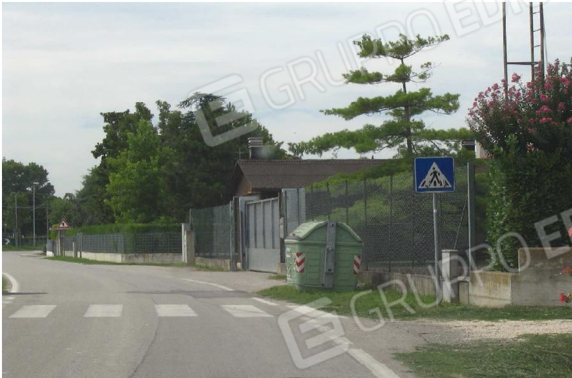
Foto 1 Passo carraio su Strada dei Sedici Laghi