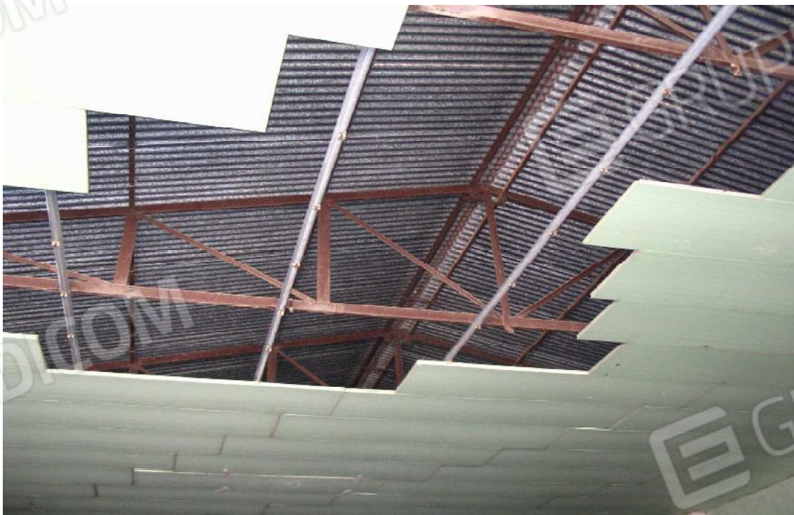
Foto 6 Interno capannone copertura