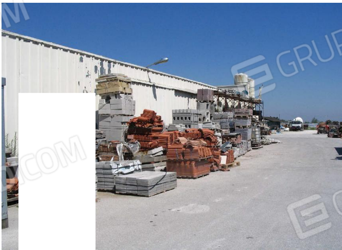
Foto 4 Esterno del capannone – visto dalla strada comunale verso la S.S. Romea