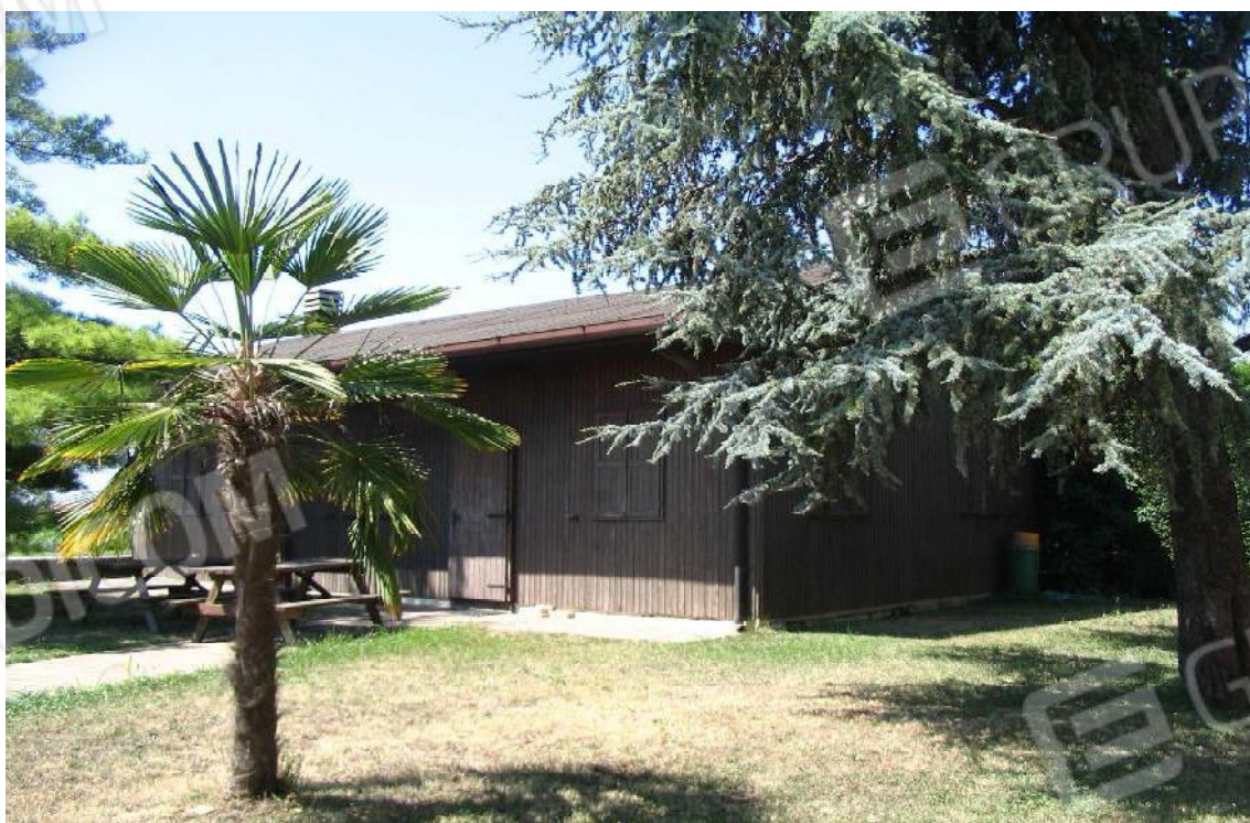
Foto 8 Edificio in legno adibito a mensa