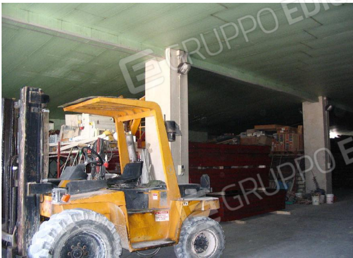
Foto 7 Interno capannone