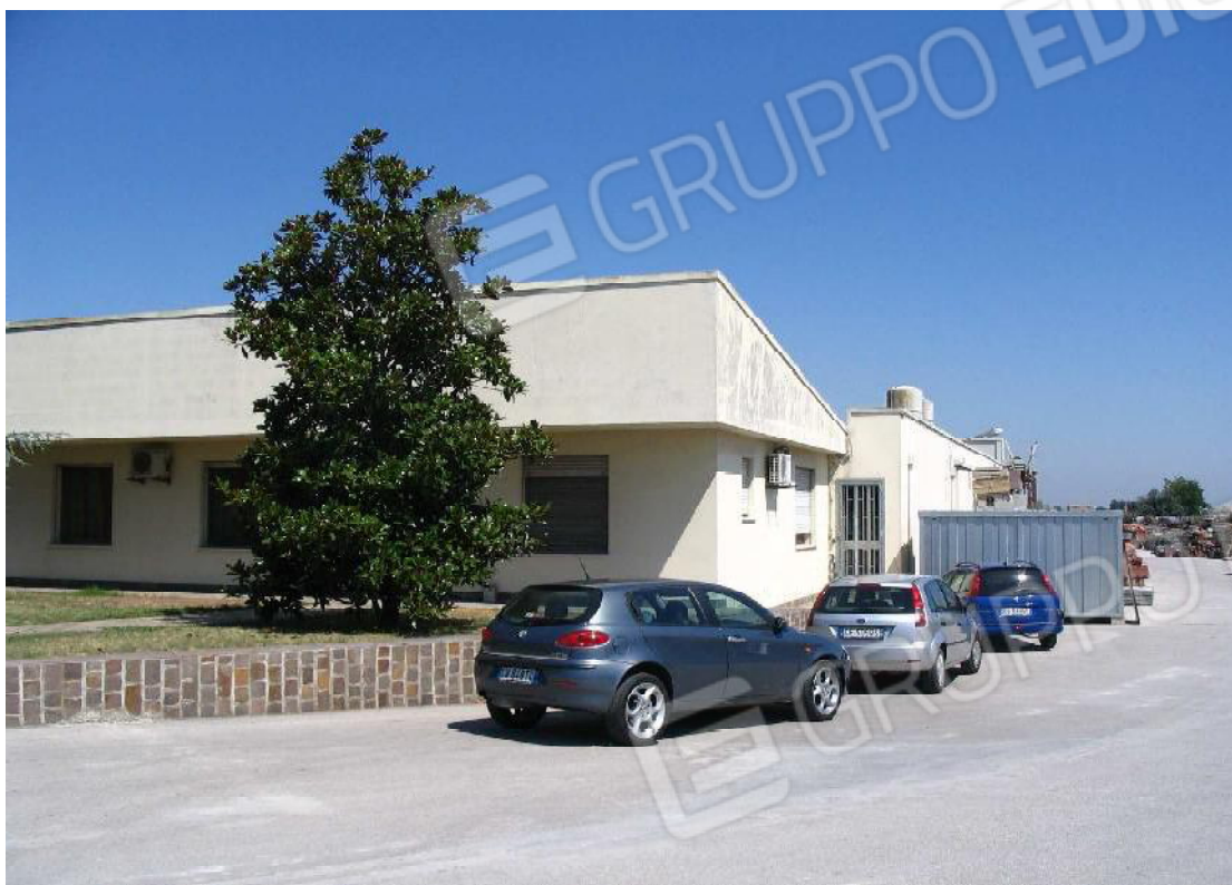
Foto 3 Uffici (di proprietà demaniale) e capannone – vista dalla strada comunale verso la S.S. Romea