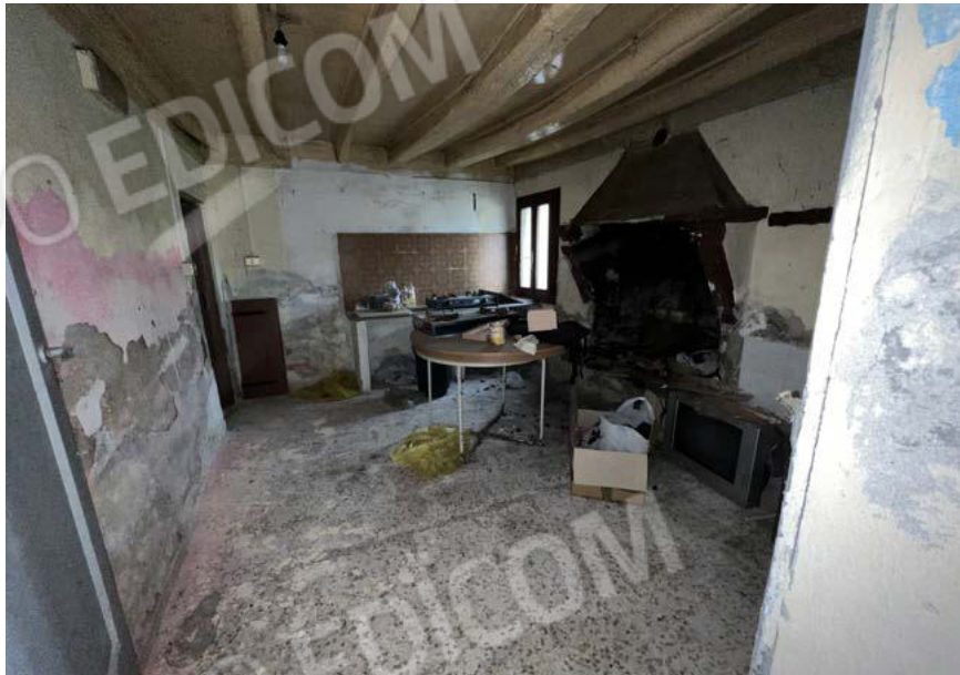
SUB. 5 - cucina 1 - PT