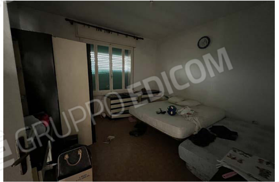
SUB. 5 - camera 2 - P1