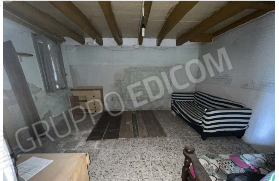
SUB.5 - soggiorno - PT