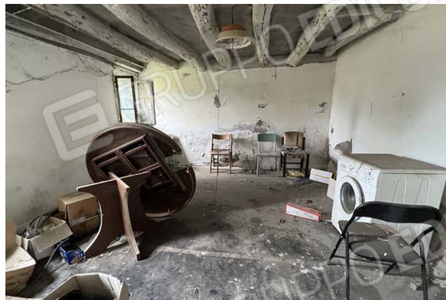
SUB. 5 - camera 3 ex cucina