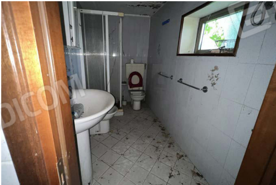
SUB. 5 - wc 1 - PT