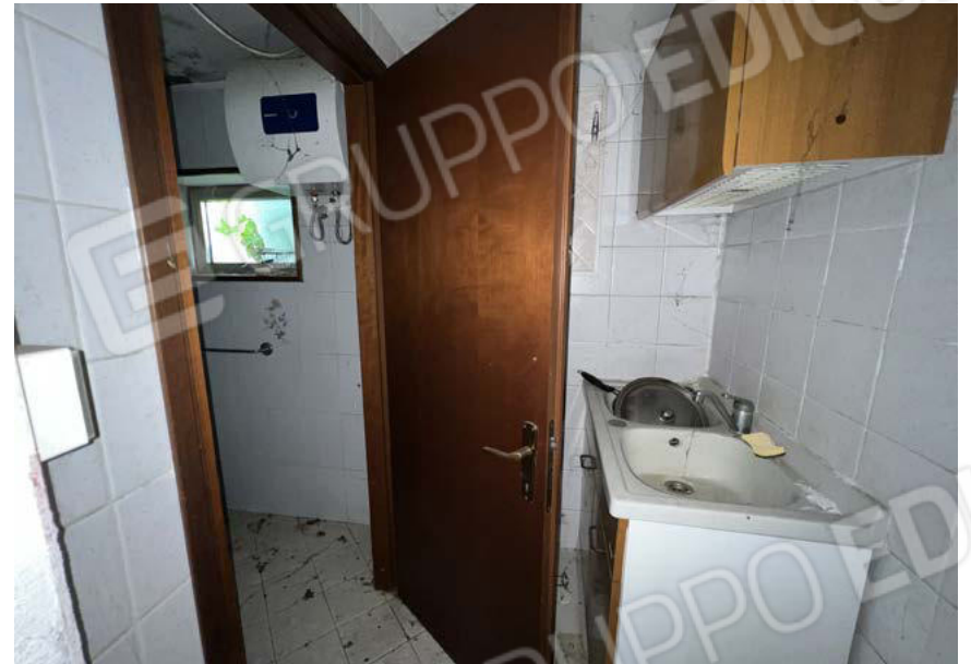
SUB. 5 - anti wc - PT