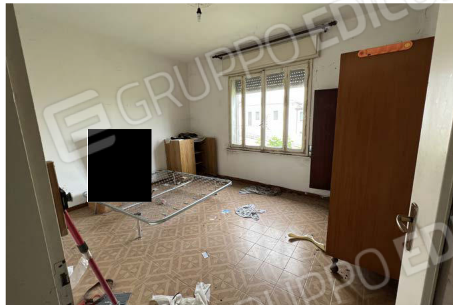
SUB. 5 - camera 1 - P1