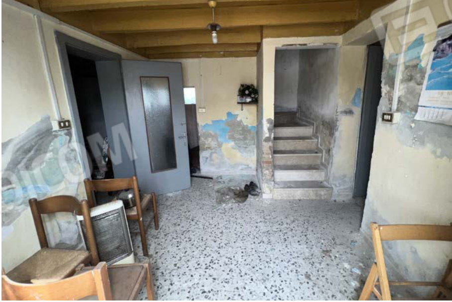
SUB. 5 - entrata 1 - PT