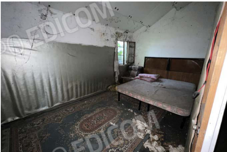
SUB. 5 - soffitta 2 - P1