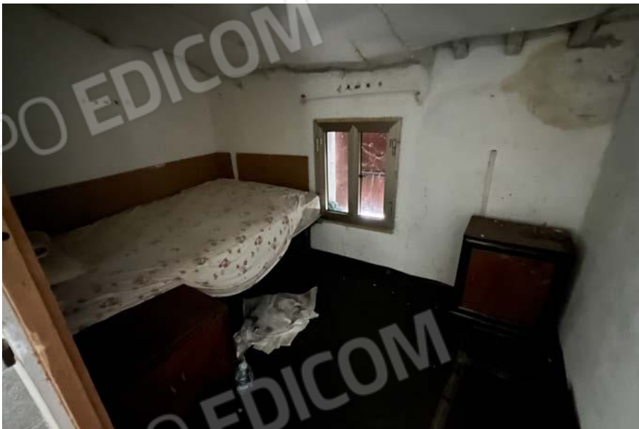
SUB. 5 - soffitta 3 (sanare tramezza) - P1