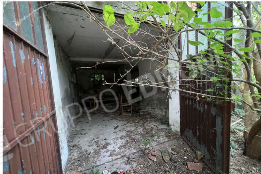
SUB. 3 - magazzino 4 - PT