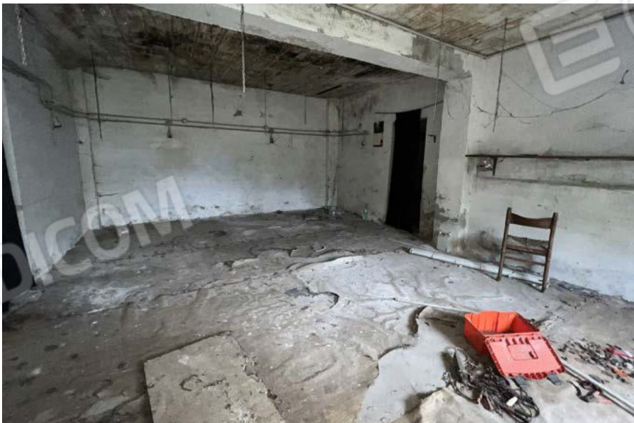
SUB. 3 - magazzino 3 con accesso a sub. 5 - PT