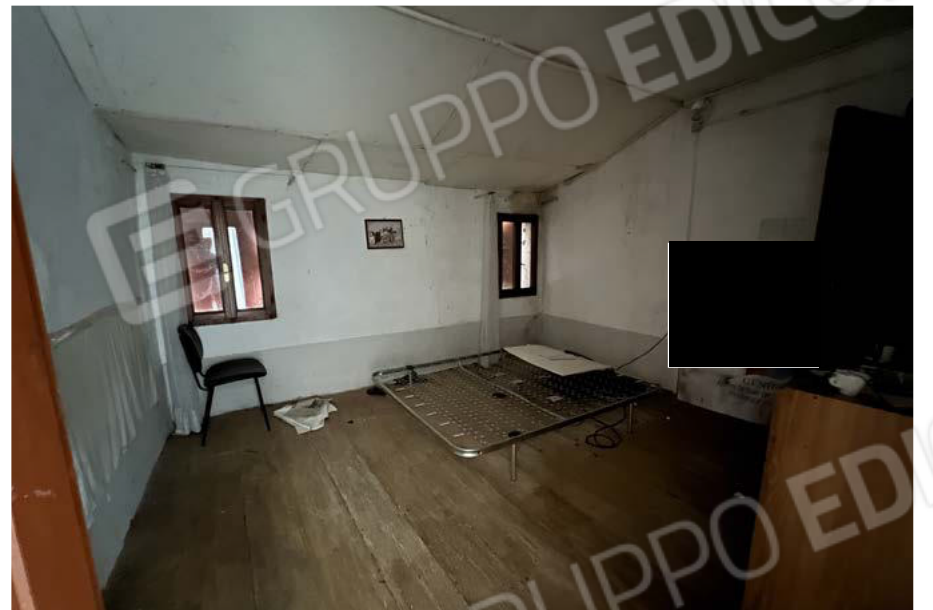
SUB. 5 - camera 4 - P1