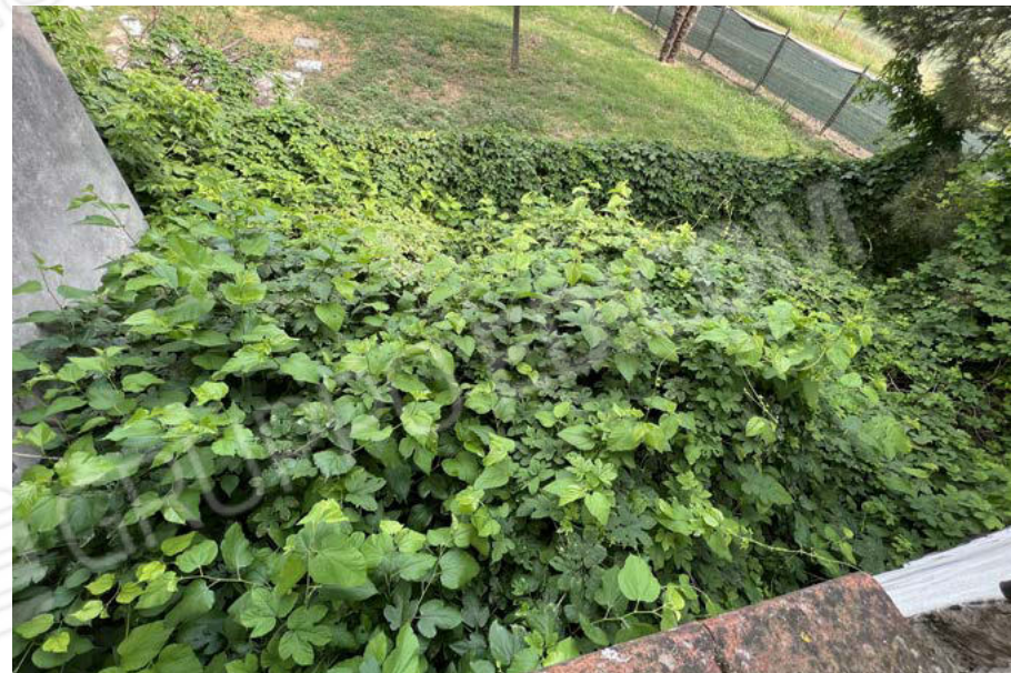
Vista accesso carraio e pedonale