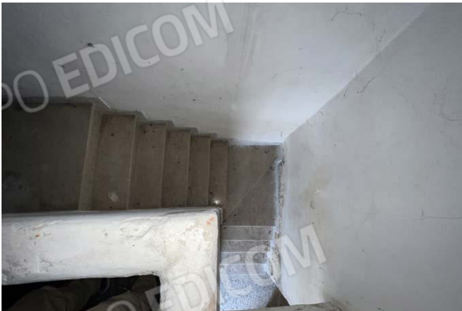
SUB.5 - scala di collegamento PT, P1