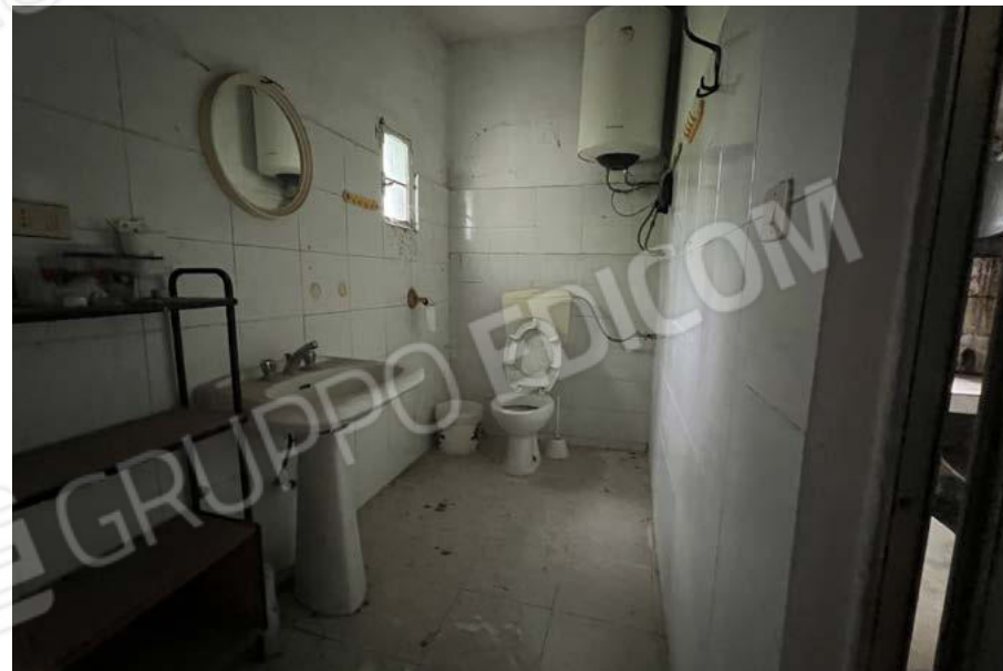
SUB. 5 - wc 2 da sanare ricavato dall'ex salotto