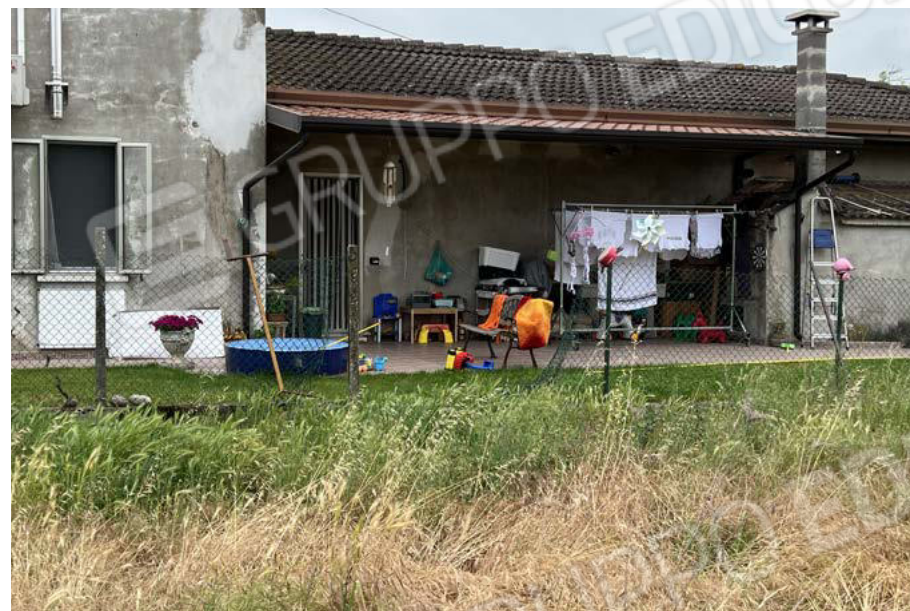
Vista porzione di recizione manomessa