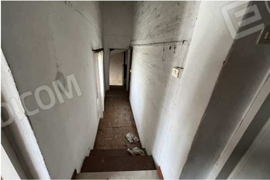
SUB. 5 - disimpegno 1 - P1