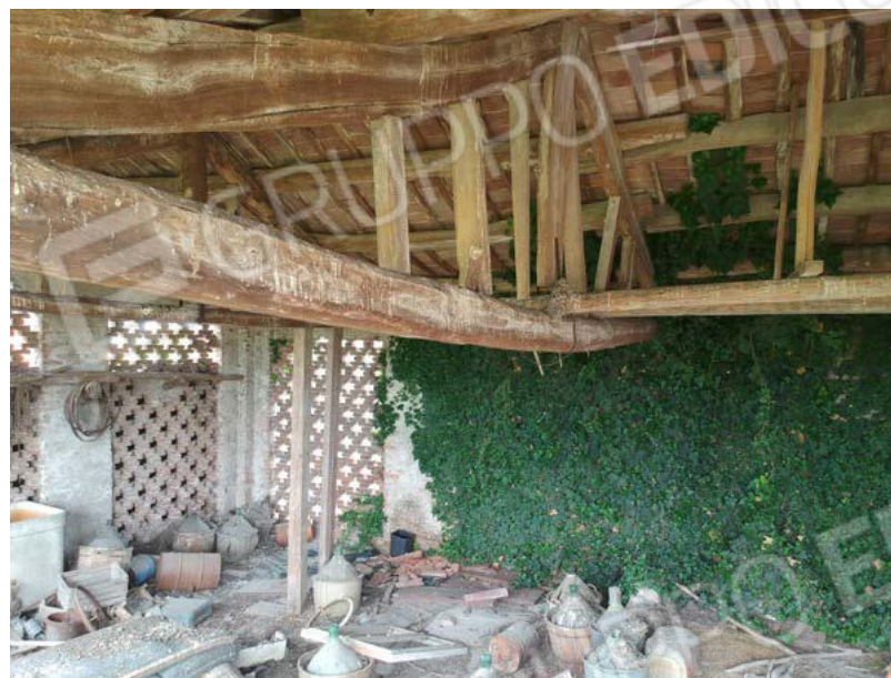
SUB. 3 - ripostiglio 2 inaccessibile (ex fienile) - P1