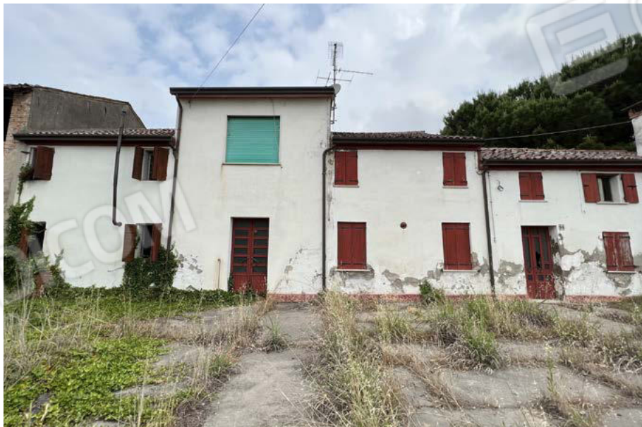
Vista fronte Est (lato strada) da corte comune sub. 4