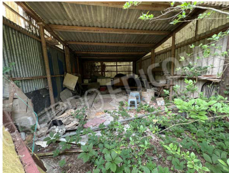
SUB. 3 - magazzino 1 (amianto da rimuovere/bonificare) - PT