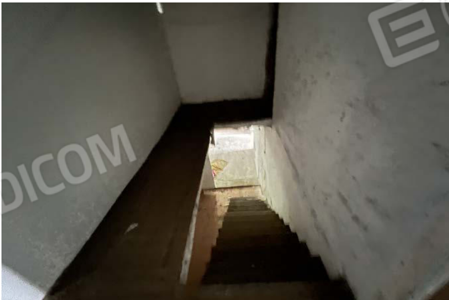
SUB. 5 - disimpegno con scala di accesso PT, P1