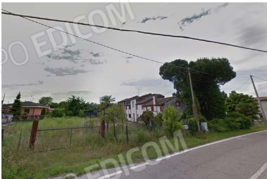
Vista fronte Sud