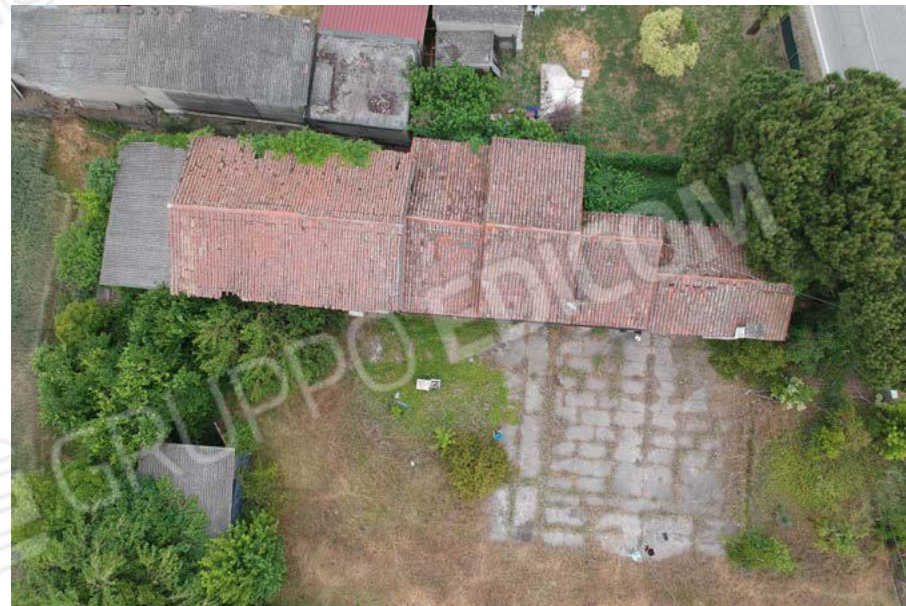
Vista aerea compendio con corte comune sub. 4