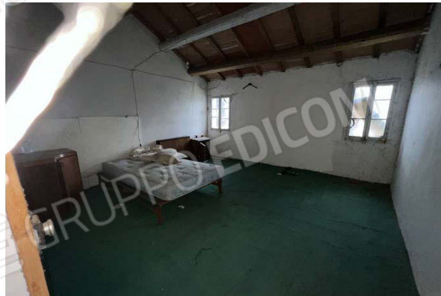
SUB. 5 - soffitta 1 - P1