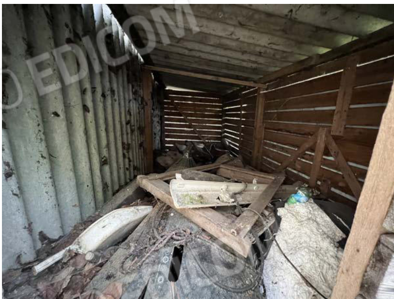
SUB. 3 - magazzino 2 (amianto da rimuovere/bonificare) - PT