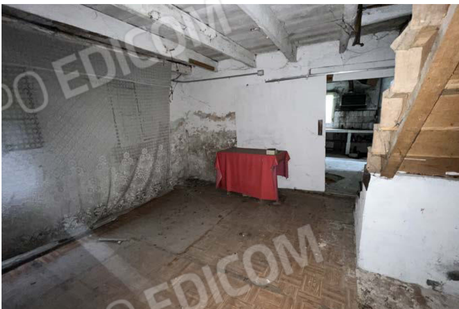
SUB. 5 - disbrigo con accesso a sub. 3