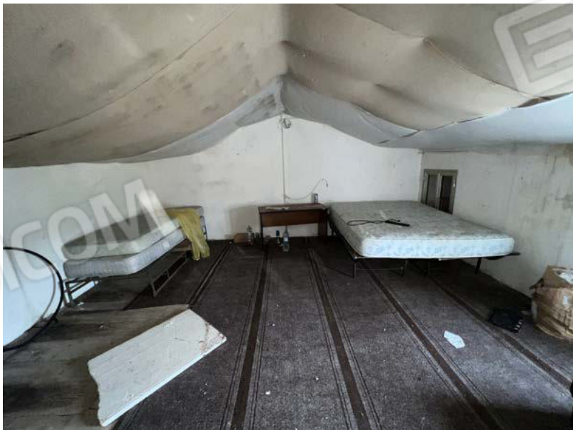
SUB. 5 - soffitta 4 - P1