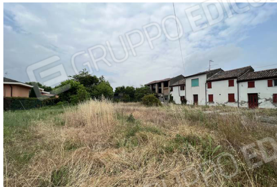
Vista fronte Nord da corte comune sub. 4