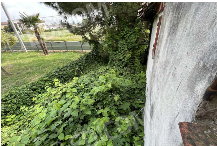
Vista corte retro inaccessibile