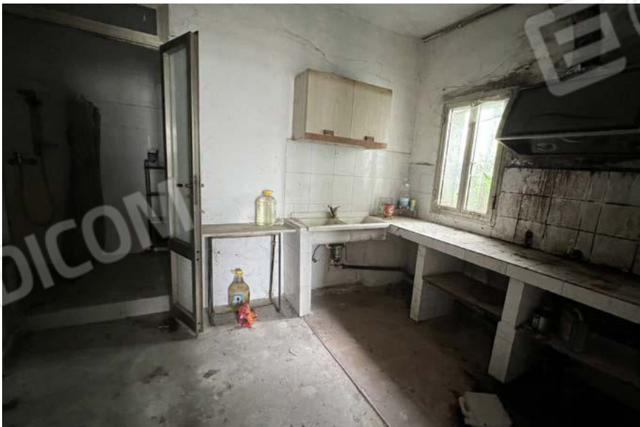
SUB. 5 - cucina 2 ex salotto