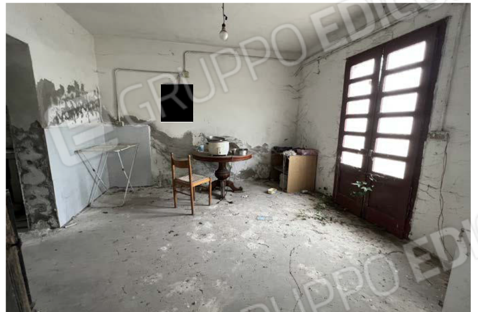
SUB.5 - entrata 2