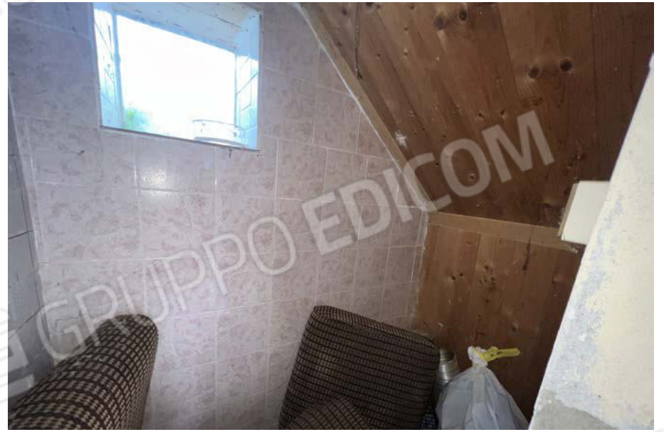
SUB. 5 - sottoscala - PT