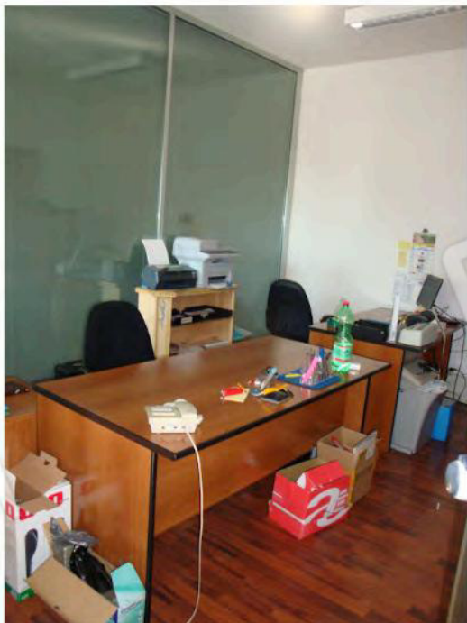
Interni dell'unità a piano primo mapp. 186 sub. 41