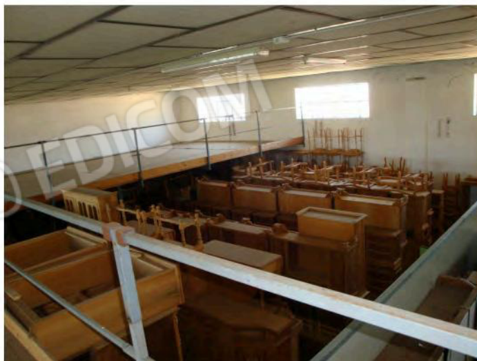
Interni mapp. 186 sub. 34