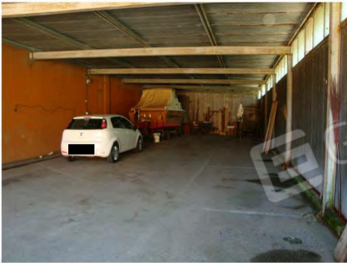
Interni u.i. mapp. 186 sub. 10