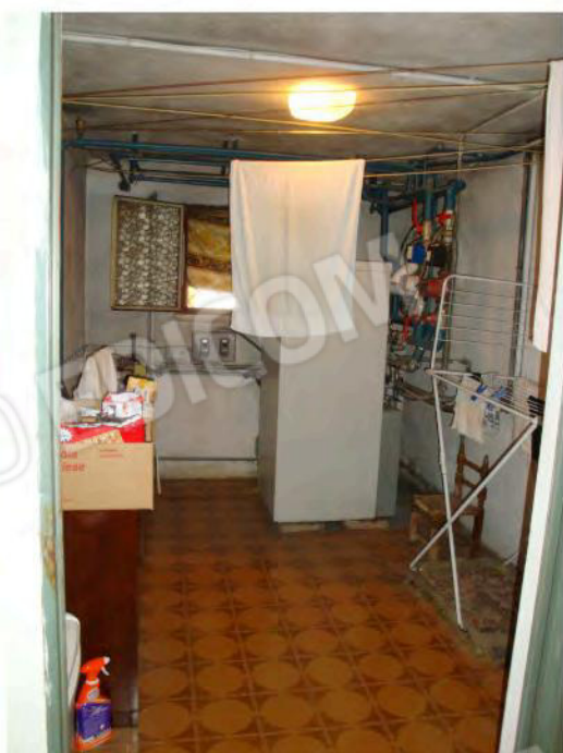
Interni dell'unità mapp. 186 sub. 1 CEU - piano seminterrato