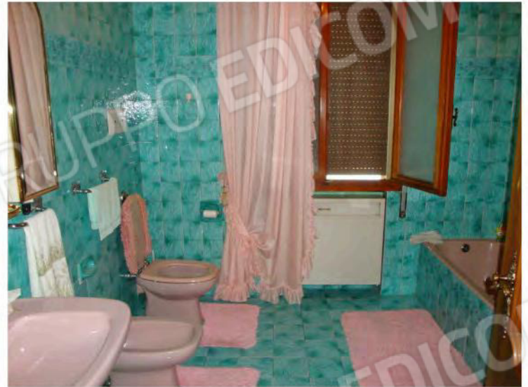
Interni dell'unità mapp. 186 sub. 1 CEU a piano rialzato e balcone