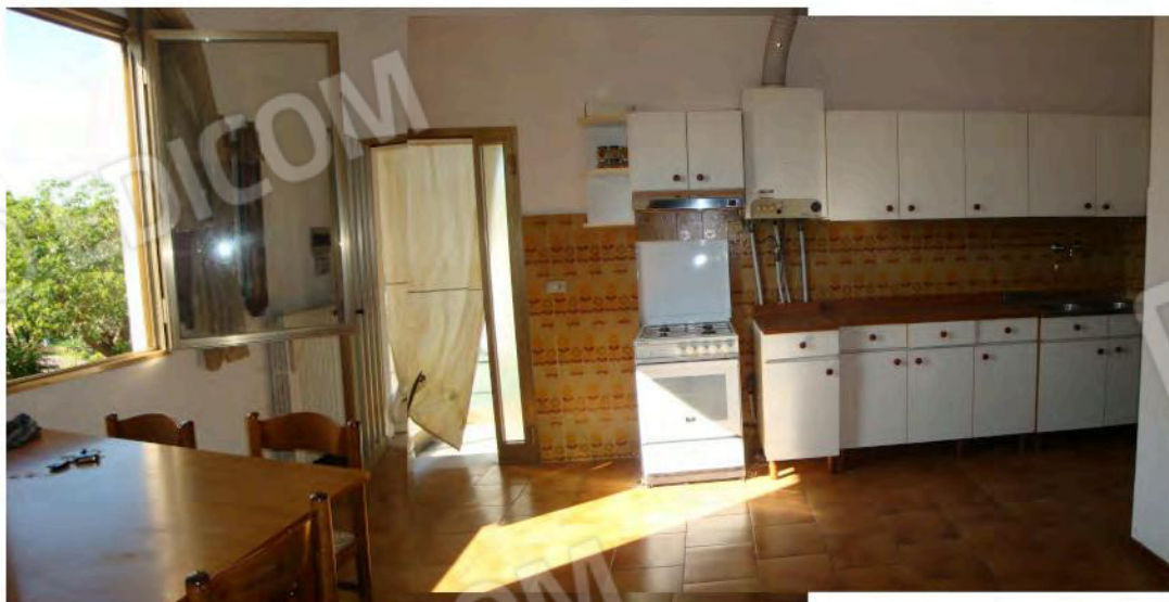
Interni dell'abitazione mapp. 186 sub. 7 a piano primo