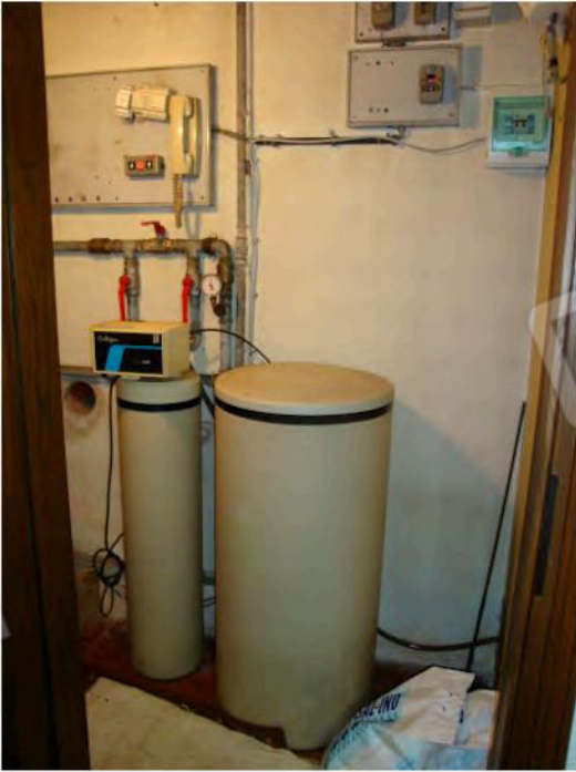
Autoclave posta nel sottoscala