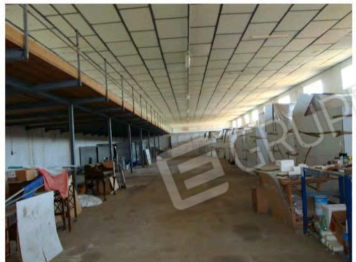
Interni mapp. 186 sub. 35