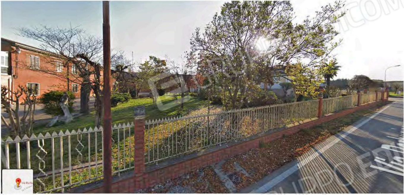
Individuazione generale del compendio sito in Cerea, Frazione S. Vito, Via Barbugine angolo Via Santi Martiri da estratti Google