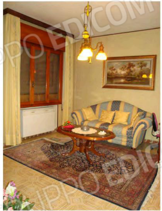
Interni dell'unità mapp. 186 sub. 1 CEU a piano rialzato