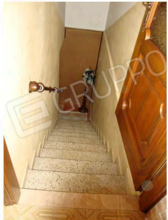
Scala per il piano rialzato