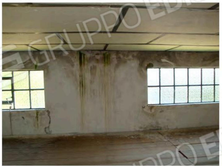
Interni u.i. mapp. 186 sub. 35