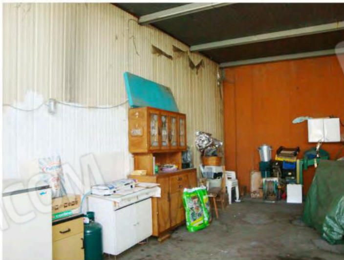
Interni u.i. mapp. 187 sub. 11