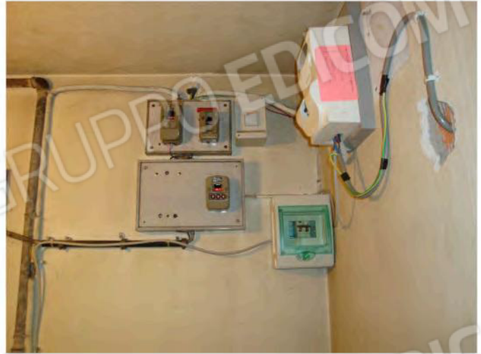
Interni dell'unità mapp. 186 sub. 1 CEU