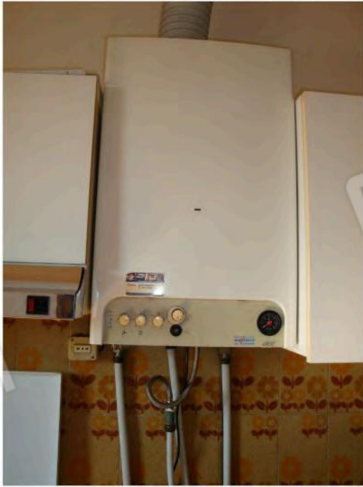
Interni dell'abitazione a piano primo mapp. 186 sub. 7 CEU