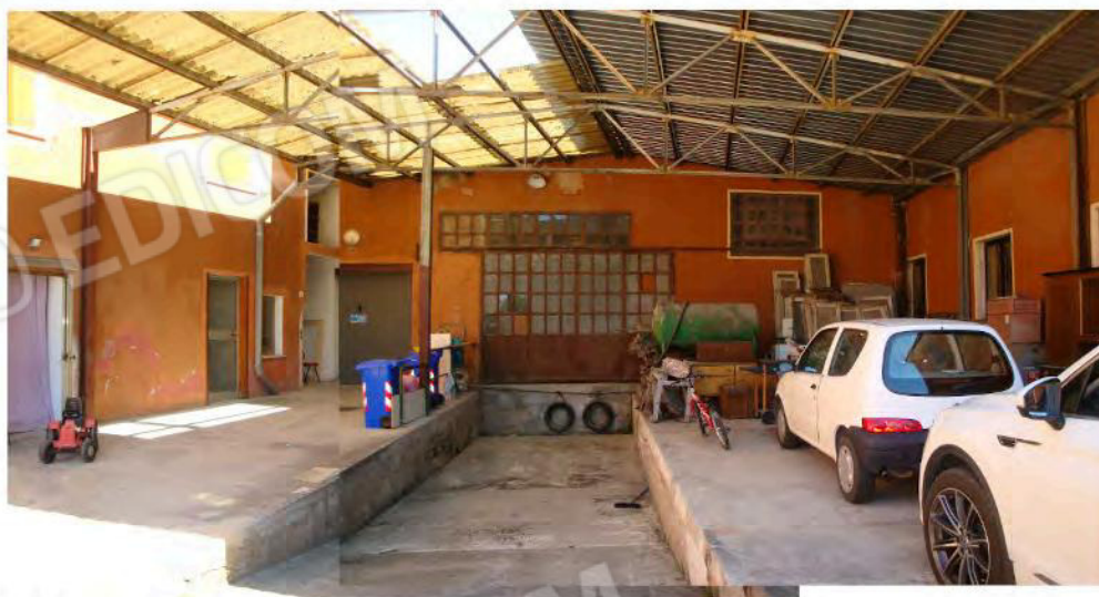
sub. 39 e, in profondità, accesso al sub. 37