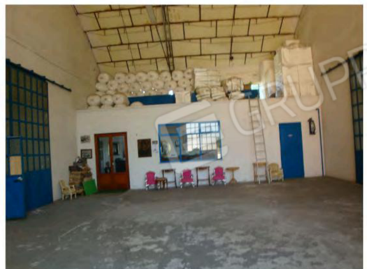
Interni u.i. mapp. 186 sub. 36