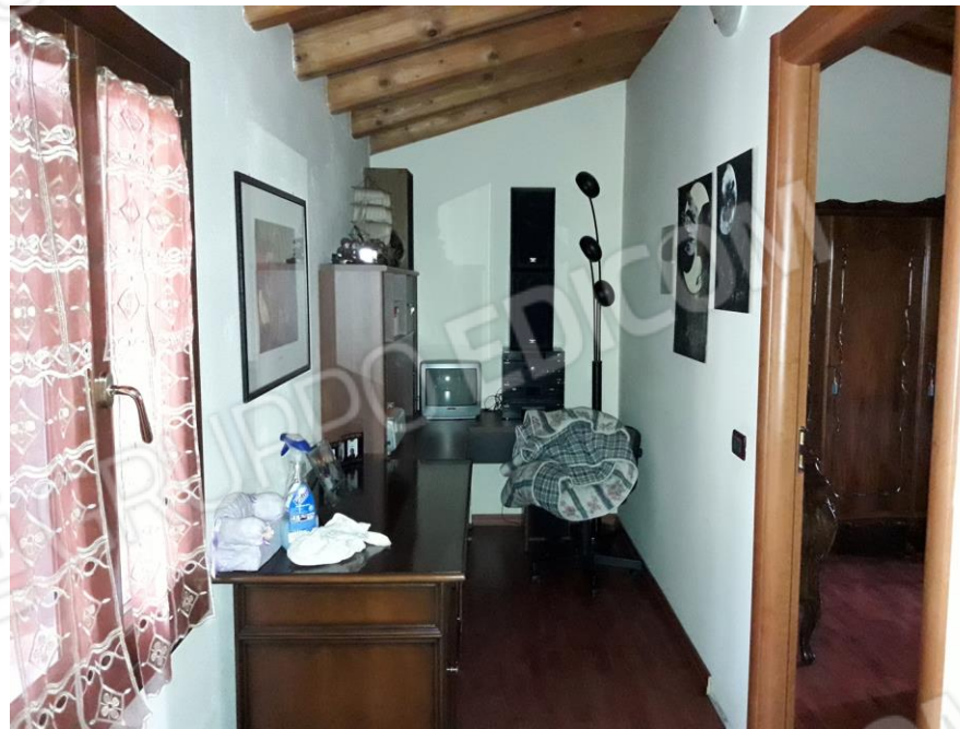
Piano Primo: Disimpegno