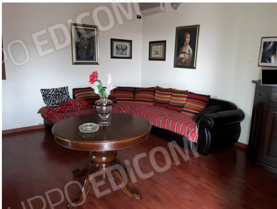
Piano terra: Soggiorno