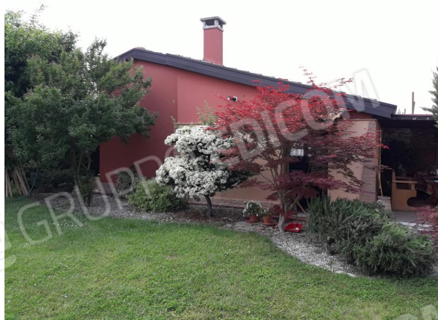
Vista del magazzino (mappale 857 sub.1)