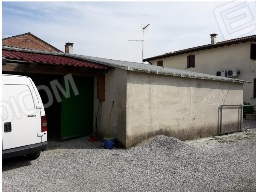
Vista del Garage (mappale 859 sub.1)