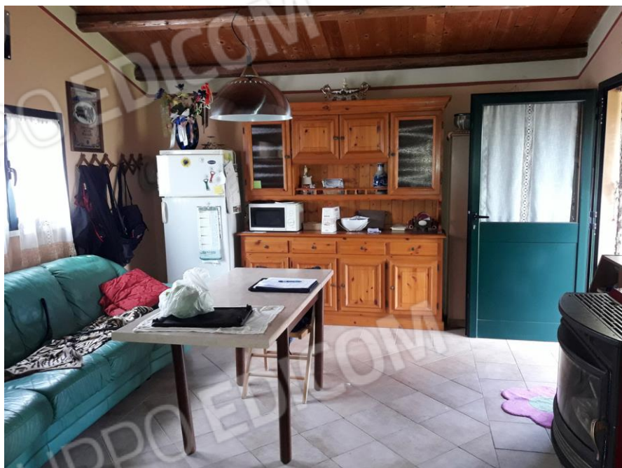
Piano terra: Taverna