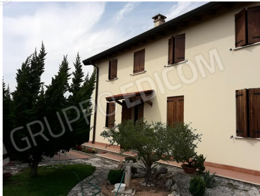
Vista dell'abitazione (mappale 855 sub.1)