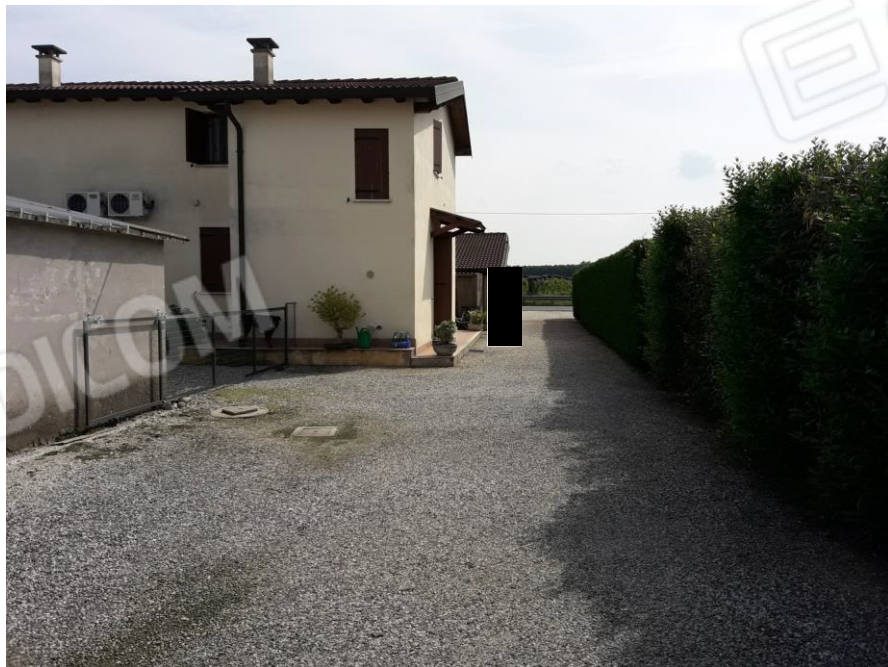
Stradello interno al lotto con accesso da Via Belvedere