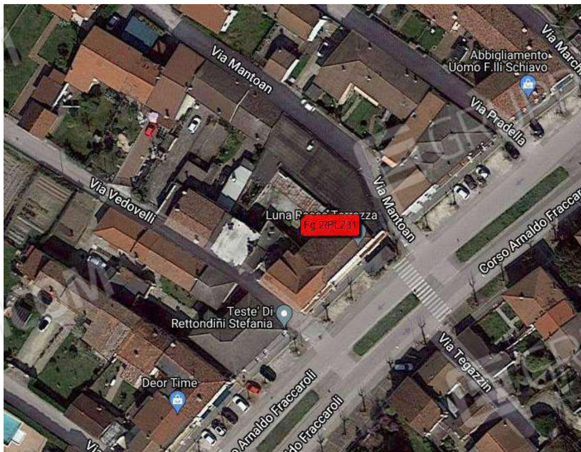
Estratto da Formaps, identificazione del compendio