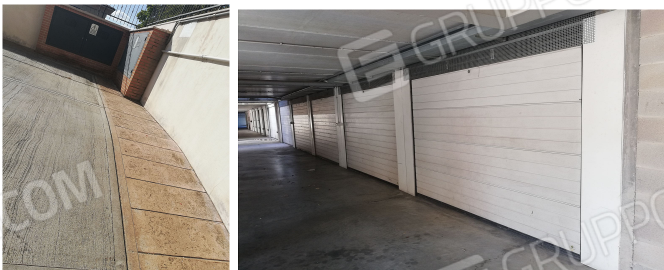
PARTICOLARI SCIVOLO E INTERRATO