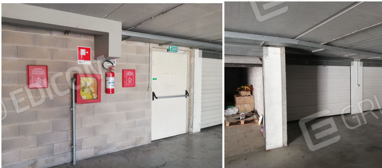
PORTA REI ANTIPANICO DETTAGLI INTERRATO