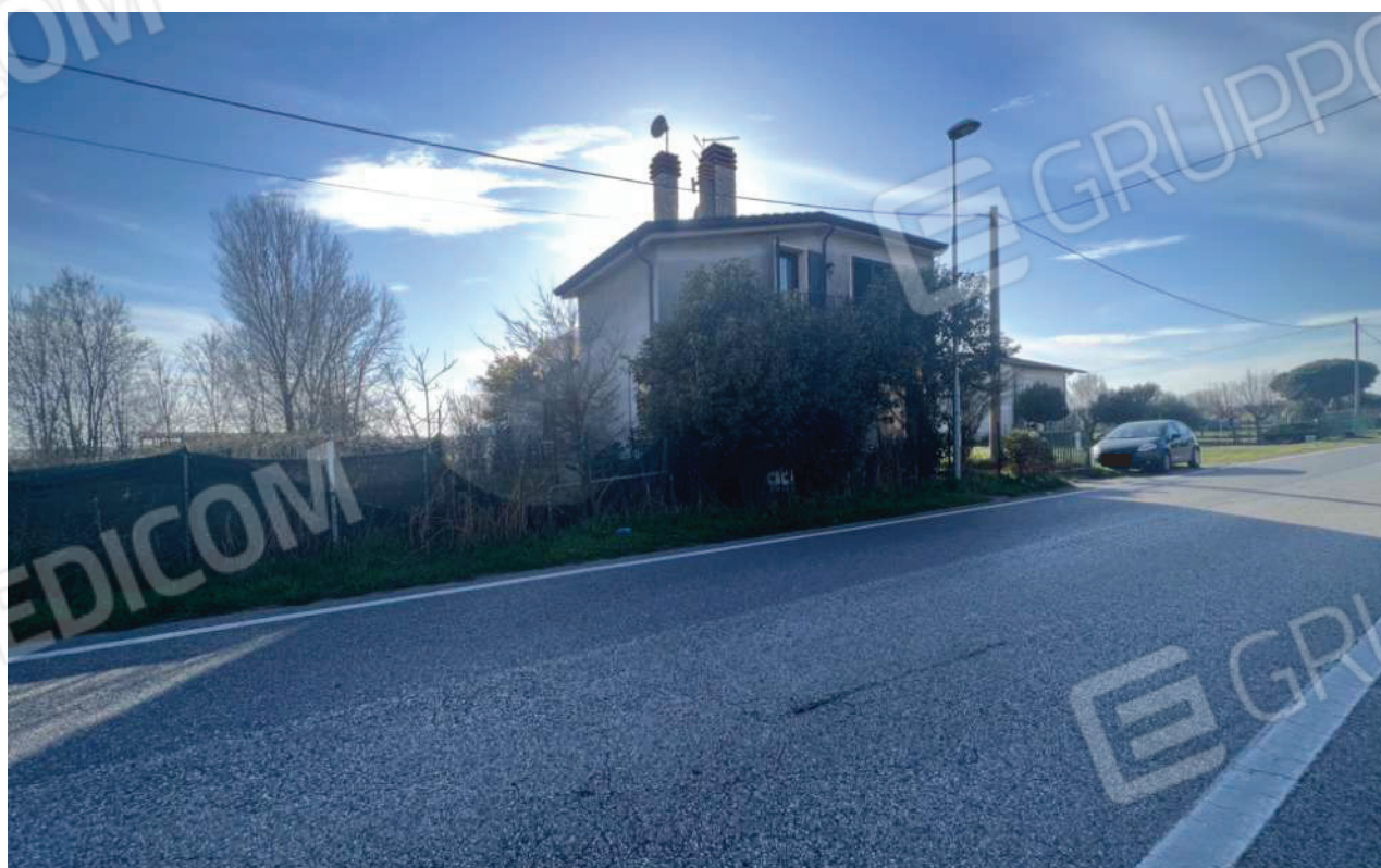
FOTO 2 - Fronte Nord, prospetto su Via Rivalta