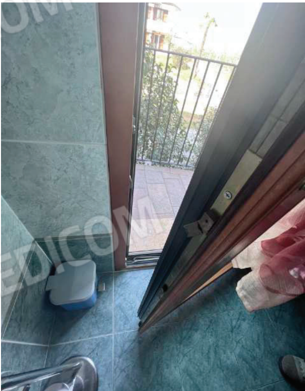
FOTO 17 - Porta finestra bagno