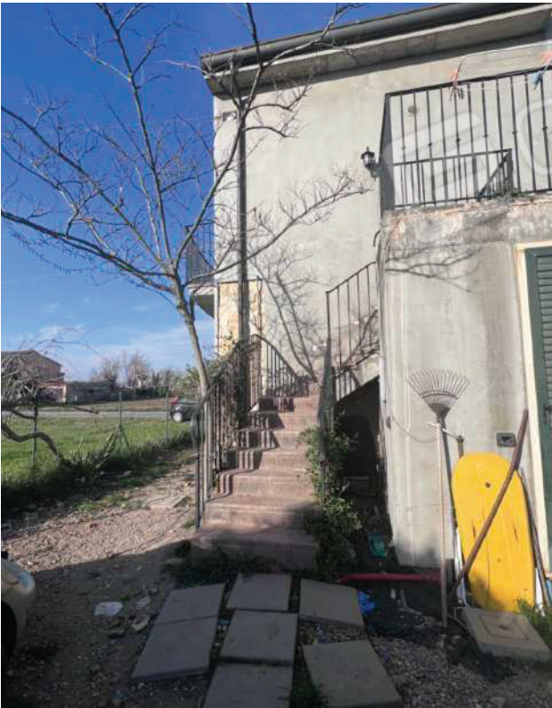
FOTO 6 - Scala di accesso unità prospetto Sud