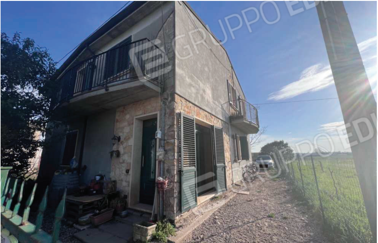
FOTO 3 - Vialetto carraio, prospetto Ovest