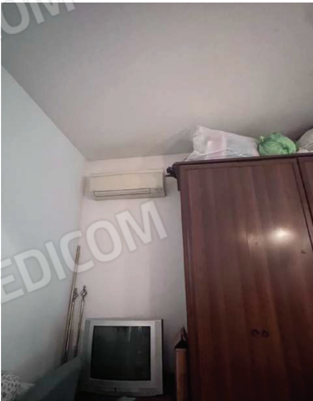
FOTO 21 - Split aria condizionata posizionata nella camera da letto