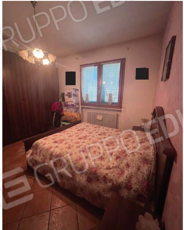
FOTO 20 - Camera da letto