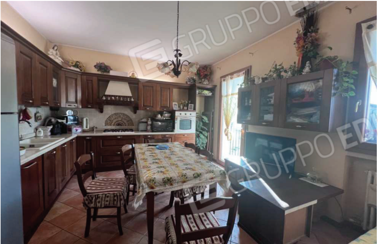
FOTO 12 - Cucina