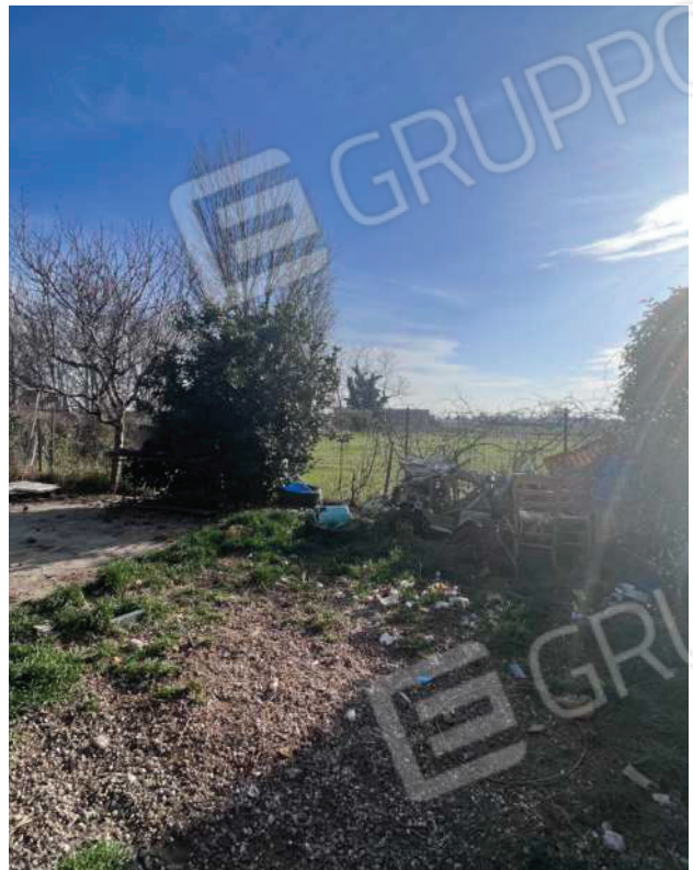
FOTO 9 - Area esterna su fronte Sud