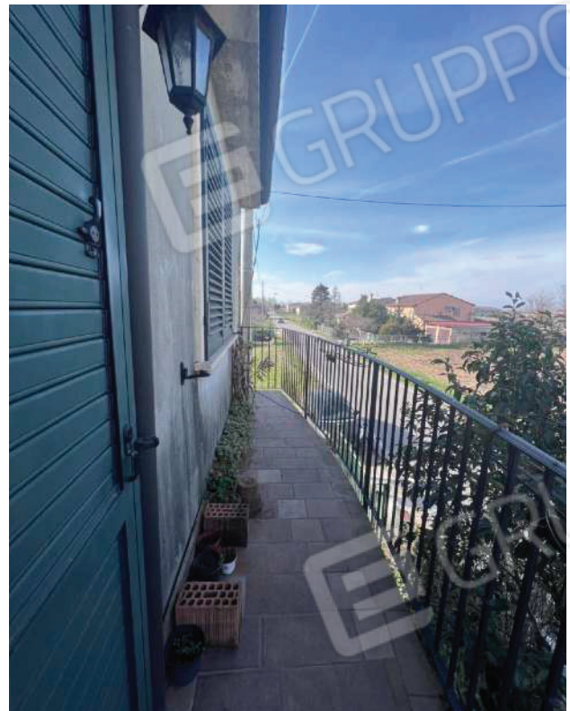
FOTO 18 - Balcone prospetto Nord