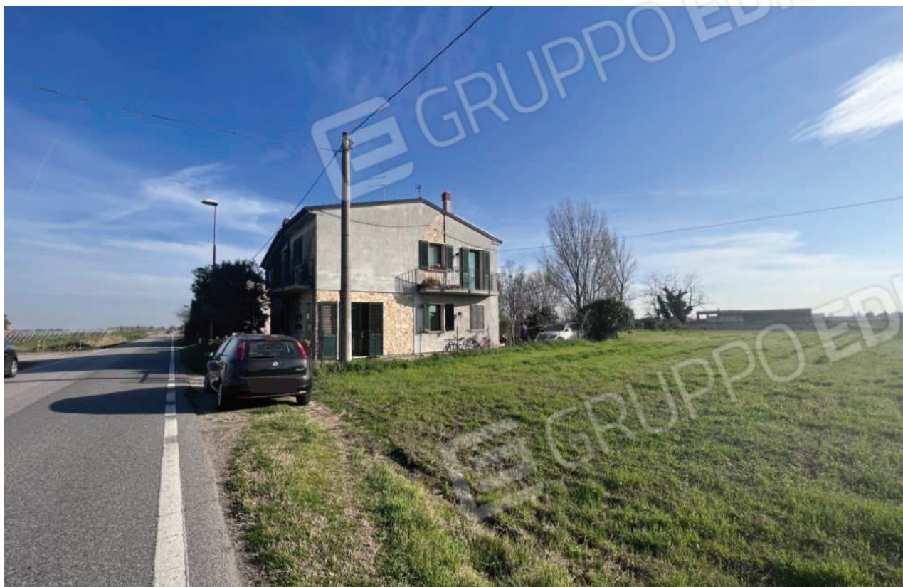
FOTO 1 - Fronte Nord-Ovest, ingresso su Via Rivalta