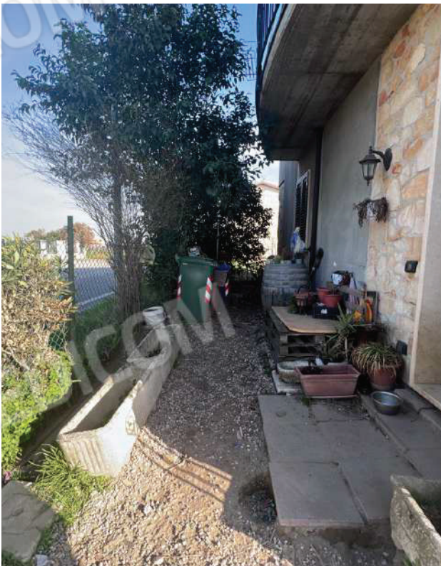
FOTO 4 - Passaggio pedonale prospetto Nord