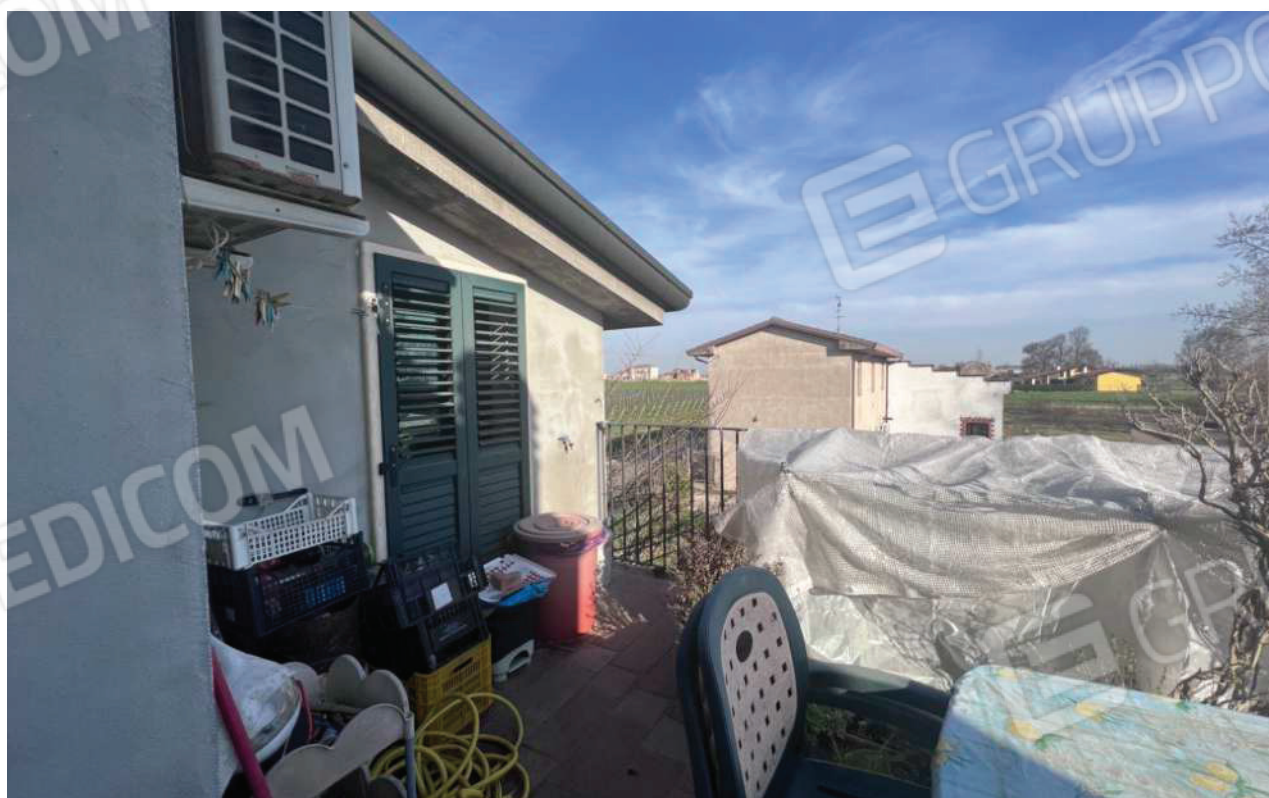
FOTO 11 - Terrazza esterna