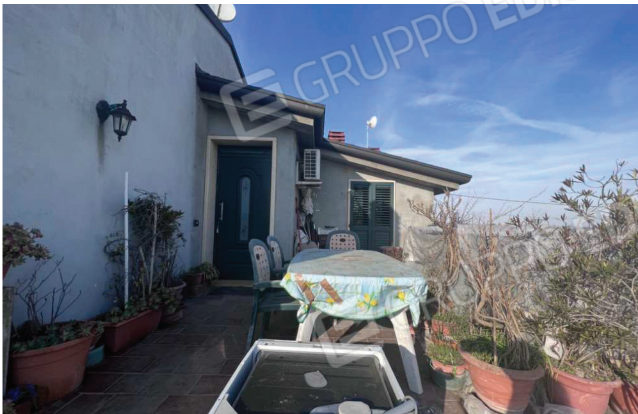
FOTO 10 - Terrazza esterna di ingresso