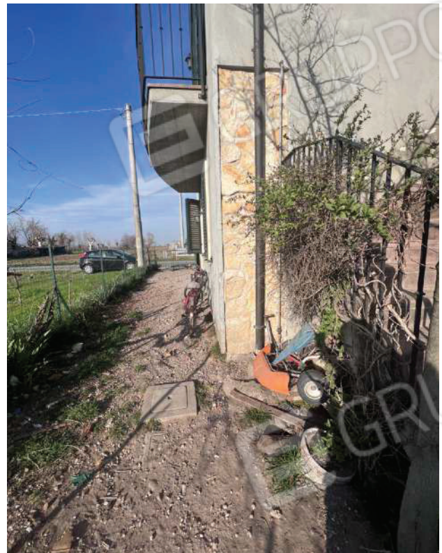
FOTO 5 - Passaggio carraio prospetto Ovest