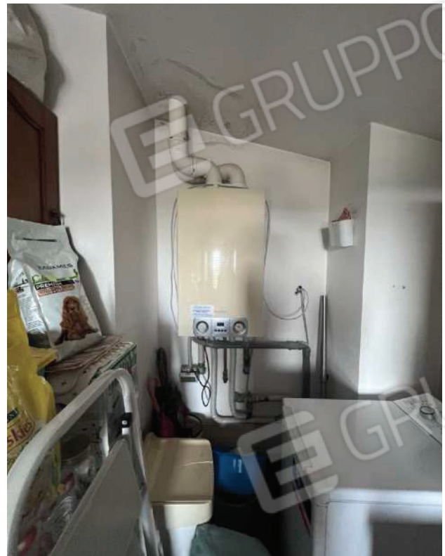
FOTO 14 - Locale ripostiglio