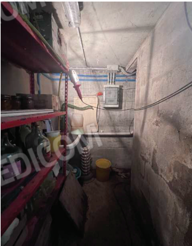
FOTO 8 - Cantina interrata