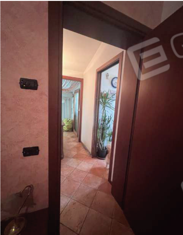
FOTO 19 - Porta ingresso camera da letto