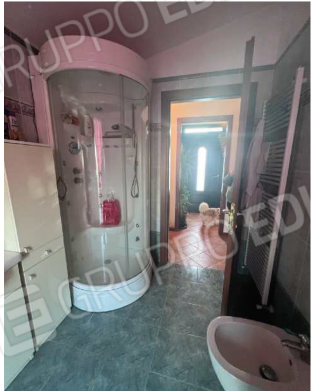
FOTO 16 - Bagno