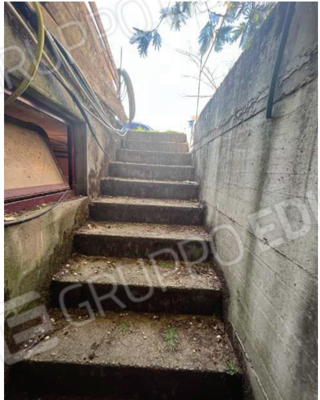
FOTO 7 - Scala esterna di accesso alla cantina interrata