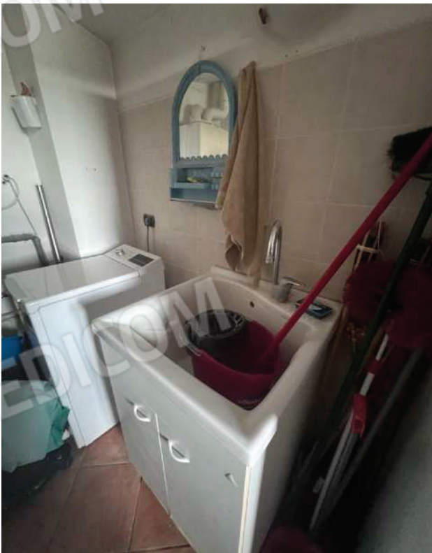
FOTO13 - Locale ripostiglio