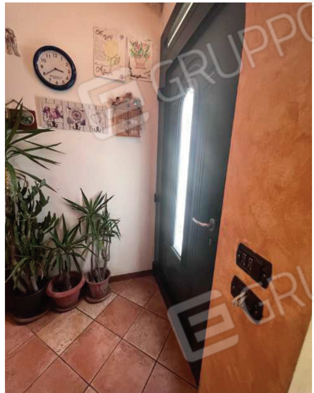
FOTO 22 - Ingresso