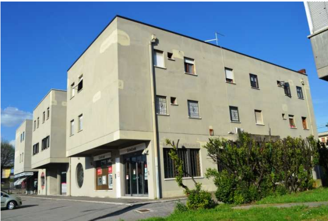
foto 5 - L'angolo sud ovest del condominio