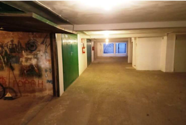
foto 20 - Vista da sud della corsia di manovra