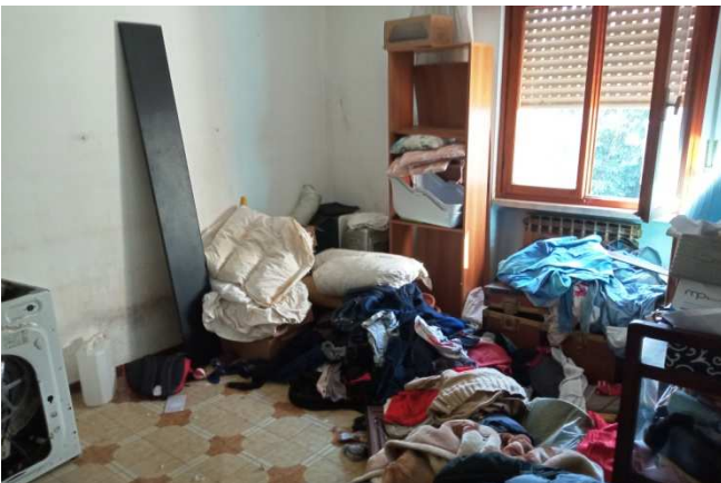
foto 17 - Vista del letto 2 con finestra sul fianco sud