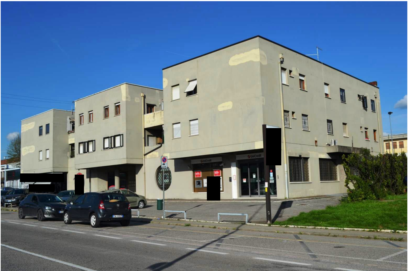
foto 3 - Prospetto ovest del Condominio EX GRATTACIELO in via Montanara n. 4 a Colognola ai Colli