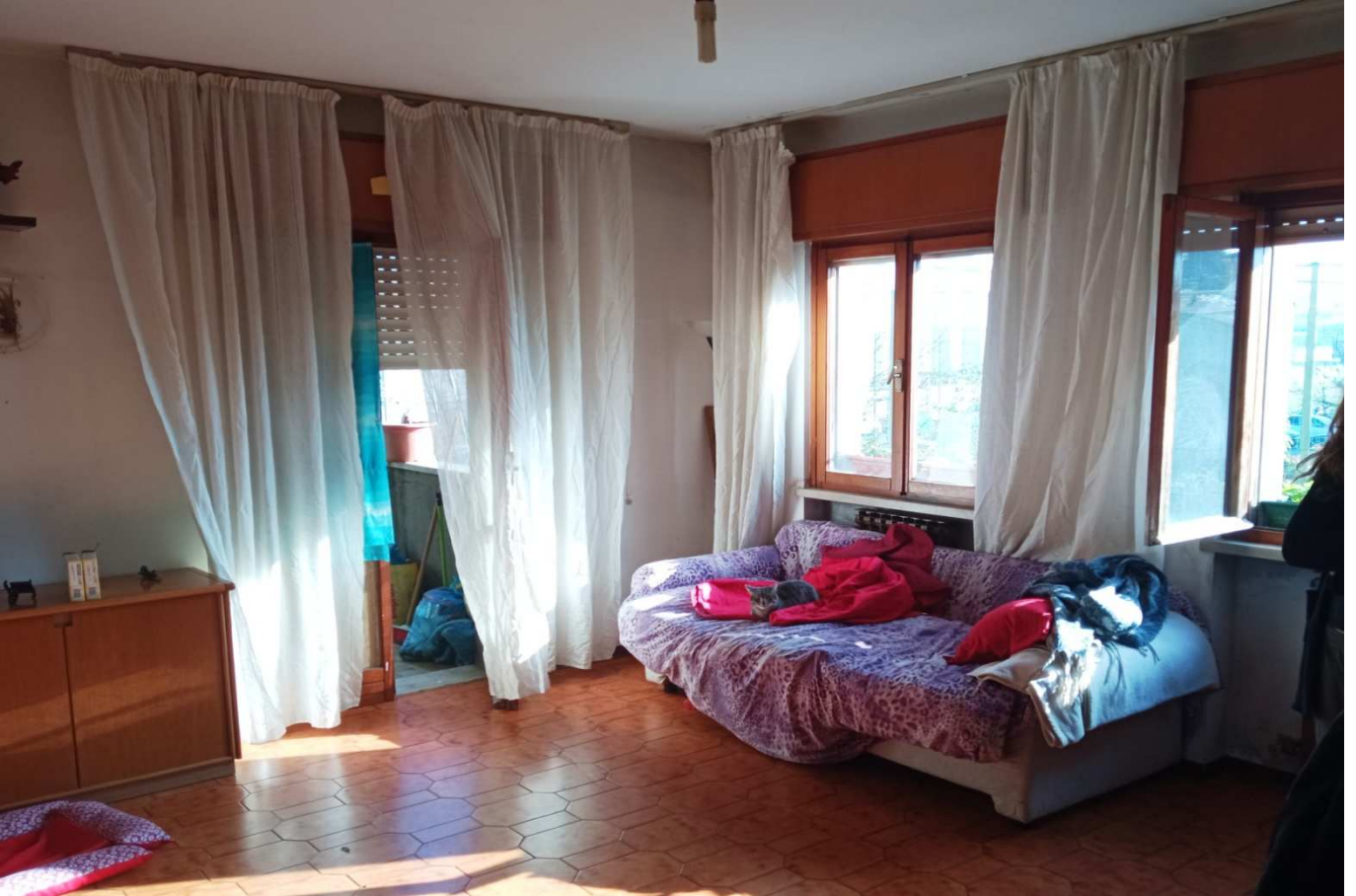
foto 9 - APPARTAMENTO in via Montanara 4, piano 1°, soggiorno - vista dall'interno del soggiorno