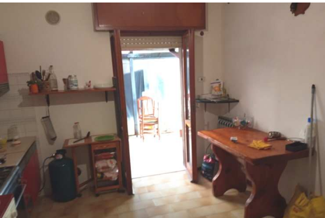
foto 12 - Vista interna della cucina