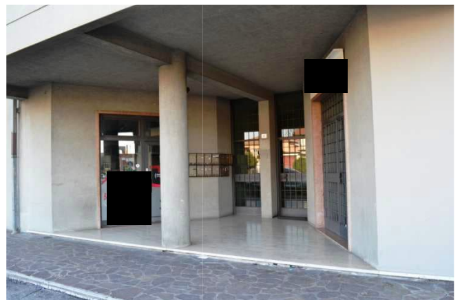
foto 8 - L'ingresso condominiale in via Montanara n. 4