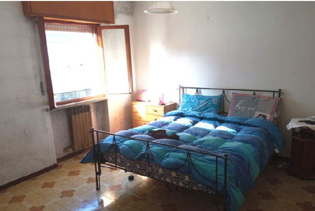
foto 15 - Vista del letto 1 con finestra sul fianco sud