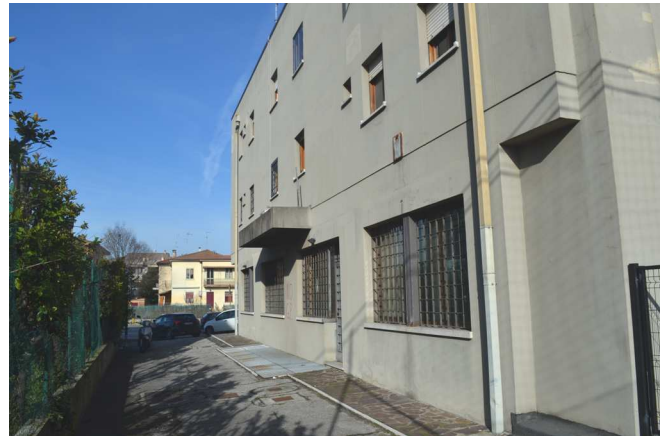
foto 6 - Vista da sud est del fianco sud dell'edificio