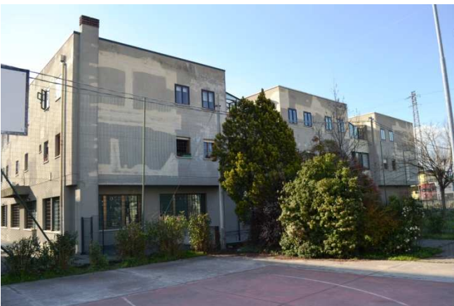
foto 7 - I prospetti sud e est con l'unità staggita a p. 1