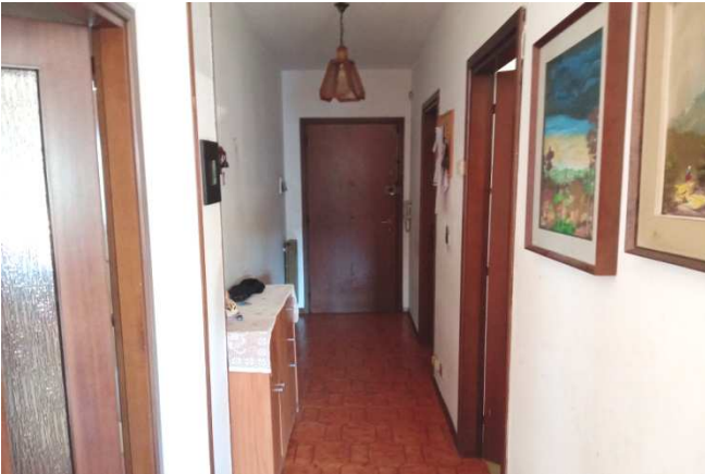
foto 10 - Vista del corridoio con l'ingresso dell'unità