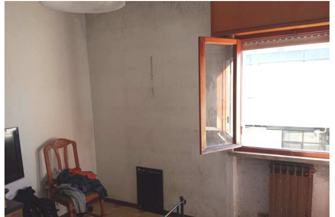
foto 16 - Particolare della parete sud del letto 1