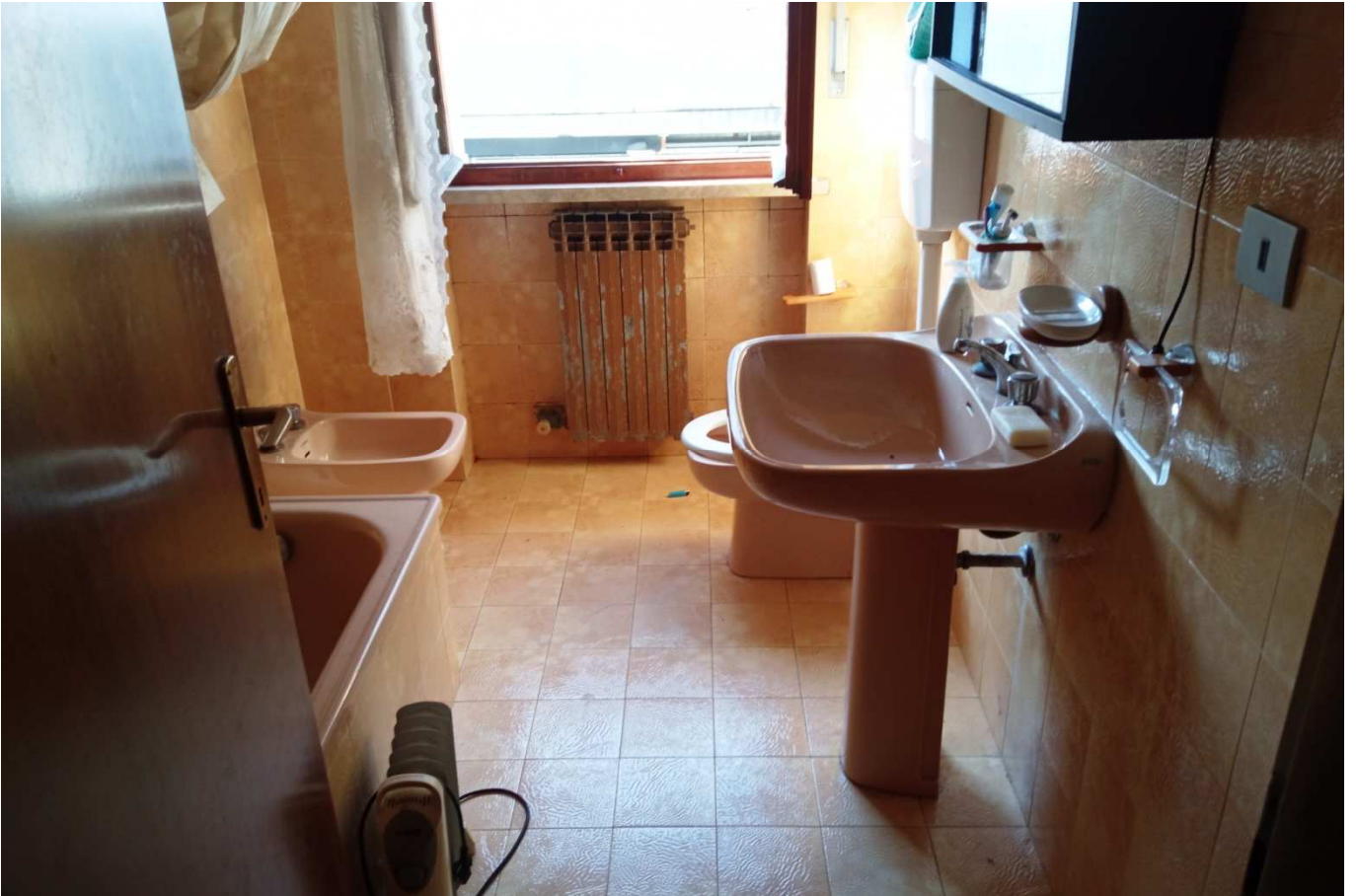
foto 14 - APPARTAMENTO in via Montanara 4, piano 1°, bagno T con finestra sul fianco sud