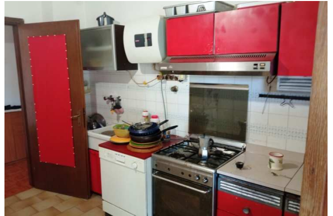
foto 11 - Scorcio della parete attrezzata della cucina