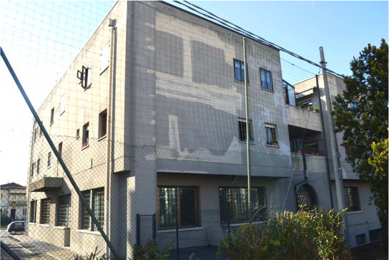
foto 4 - Scorcio dell'angolo sud est dell'edificio con l'unità staggita al piano 1° (al centro nella foto)