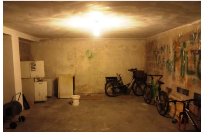
foto 21 - Interno dell'autorimessa m.n. 1381 sub 18