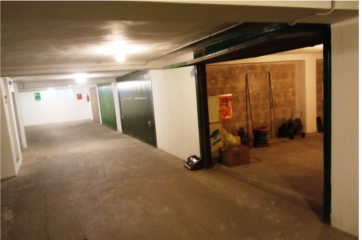
foto 19 - APPARTAMENTO in via Montanara 4, piano S2, autorimessa m.n. 1381 sub 18