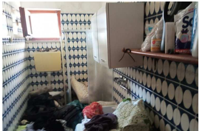
foto 18 - Scorcio interno del W.C. e lavanderia