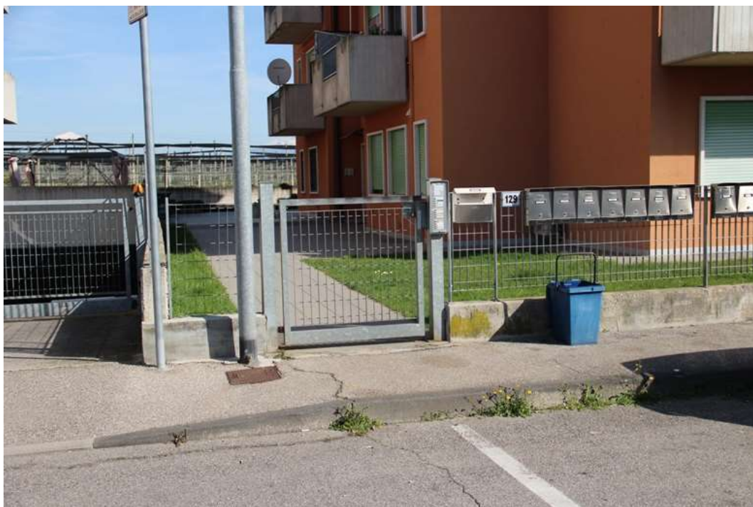
3. Cancellotto di ingresso pedonale