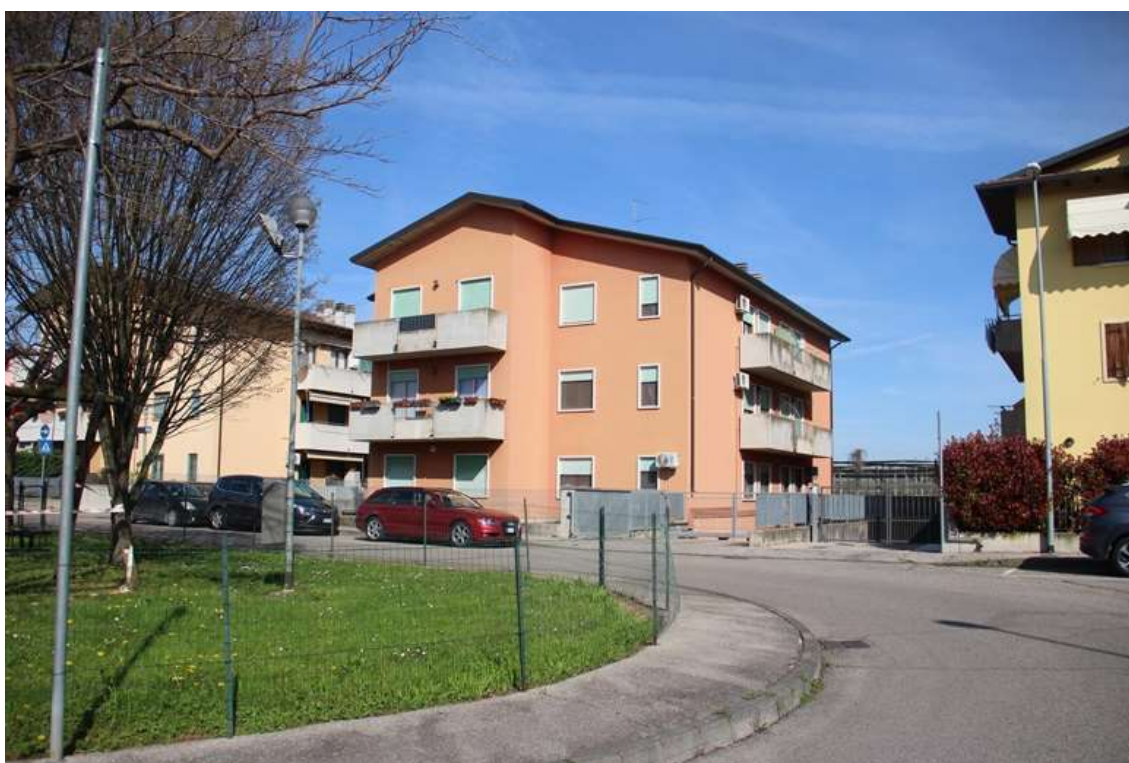
2. Vista dell'edificio