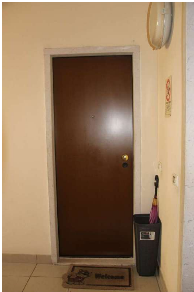
5. Portoncino di ingresso all'appartamento