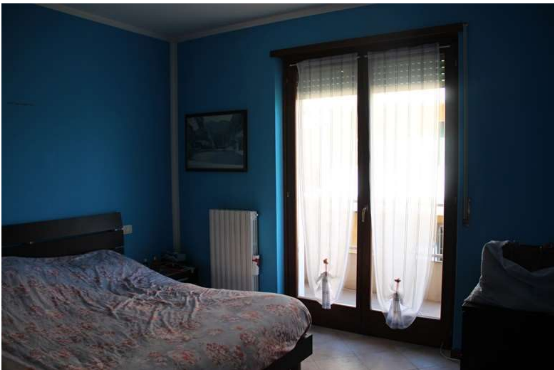
8. Camera da letto doppia