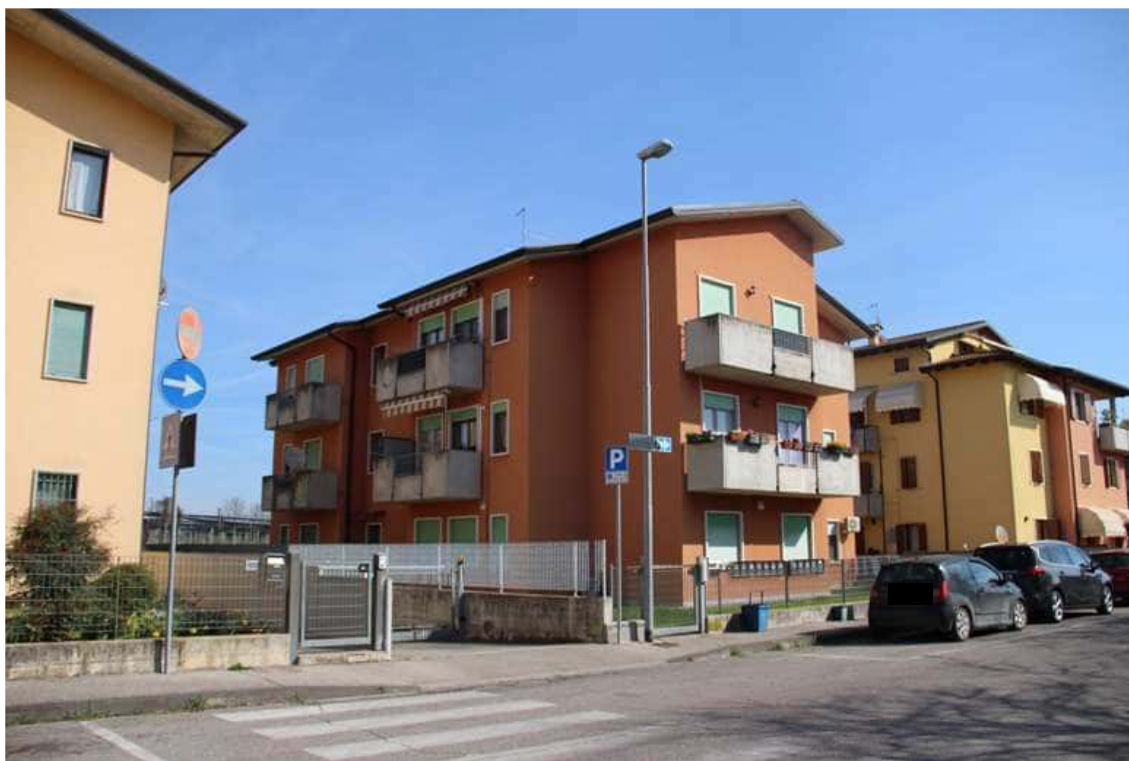
1. Vista dell'edificio