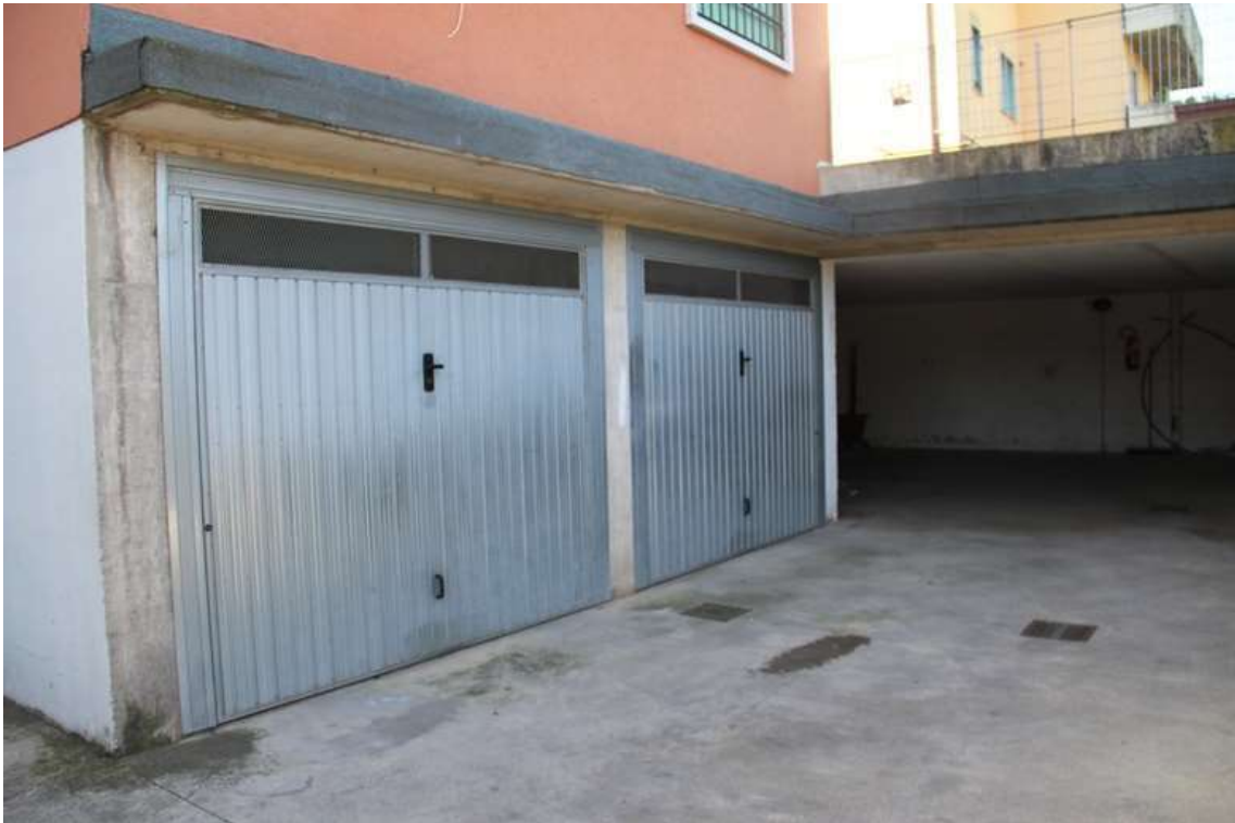
11. Area di manovra e portone autorimessa