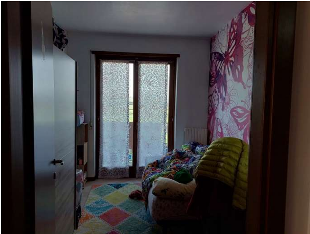
9. Camera da letto singola