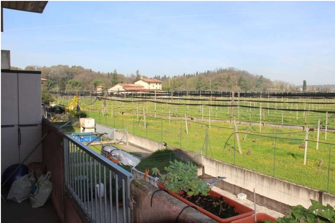
7. Balcone della zona giorno