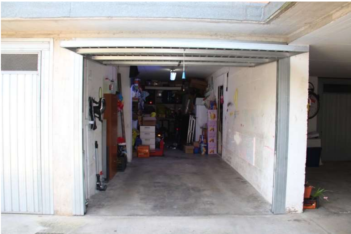
12. Autorimessa e porta di accesso alla cantina