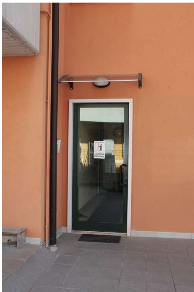
4. Portoncino di ingresso all'edificio