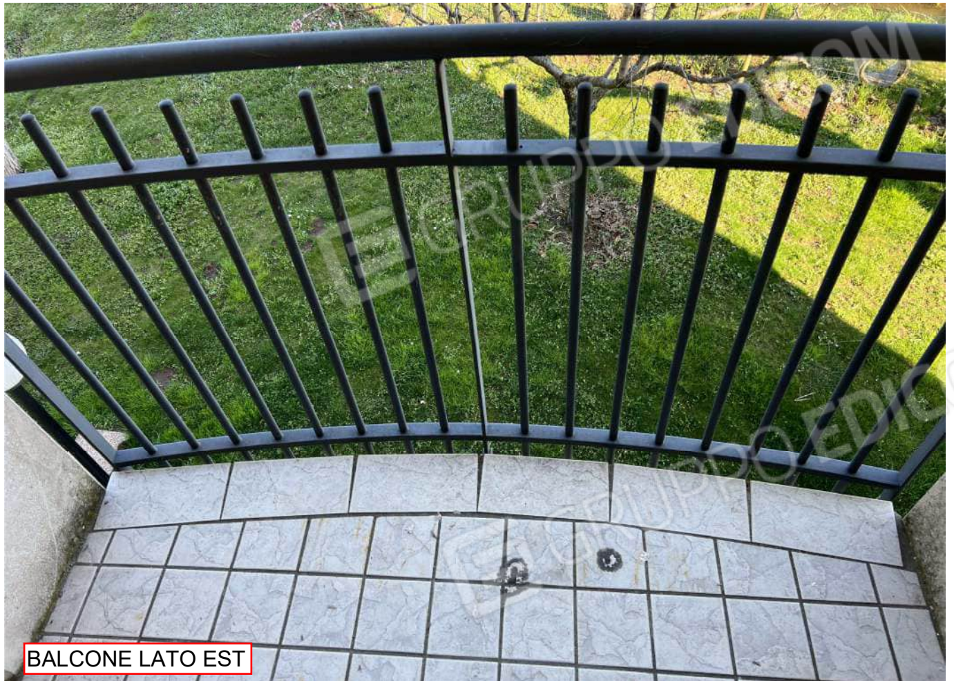
BALCONE LATO EST