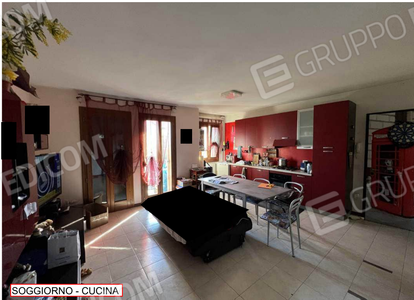
SOGGIORNO - CUCINA