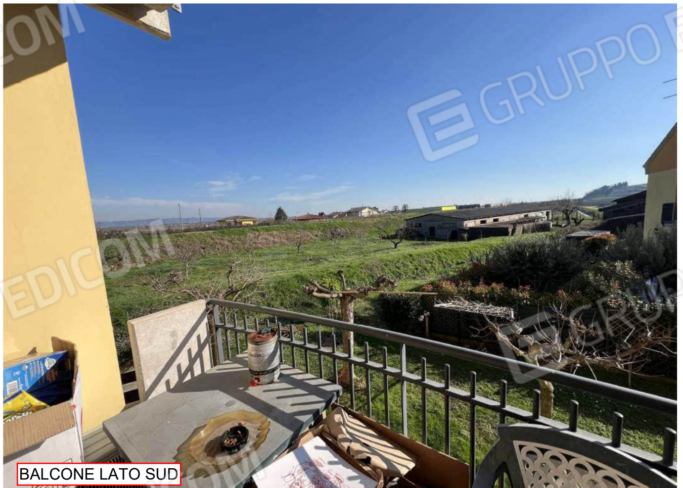
BALCONE LATO SUD