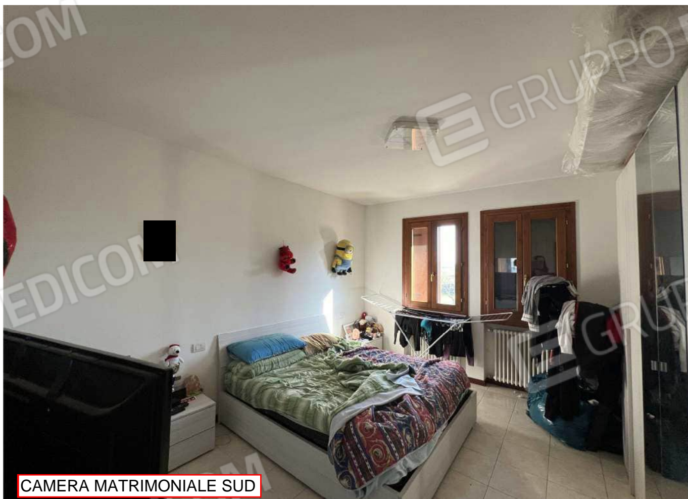
CAMERA MATRIMONIALE SUD