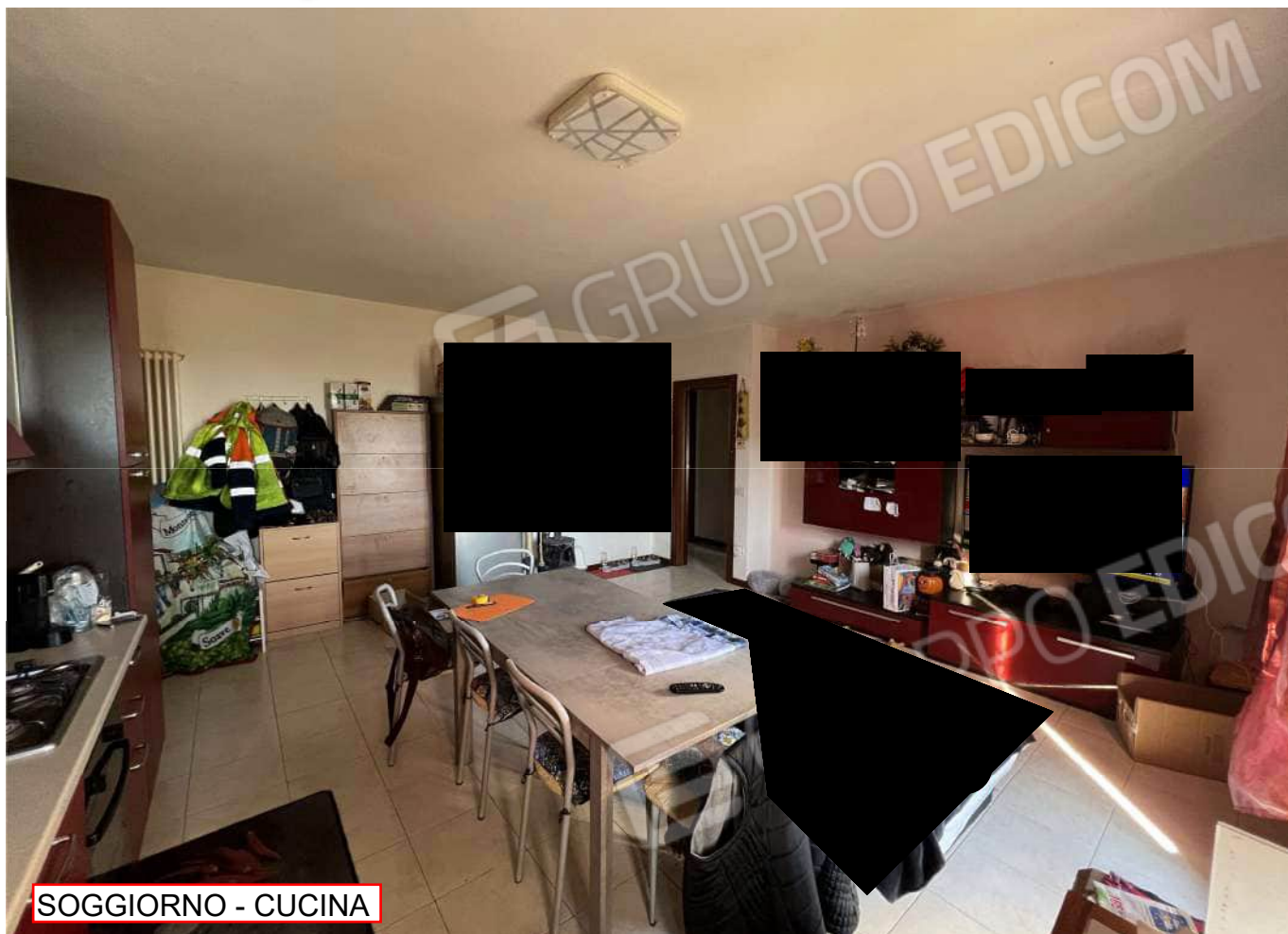
SOGGIORNO - CUCINA