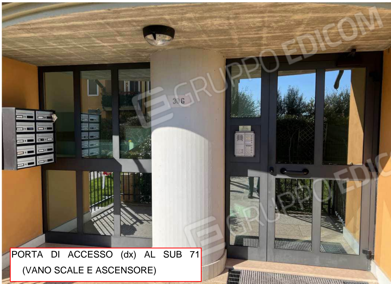
PORTA DI ACCESSO (dx) AL SUB 71 (VANO SCALE E ASCENSORE)