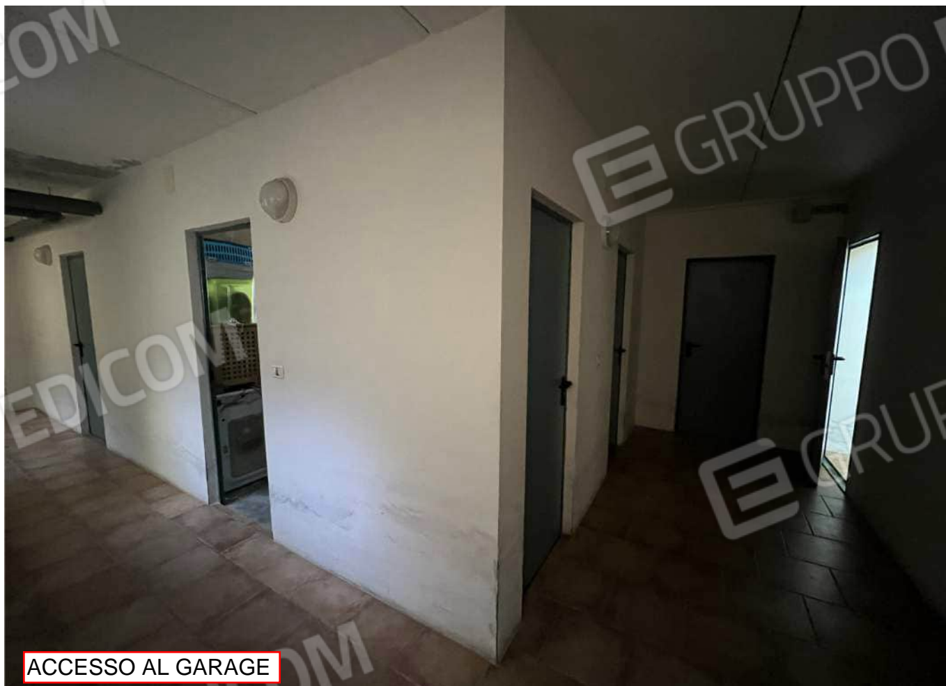
ACCESSO AL GARAGE