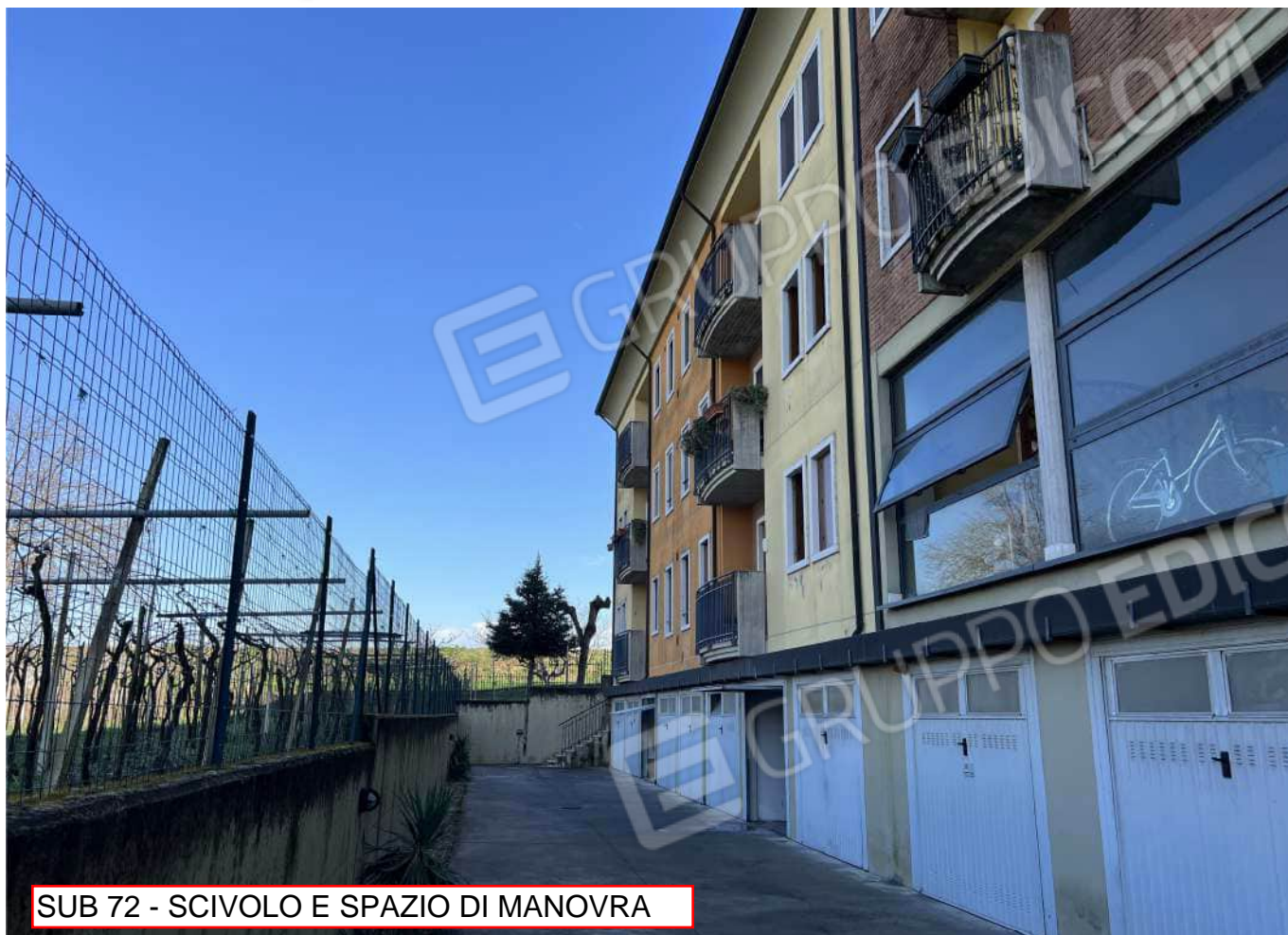
SUB 72 - SCIVOLO E SPAZIO DI MANOVRA