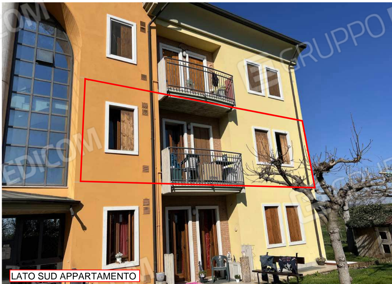
LATO SUD APPARTAMENTO