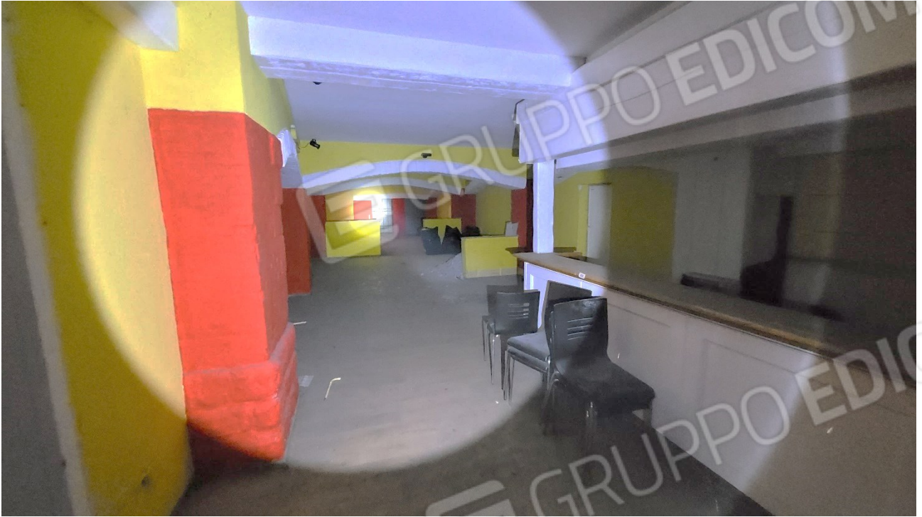
Locale al piano quota cortile