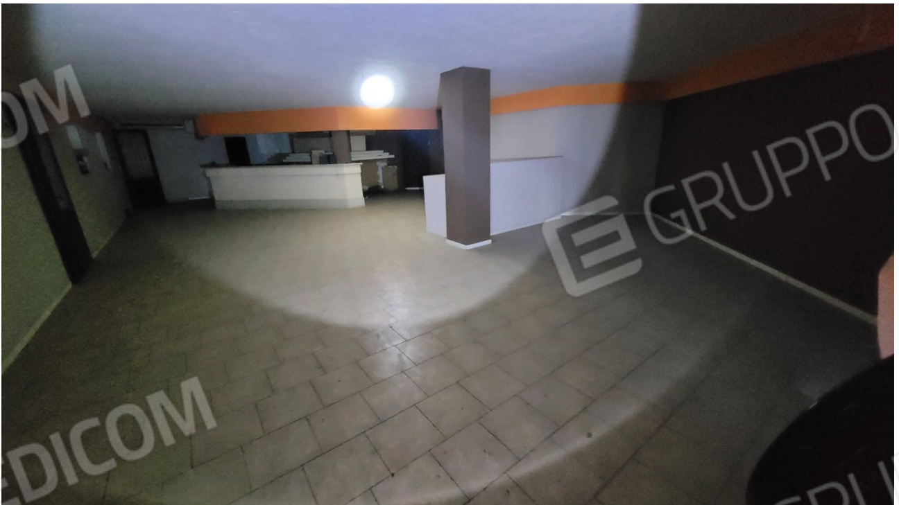
Locale al piano quota cortile