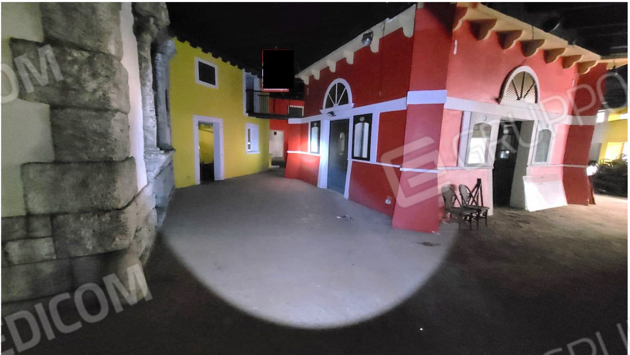
Spazi comuni al piano quota cortile