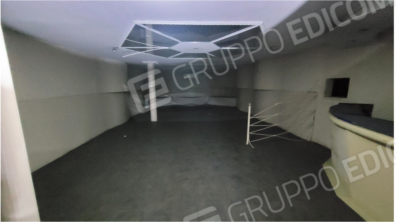
Locale al piano quota cortile