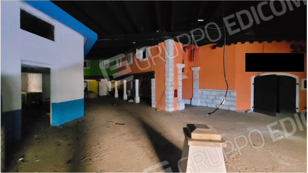
Spazi comuni al piano quota cortile