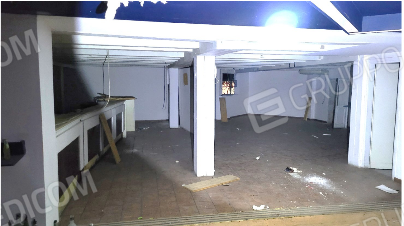
Locale al piano ammezzato