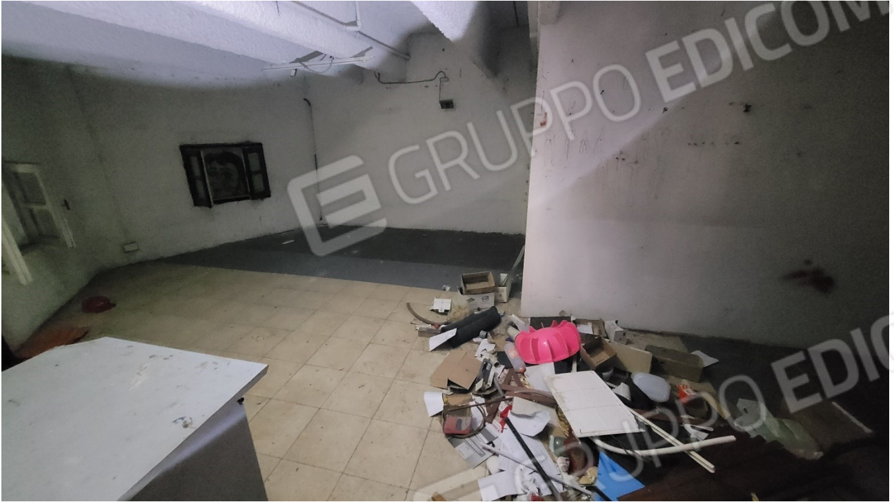
Locale al piano ammezzato