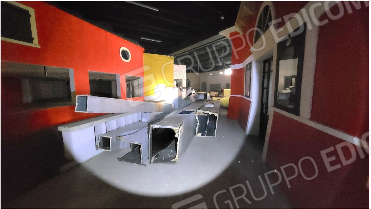
Spazi comuni al piano quota cortile