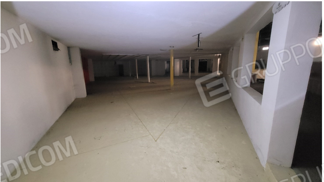
Locale al piano quota cortile