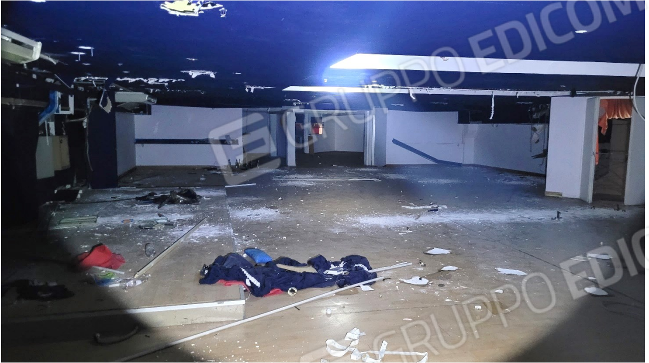
Locale al piano ammezzato