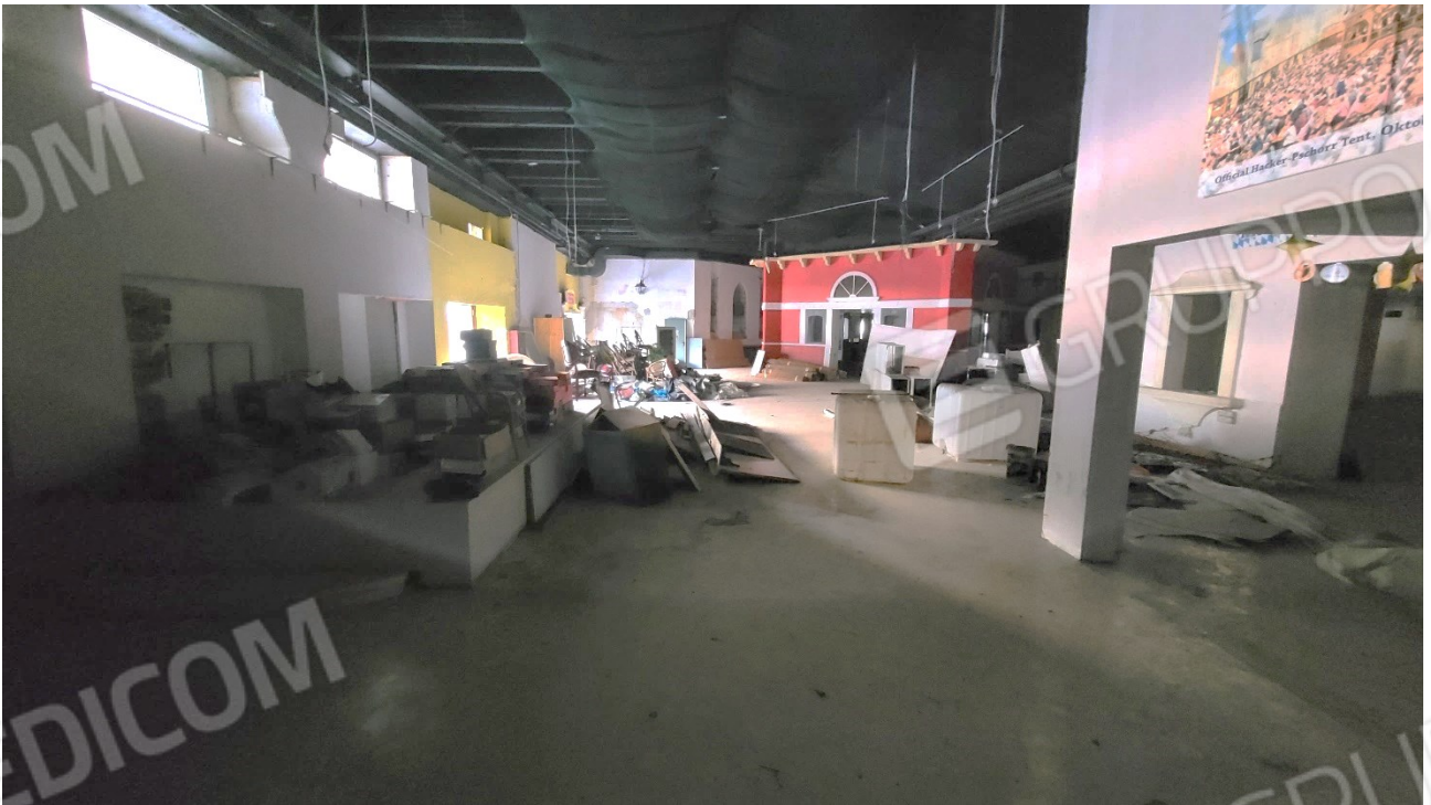
Spazi comuni al piano quota cortile