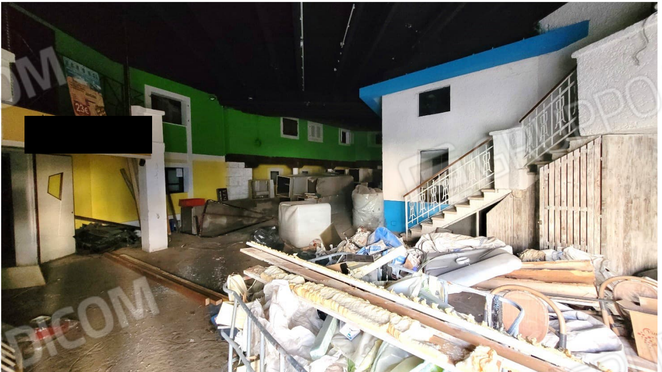
Spazi comuni al piano quota cortile