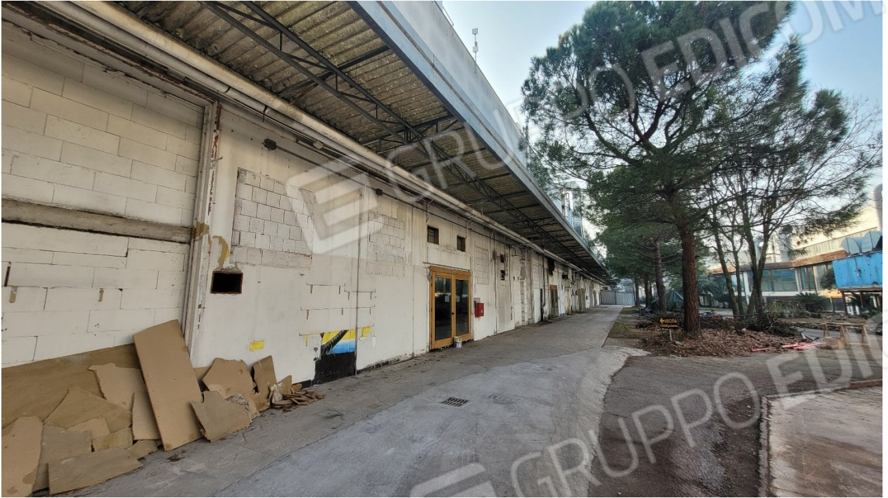
Vista del piano interrato dal cortile interno