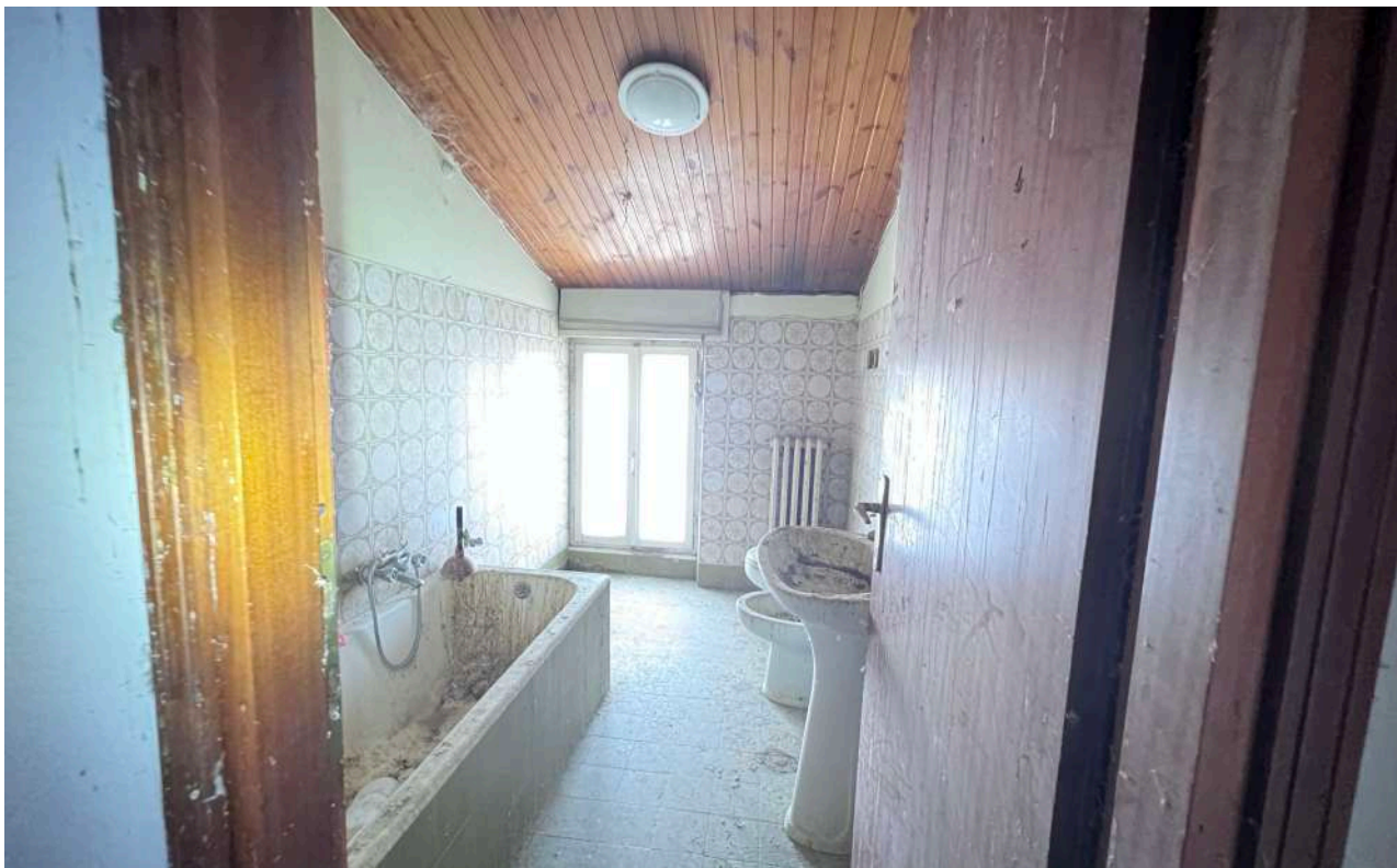
FOTO 11 - Bagno