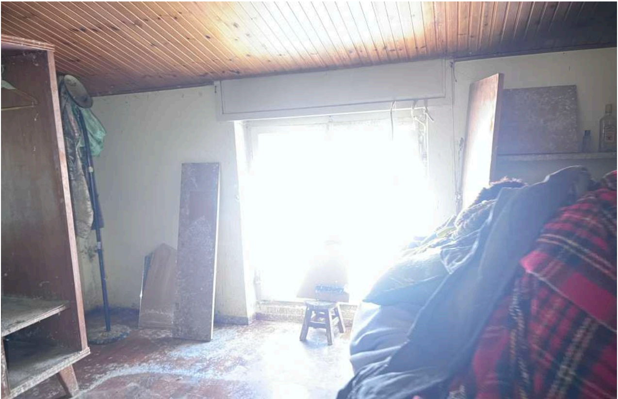
FOTO 7 - Camera