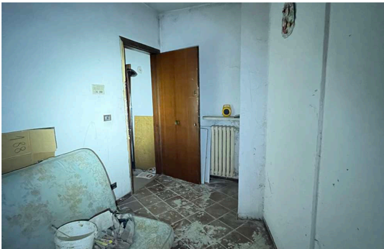
FOTO 12 - Ingresso