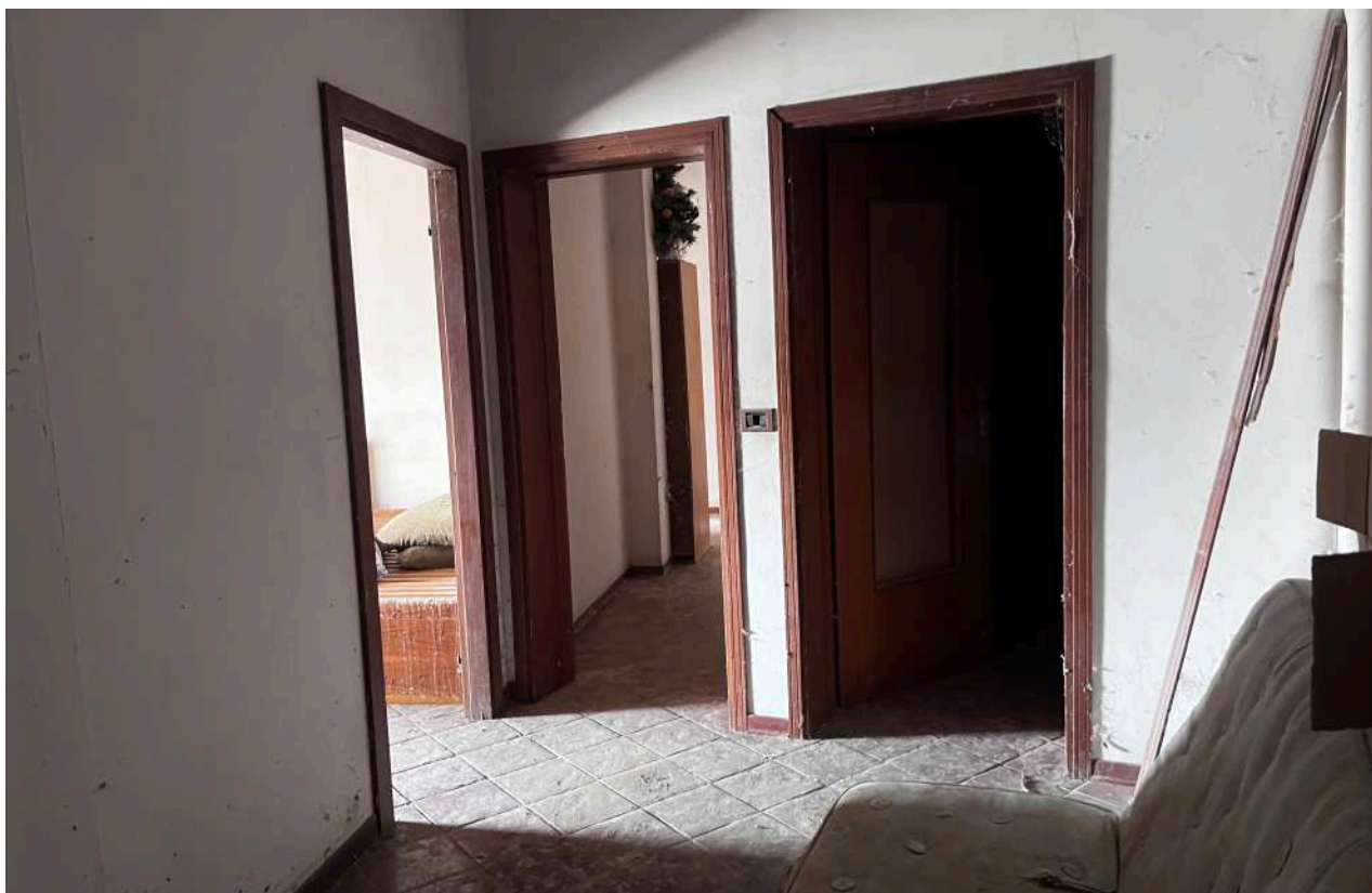
FOTO 5 - Ingresso