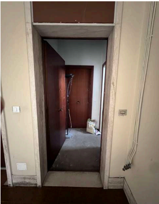
FOTO 3 - Ingresso