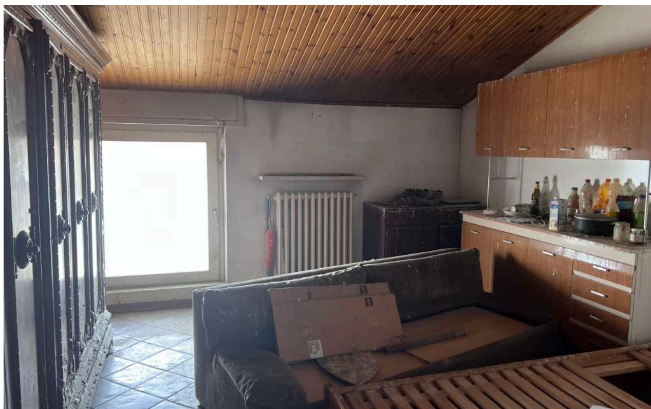
FOTO 6 - Soggiorno