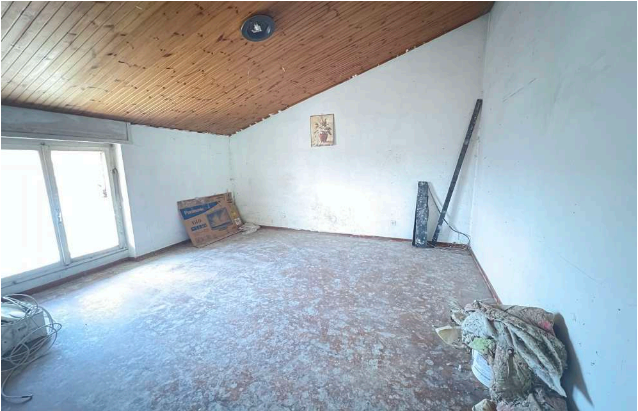
FOTO 10 - Camera