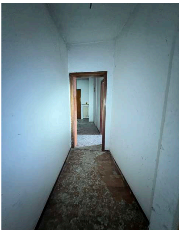
FOTO 13 - Ripostiglio