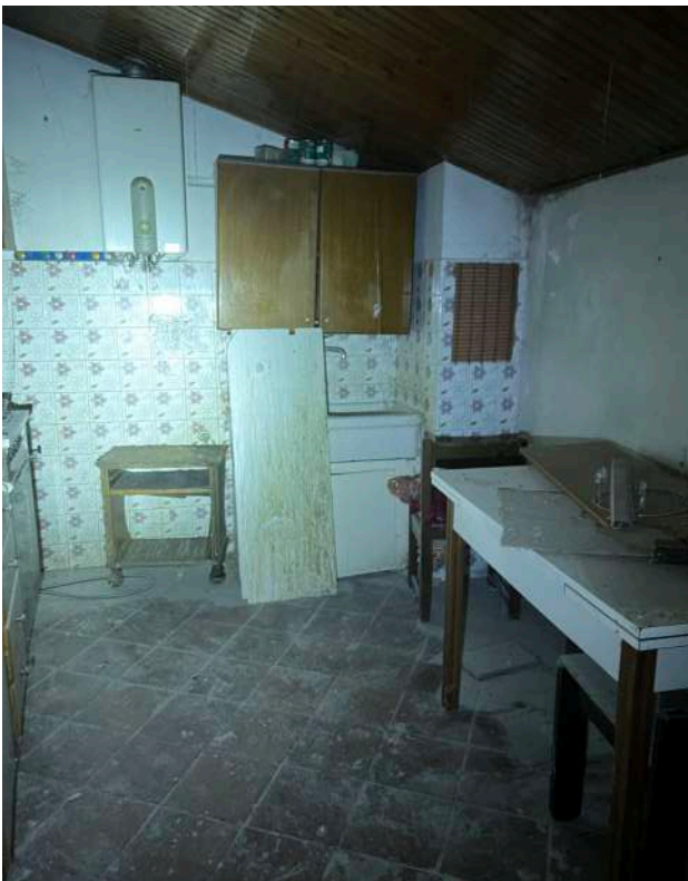
FOTO 8 - Cucina