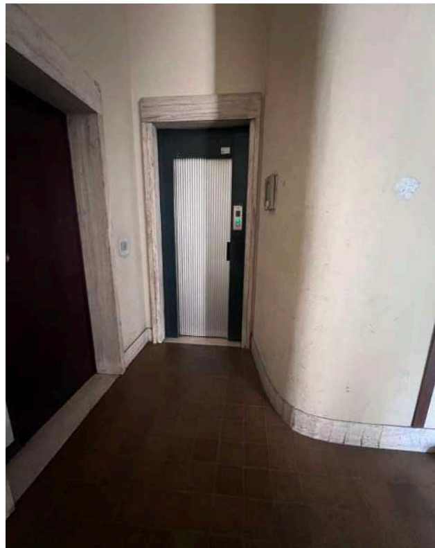
FOTO 4 - Ascensore condominio