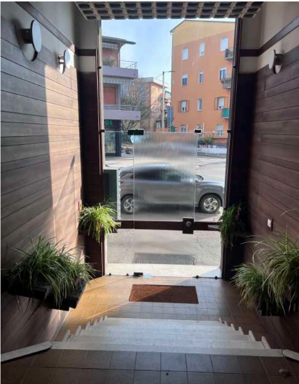
FOTO 1 - Portone d'accesso condominiale - via Albere