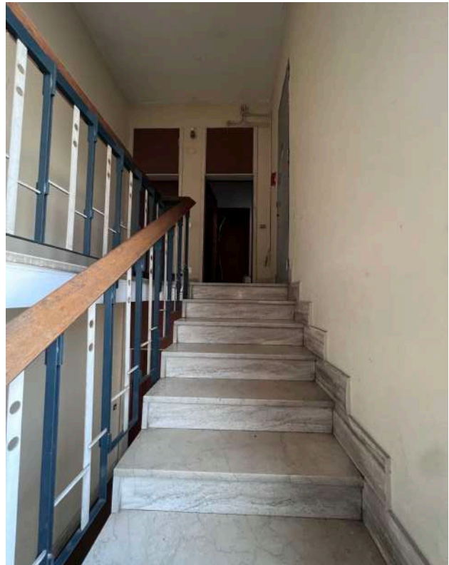
FOTO 2 - Scala condominio