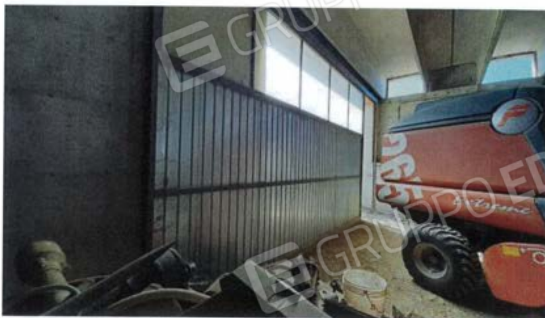
Stalla Bovini Fg 36, Part 539, Sub 2