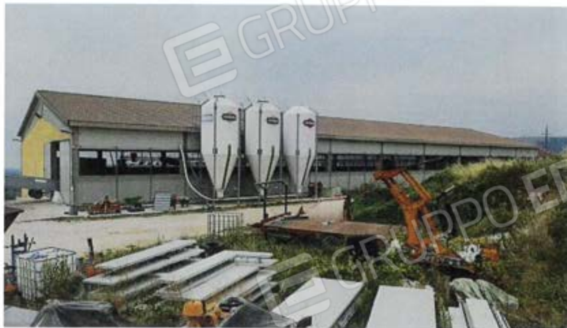
Capannone Avicolo Fg 36, Part 539, Sub 2