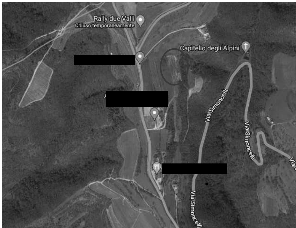
a-b mm.nn. 65-66

Confini: Nord m.n. 441 (altra proprietà); Est: m.n. 67 altra proprietà; Sud: m.n. 66 (stessa proprietà b); Ovest: strada di accesso e m.n. 63 (altra proprietà)