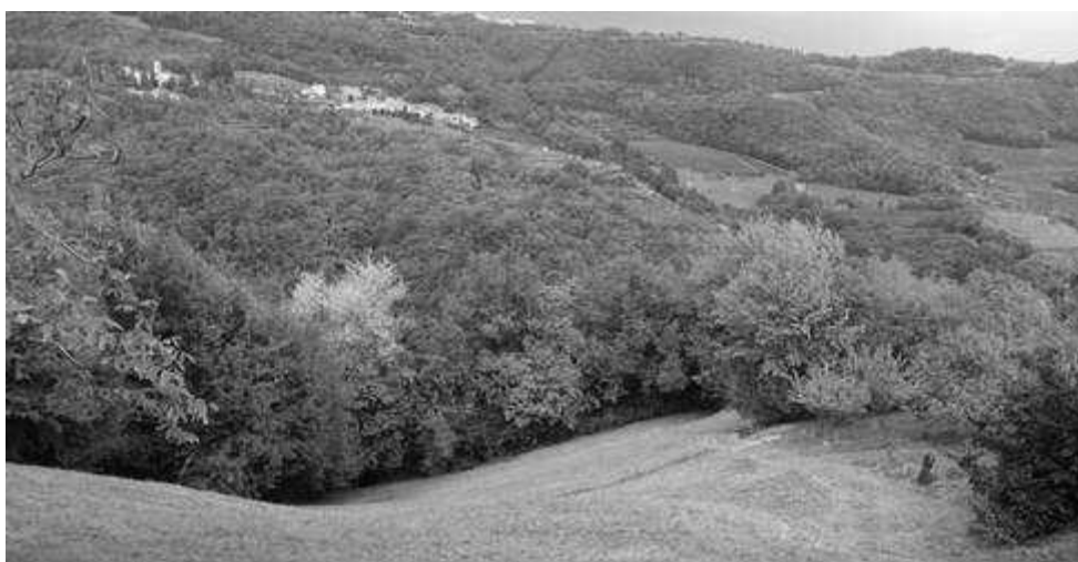
mm.nn. 470 – 471 – 472

Accesso: da Via Precastio attraverso terreni di altra proprietà