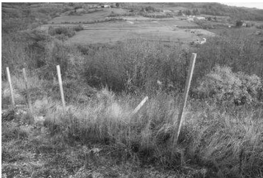
Il bosco in cui è inserito il m.n. 155

Accesso pedonale: Da Via Verdella attraverso beni di altra proprietà.