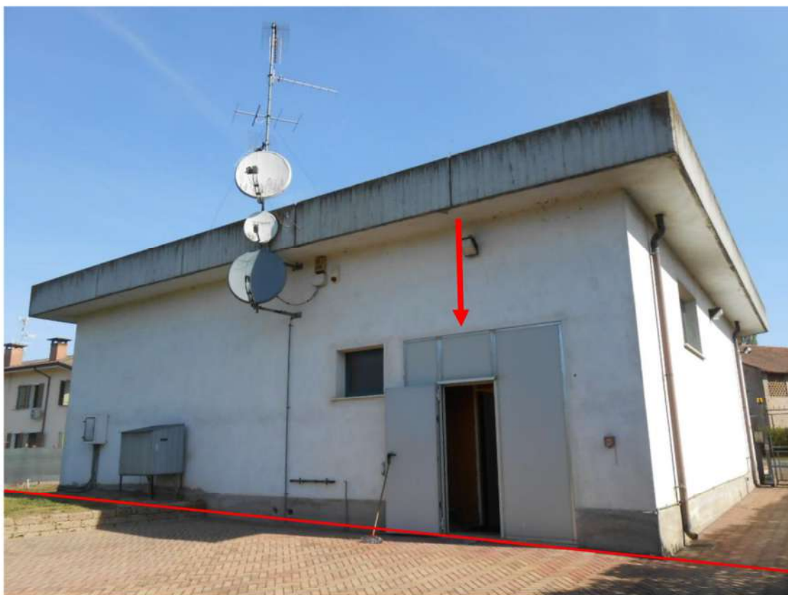
Nella foto sono segnate indicativamente la linea di confine del mappale e la porta del magazzino.

Inoltre il prospetto sul retro, sud/ovest, ha la porta di ingresso al magazzino che dà direttamente nel giardino [REDACTED] [REDACTED], la linea di confine corrisponde esattamente al muro dell'edificio pignorato quindi tale porta in caso di vendita andrebbe murata, perché altrimenti si accederebbe nella proprietà di terzi. Anche la fossa biologica e fossa imhof, poste dietro al capannone, sono nella proprietà [REDACTED] mapp. 193.