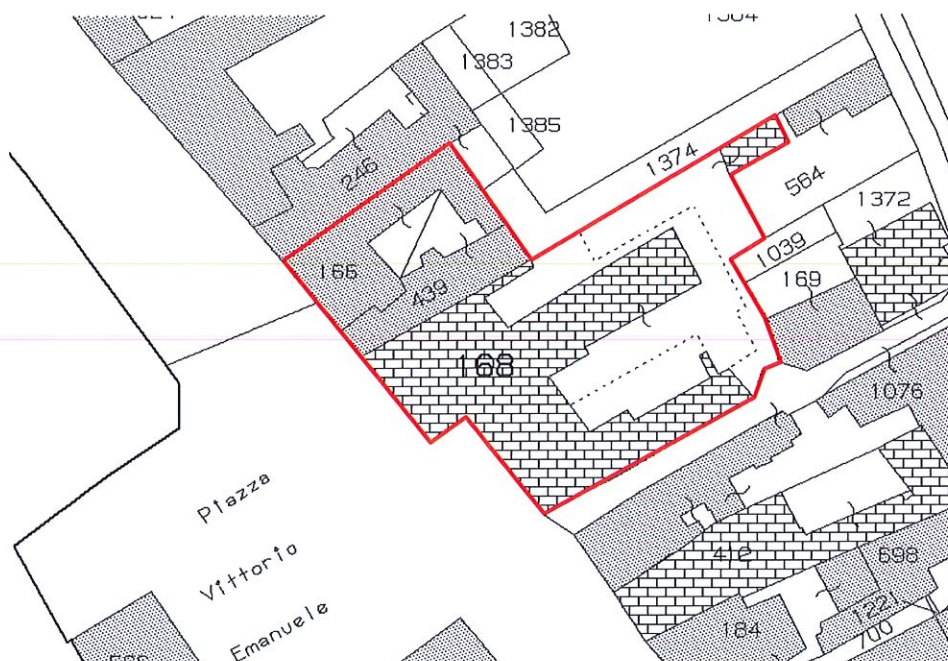
Figura 5: estratto mappa catastale

Per completezza si riporta nel seguito stralcio di mappa catastale: