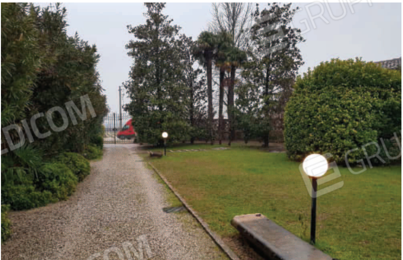
Vista dell'ingresso carrabile