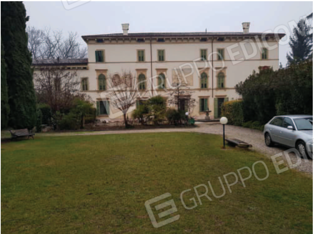
Vista complessiva del prospetto principale