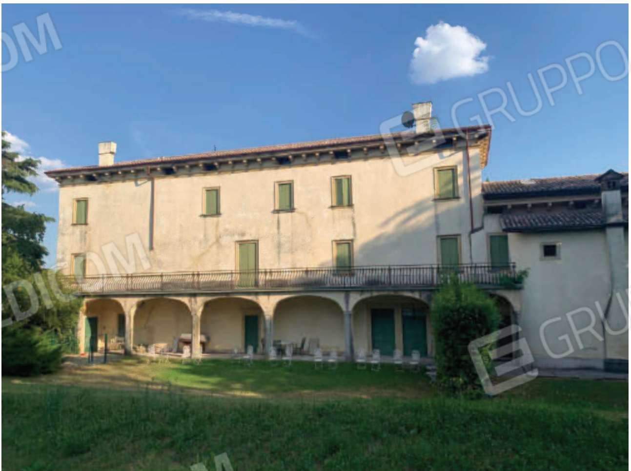
Vista del retro del fabbricato