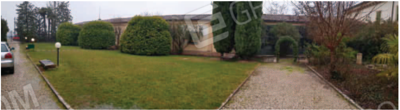
Vista dell'ala ovest