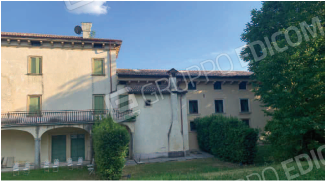
Vista del retro del fabbricato