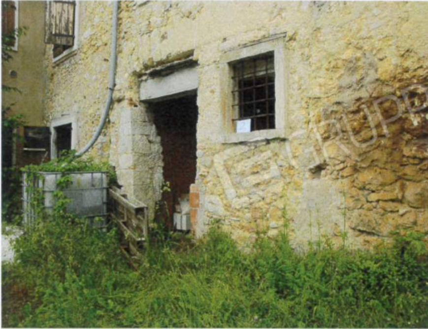
Esecuzione immobiliare n. 281/2023 RGE Tribunale di Verona