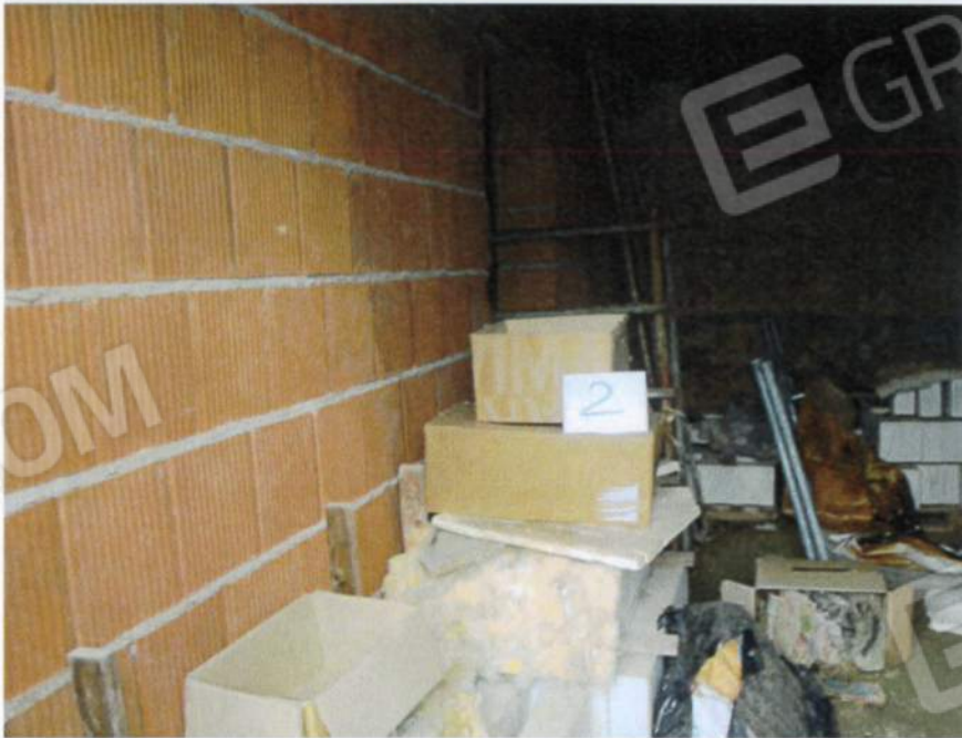
Interni unità mapp. 979 sub. 2 a piano terra