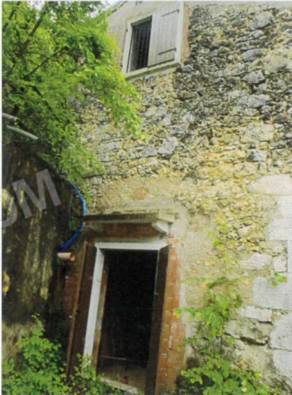
Esterni verso la corte esclusiva u.i. mapp. 979 sub. 4 a piano terra