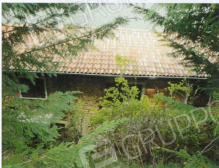
Viste del complesso edilizio: sopra riprese dalla corte comune; in centro riprese dalla strada lato Est e, sotto, vecchia tettoia presente sulla corte comune