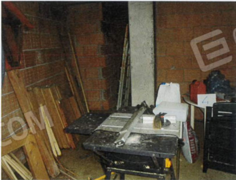
Interni u.i. mapp. 979 sub. 4 a piano terra