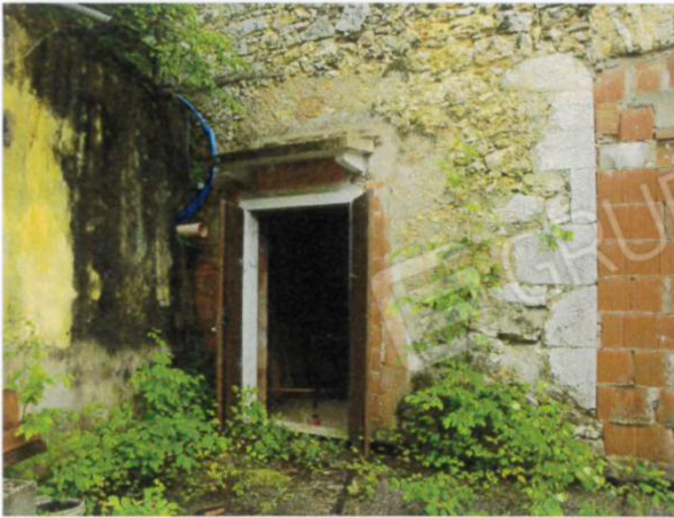
Esecuzione immobiliare n. 281/2023 RGE Tribunale di Verona