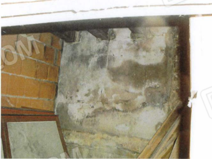
Interni u.i. mapp. 979 sub. 2 a piano terra