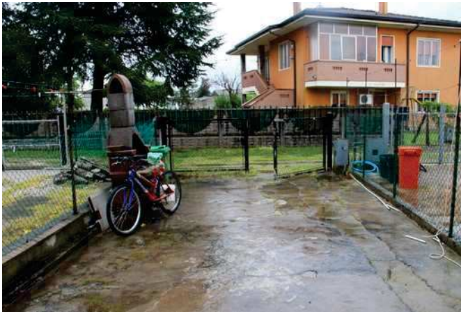
Cortile sul fronte principale