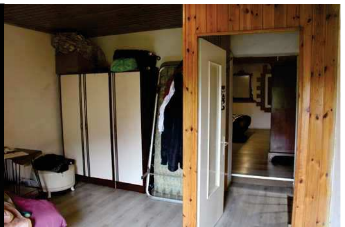
Camera da letto matrimoniale

In complesso l'appartamento versa in cattive condizioni e necessita di un intervento di riqualificazione complessivo per rispondere alle odierne esigenze abitative sia per quanto riguarda le strutture che le finiture e gli impianti.