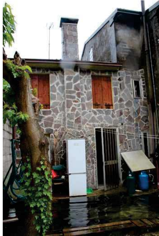
Prospetto sul retro

chiocciola si accede al piano superiore composto da un disimpegno, due camere da letto matrimoniali e un ripostiglio.