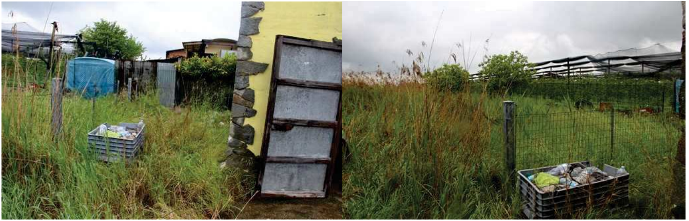
Il terreno di pertinenza