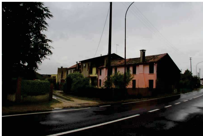
La schiera edilizia vista da Via Sabbioni

L'edificio è realizzato con muratura portante in laterizio intonacato, solai e copertura in legno, manto in coppi in laterizio. In generale l'immobile versa in scarse condizioni manutentive.