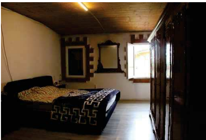
Camera da letto matrimoniale