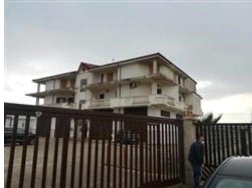
Terreno con sovrastante fabbricato abusivo