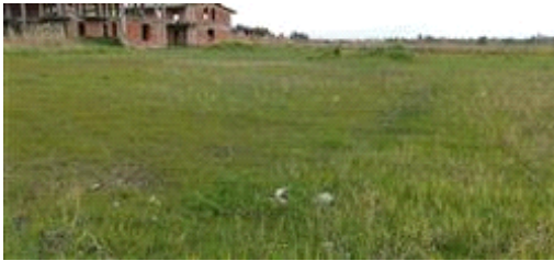
Terreno part. 768

Presenta una forma Rettangolare, un'orografia Pianeggiante.