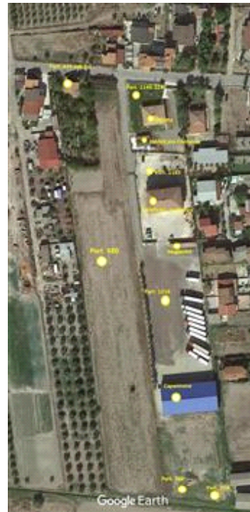
vista dall'alto con indicate le particelle in oggetto