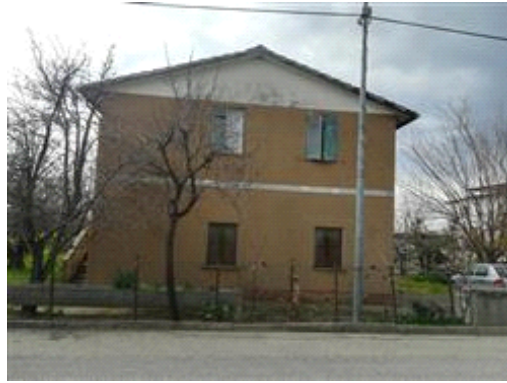
Appartamento al 1° piano, vista da via De Mille