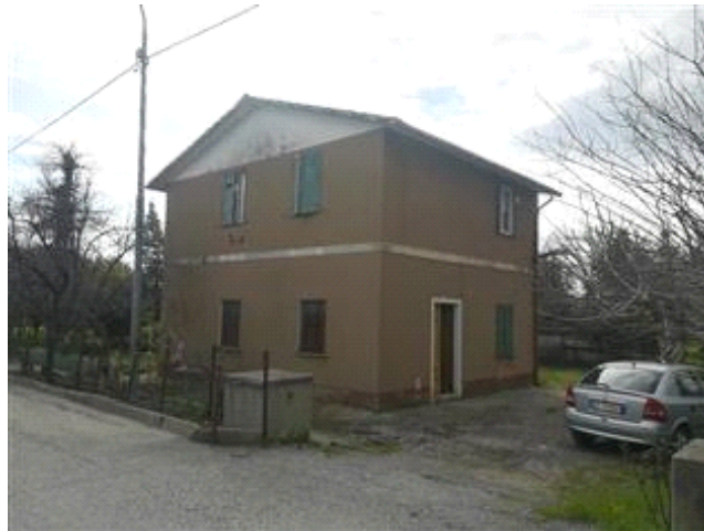
Prospetto nord-ovest vista dalla strada comunale, Via Dei Mille