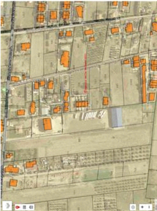
Ortofoto lotti in oggetto