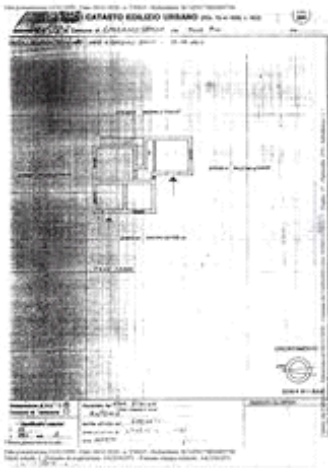
Planimetria catastale piano terra