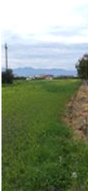
Terreno Lotto 3 vista da Sud verso Nord

Presenta una forma rettangolare, un'orografia pianeggiante, i seguenti sistemi irrigui: inesistente, sono state rilevate le seguenti colture arboree: seminativo ,Il terreno