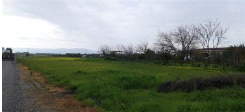
Terreno Lotto 3 vista da Nord verso Sud