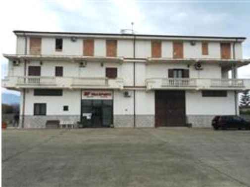
Terreno con sovrastante fabbricato abusivo

Presenta una forma rettangolare, un'orografia pianeggianteIl terreno