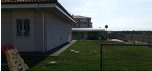
Terreno con sovrastante fabbricati abusivi

Presenta una forma rettangolare, un'orografia pianeggiante, sono state rilevate le seguenti colture arboree: inesistenti ,Il terreno