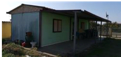
Fabbricato tipo container abusivo su Lotto 4