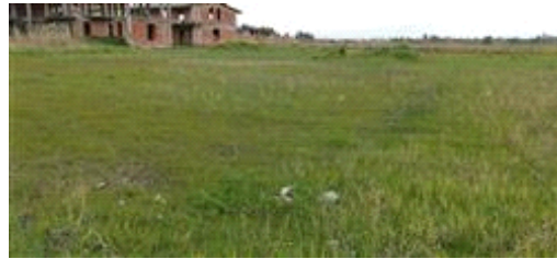
Terreno part. 769