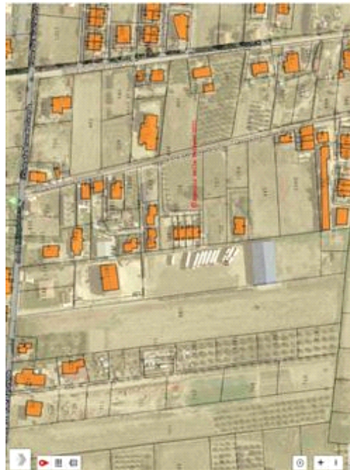
Mappa otofoto con zone in oggetto