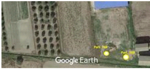
Vista dall'alto con indicate le particelle in oggetto