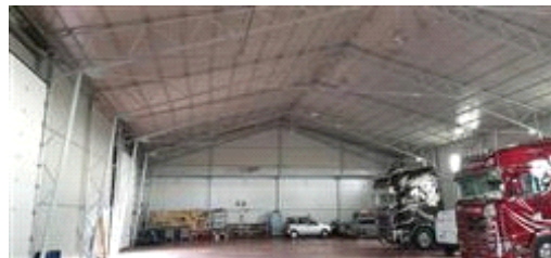
Capannone abusivo realizzato su part.1214, interno