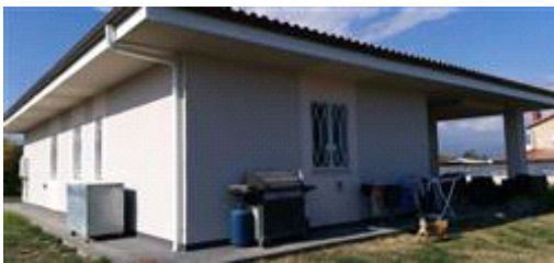
Villetta abusiva su Lotto 4

L'intero edificio sviluppa 1 piani, 1 piani fuori terra, . Immobile costruito nel 2012.