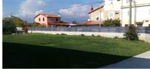
Terreno part. 1146-1147