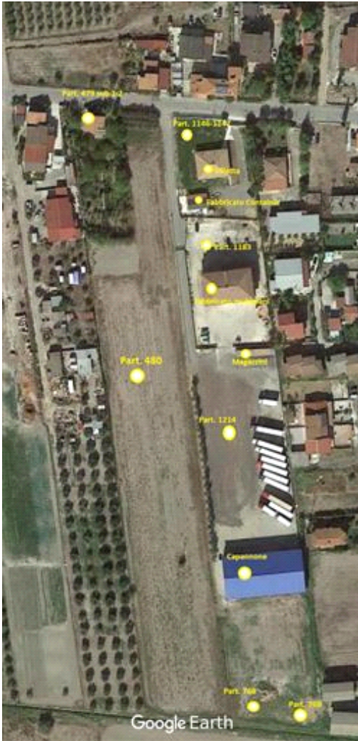
Vista dall'alto con indicate le particelle in oggetto