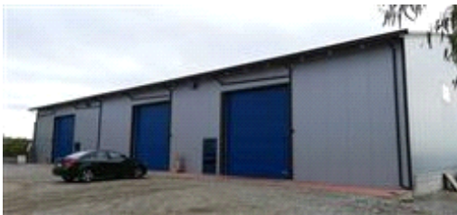
Capannone abusivo realizzato su part.1214

L'intero edificio sviluppa 1 piani, 1 piani fuori terra, . Immobile costruito nel 2017.