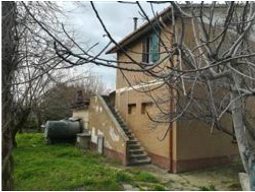
Appartamento al 1° piano, vista scala esterna e corte comune

L'intero edificio sviluppa 2 piani, 2 piani fuori terra, .