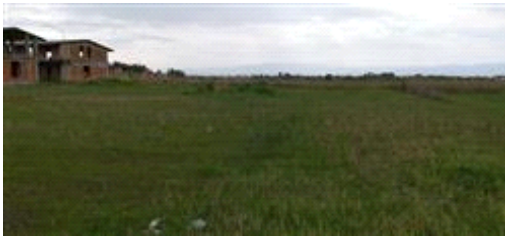
Terreno part. 769