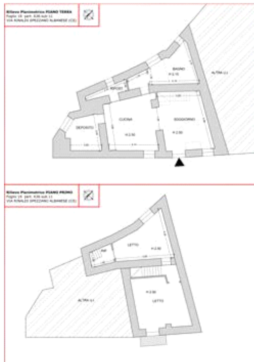
RILIEVO STATO ATTUALE