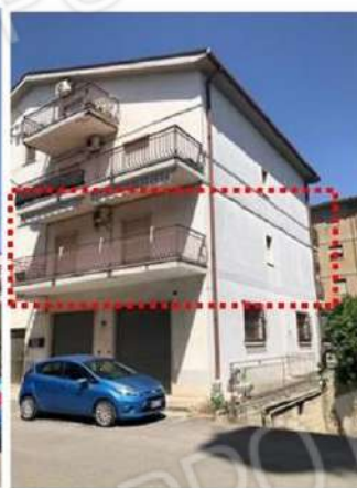
Prospetto su spazio condominiale angolo Via V. Vattimo