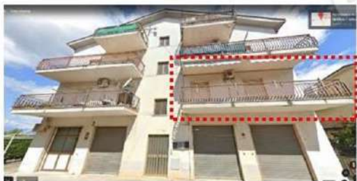
Prospetto su Via V. Vattimo

Appartamento (P.1°) sito in Via Vittorio Vattimo n. 30