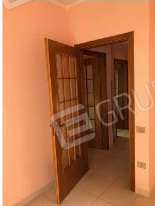
Vista interna dei vani: disimpegno