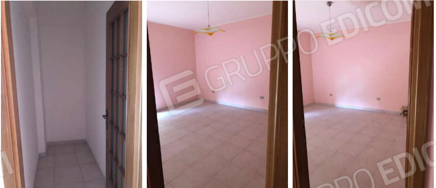
Vista interna dei vani: ripostiglio; camera 1