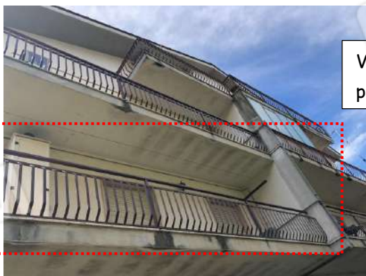
Vista esterna del fabbricato, prospetto posteriore