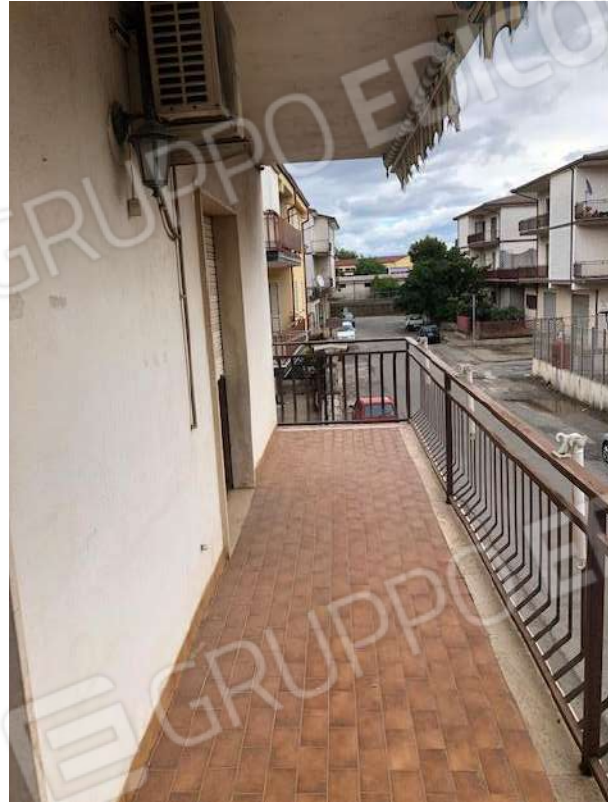
Vista esterna: balcone posteriore e anteriore (su Via V. Vattimo)