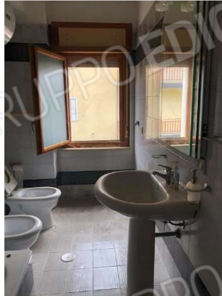
Vista interna dei vani: bagno