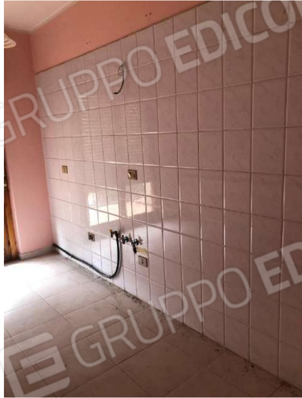
Vista interna dei vani: cucina