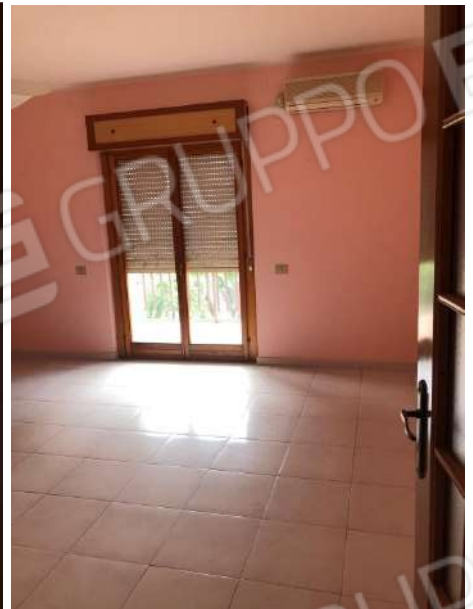
Vista interna dei vani: soggiorno