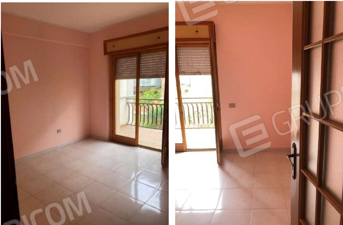
Vista interna dei vani: camera 2