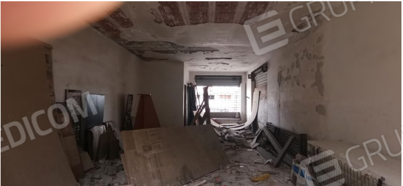
INTERNO DEL LOCALE NEGOZIO