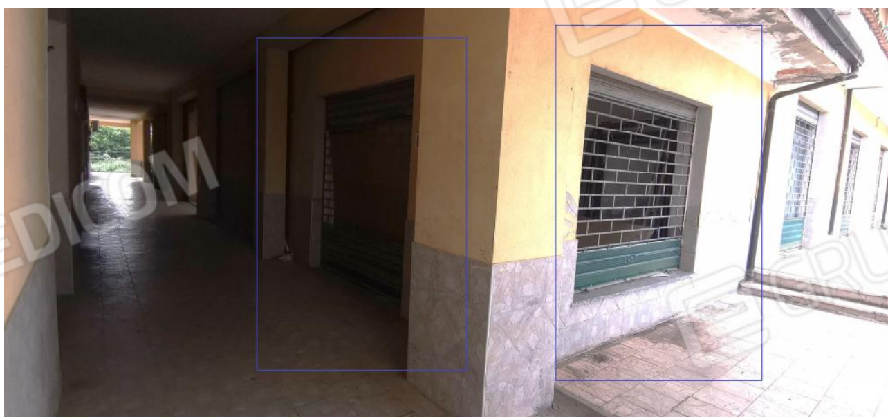
INGRESSO AL LOCALE E VETRINA D'ESPOSIZIONE