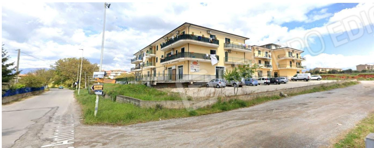
COMPLESSO PRODUTTIVO POLIVALENTE PER ATTIVITA' COMMERCIALE, SERVIZI, UFFICI, RESIDENZA