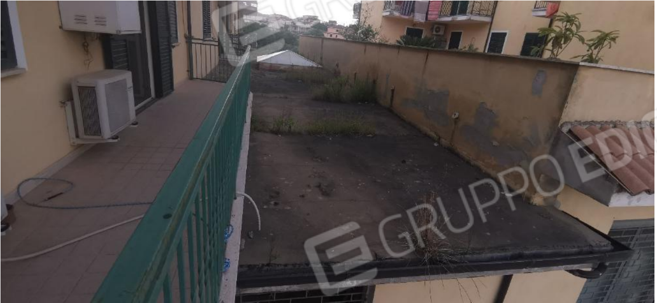
COPERTURA A "TERRAZZO" DEL LOCALE NEGOZIO