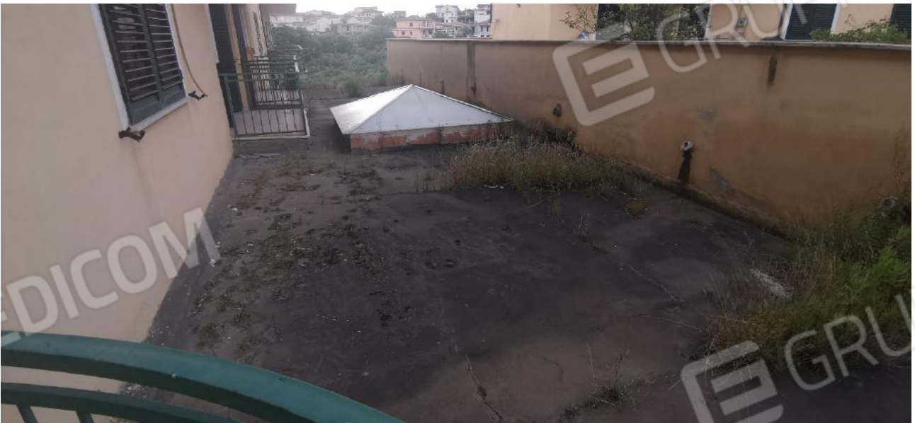
COPERTURA A "TERRAZZO" DEL LOCALE NEGOZIO