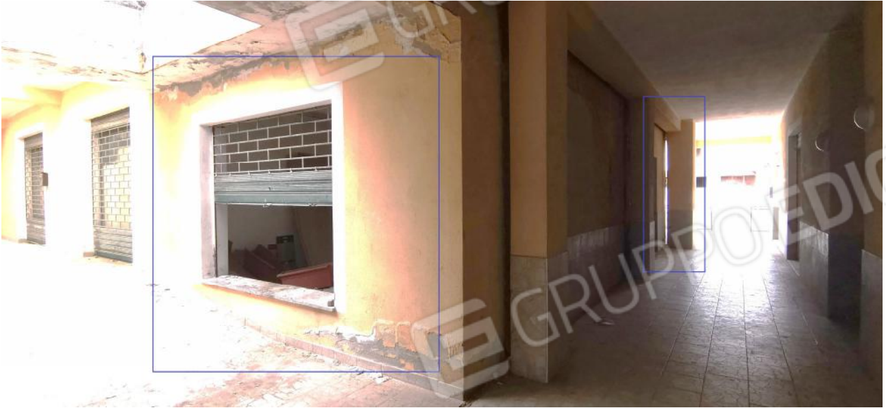
VISTA LOCALE DALLE GALLERIE D'INGRESSO DEL COMPLESSO POLIVALENTE