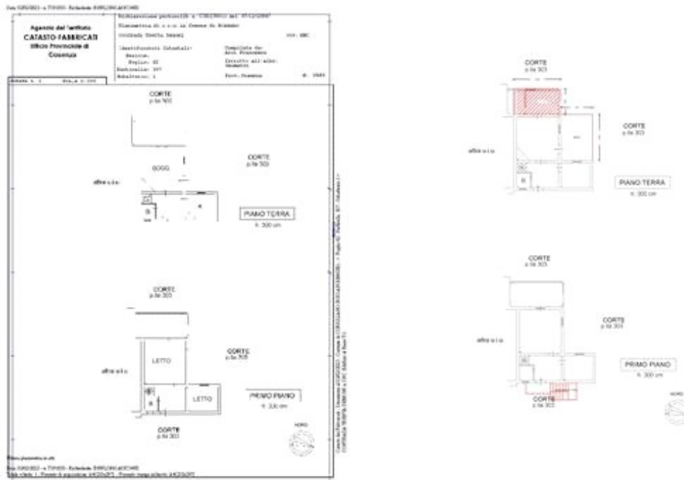
Planimetria catastale coincidente con quanto regolarizzato

Questa situazione è riferita solamente a lla parte comportante la maggiore volumetria realizzata. Sull'immobile incluso nel corpo A (fg. 62; p.la 307 sub 1)