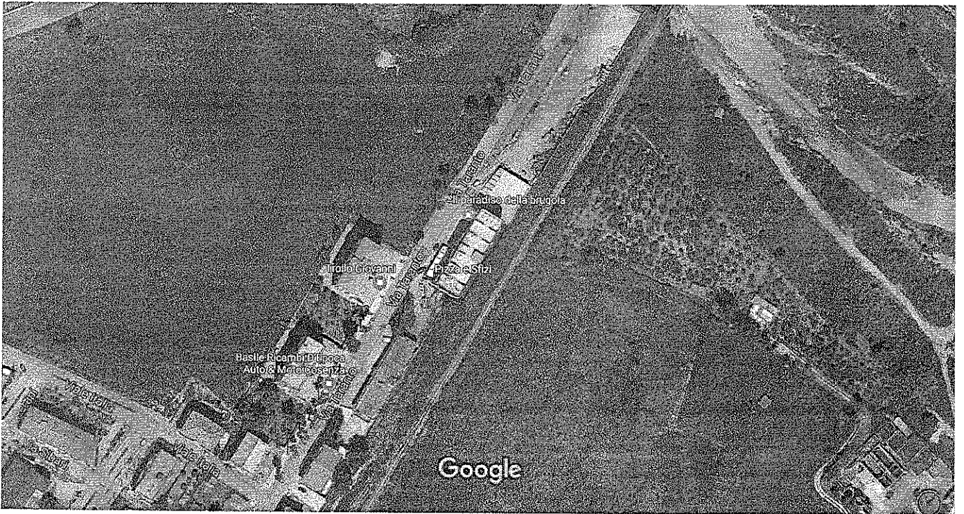
Immagini ©2017 Google, Dati cartografici ©2017 Google 20 m

Firmato Da: CONVERTI FRANCESCO Emesso Da: ARUBAPEC S.P.A. NG CA 3 Serial#: 50c1d893ed43eb80bdf35c5807b966e4f