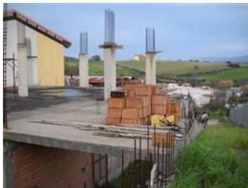
Porzione di mensola da demolire

8.2. CONFORMITÀ CATASTALE: NESSUNA DIFFORMITÀ