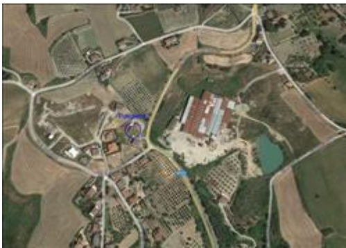
Posizione del fabbricato

I beni sono ubicati in zona di espansione in un'area mista residenziale/commerciale, le zone limitrofe si trovano in un'area mista residenziale/commerciale. Sono inoltre presenti i servizi di urbanizzazione primaria.