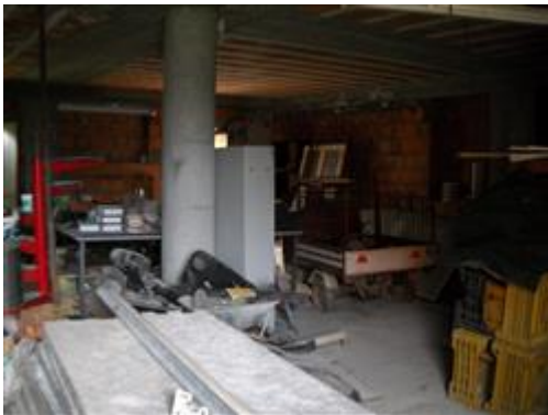
Interno del fabbricato