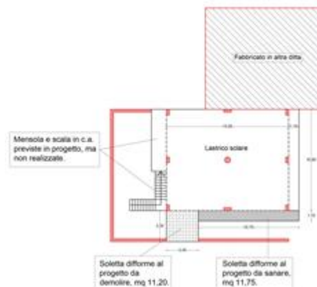
Planimetria piano primo (lastrico solare)