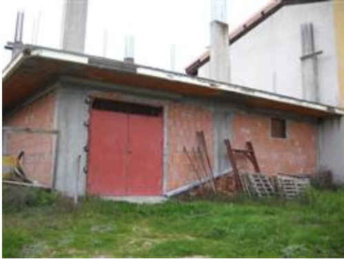
Prospetto lato strada