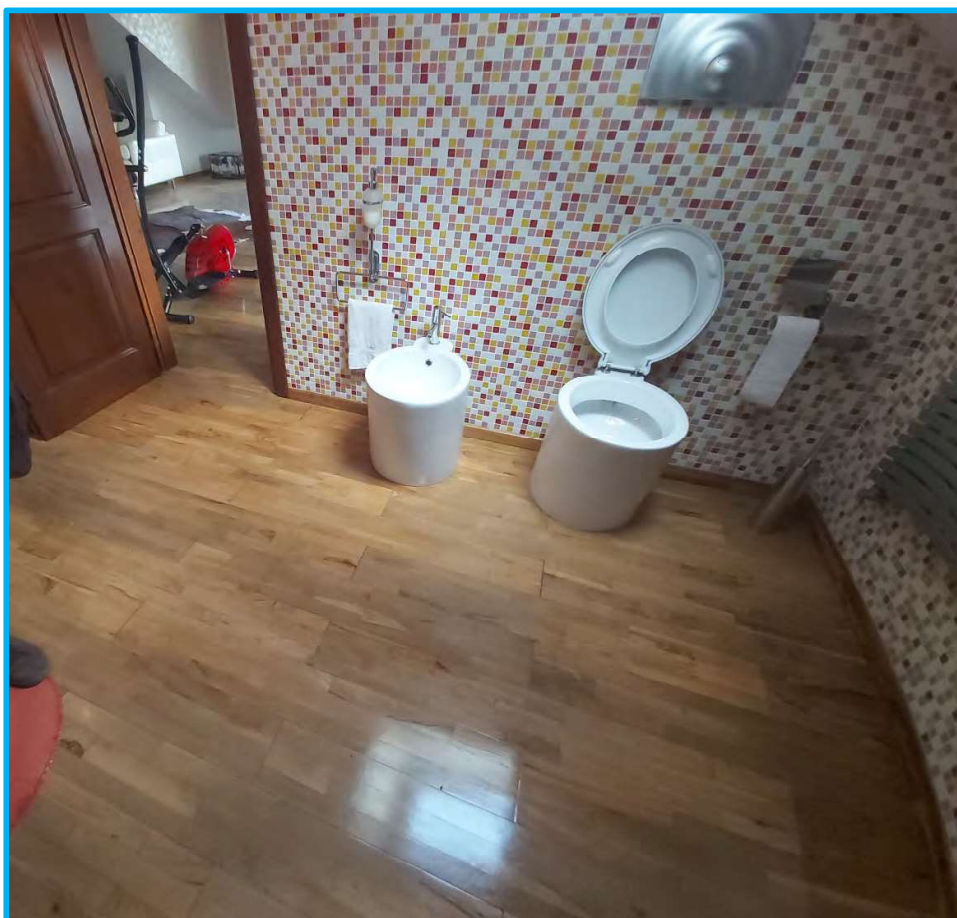
Servizio igienico in mansarda/sottotetto.