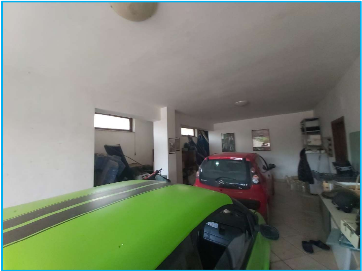
Autorimessa al piano interrato a cui si accede dall'esterno.