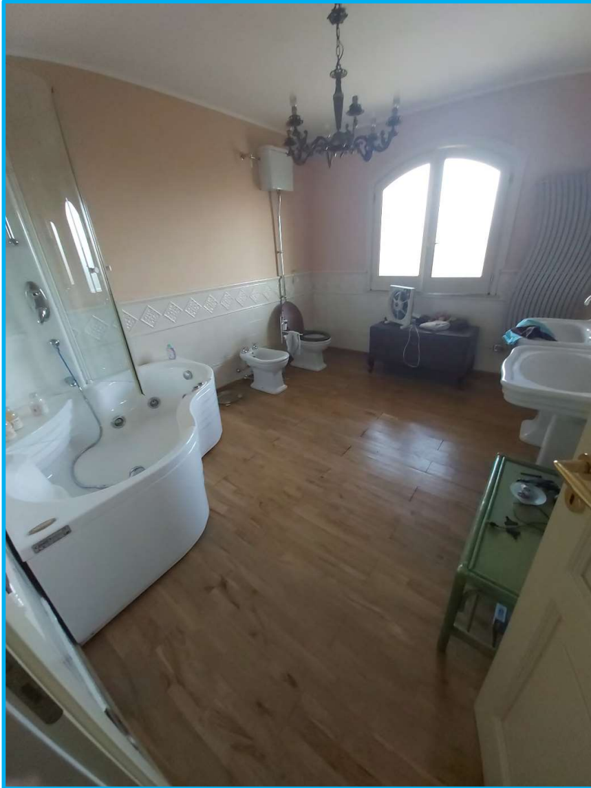
Un servizio igienico al piano primo – ZONA NOTTE