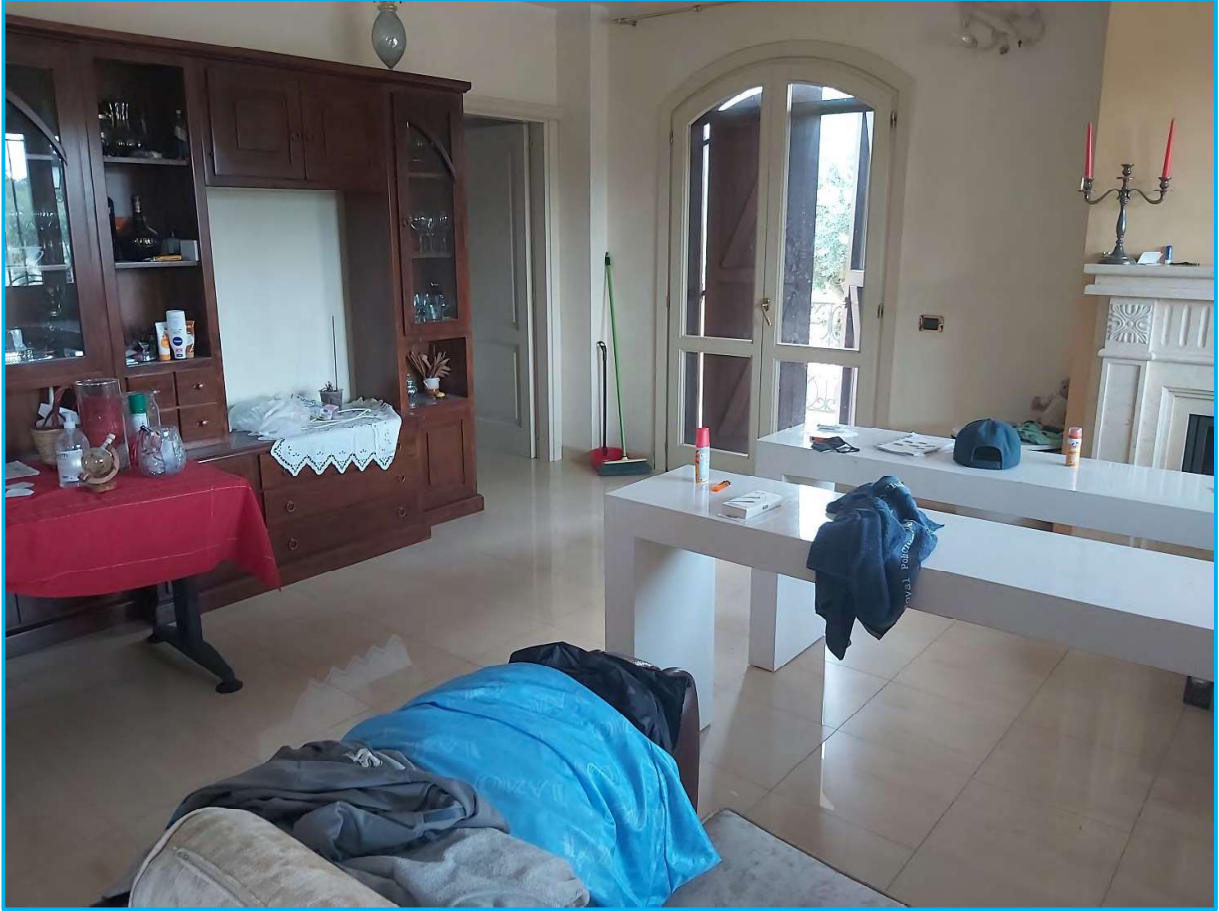
Piano terra – zona living