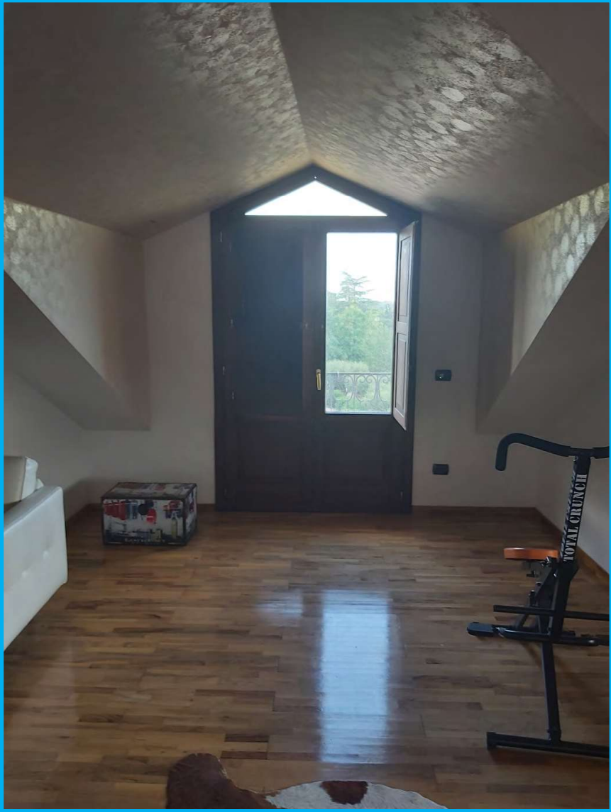
Piano secondo /sottotetto – vista interna, verso uno degli abbaini.