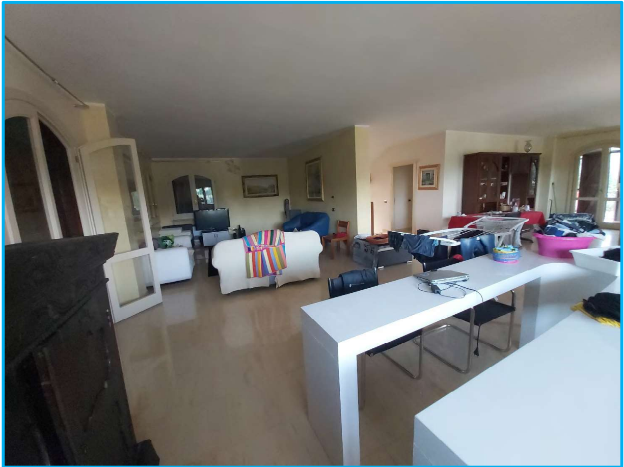
Vista interna, piano terra.