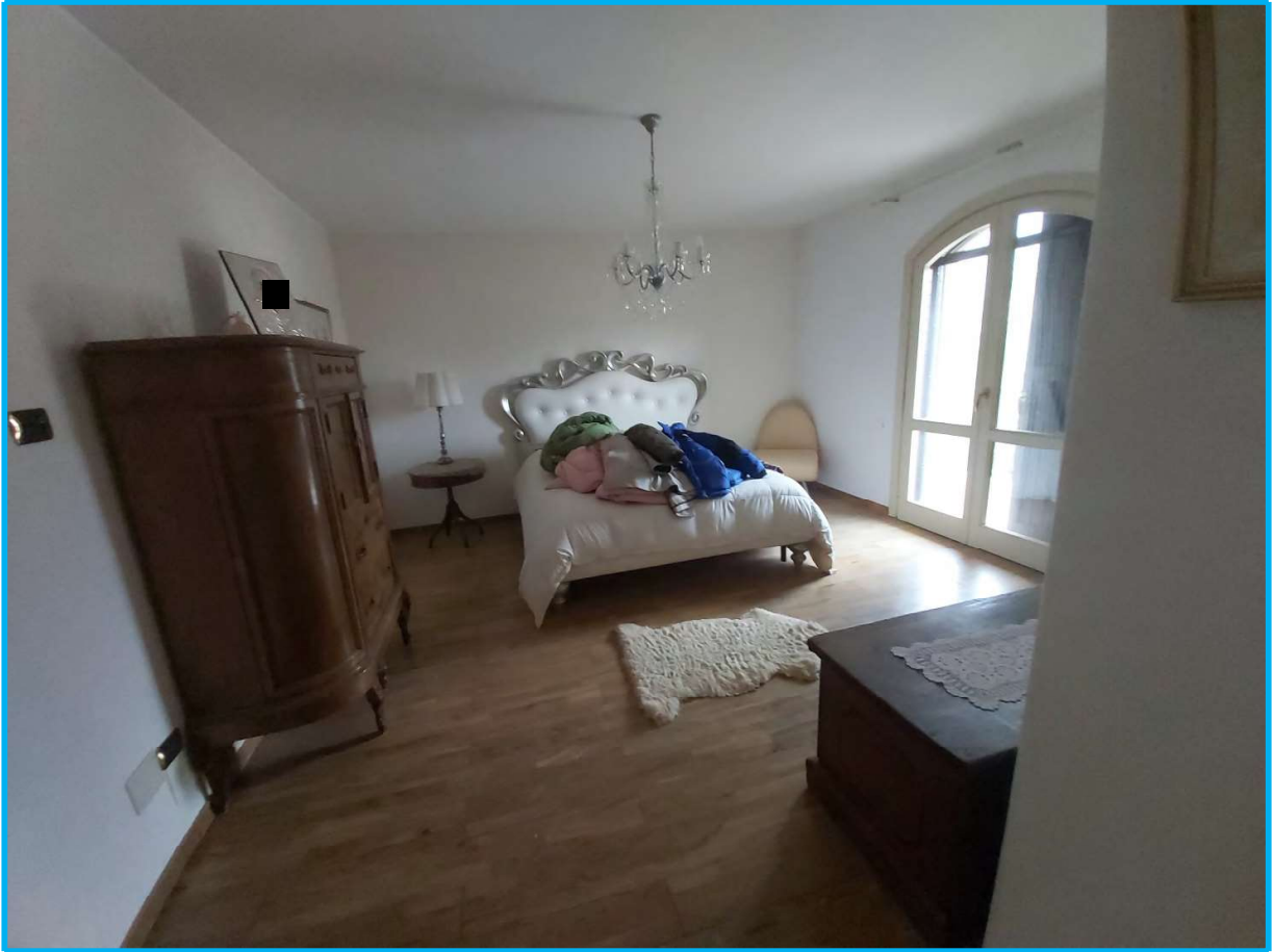
Una stanza da letto al piano primo – ZONA NOTTE