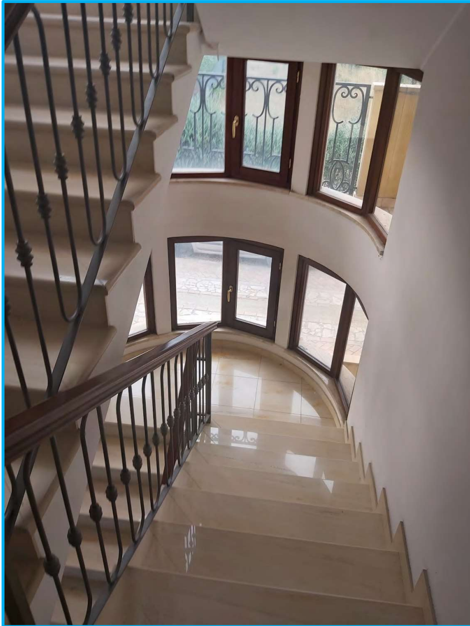
Corpo scale, vista dal piano primo.