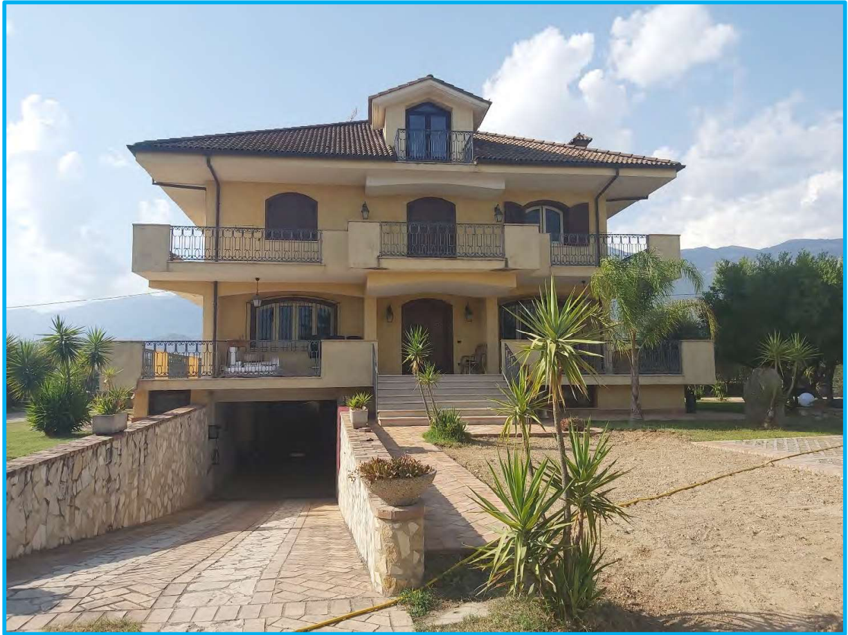
Vista dal confine sud, ingresso al piano terra e al piano interrato.