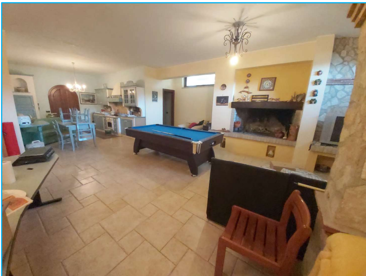
Tavernetta al piano interrato, da cui si perviene attraverso le scale interne.