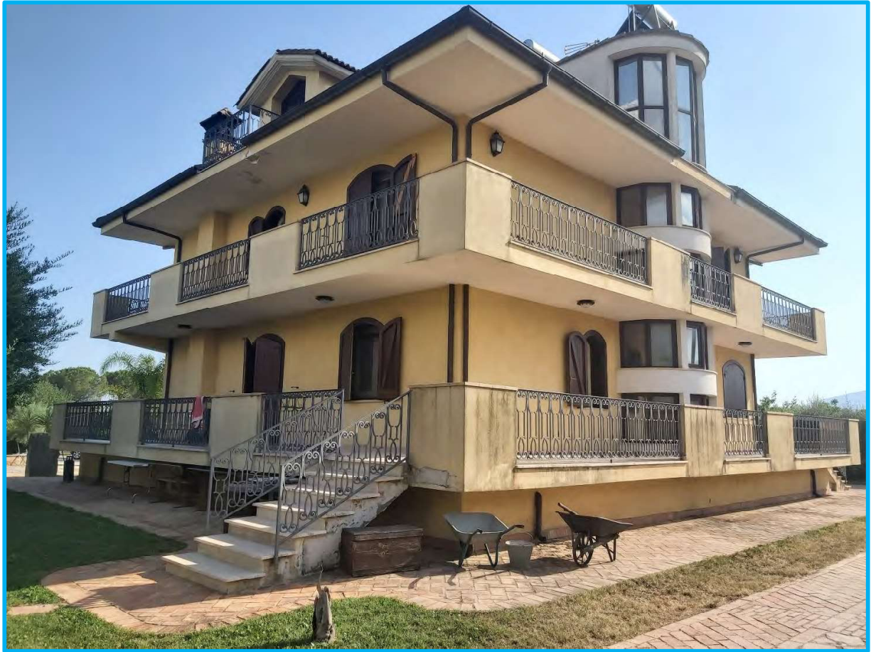
Vista della villa nel suo complesso, confini nord ed est