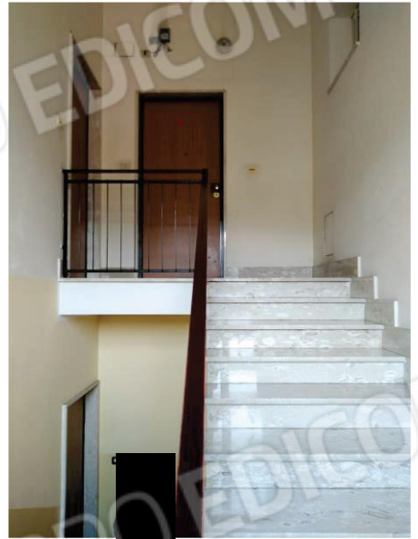
1-2-3: PORTONE DI INGRESSO E SCALE CONDOMINIALI SINO AL PIANO