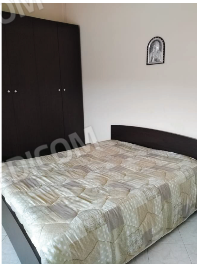
12 - 13: Camera da letto 1 vista da due angolazioni differenti, altezza min. e altezza max del solaio