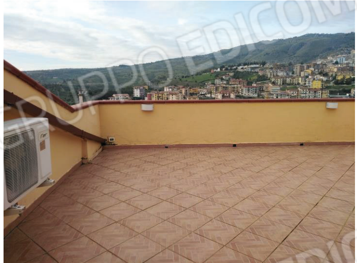
14 – 15: Disimpegno e terrazzo zona notte