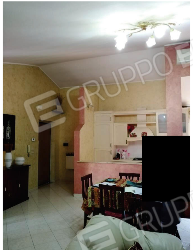
4 - 5: AMBIENTE UNICO SOGGIORNO - PRANZO - ANGOLO COTTURA