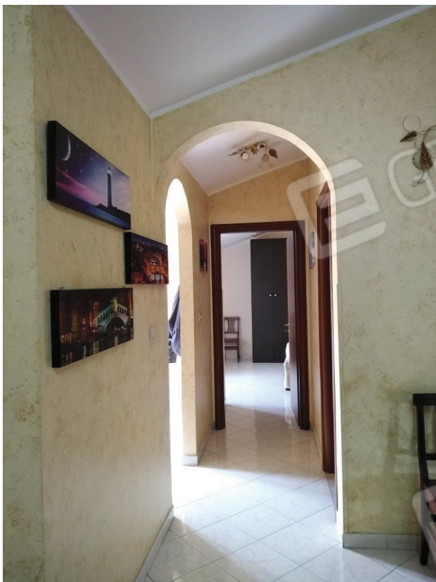
10: Disimpegno verso la zona notte