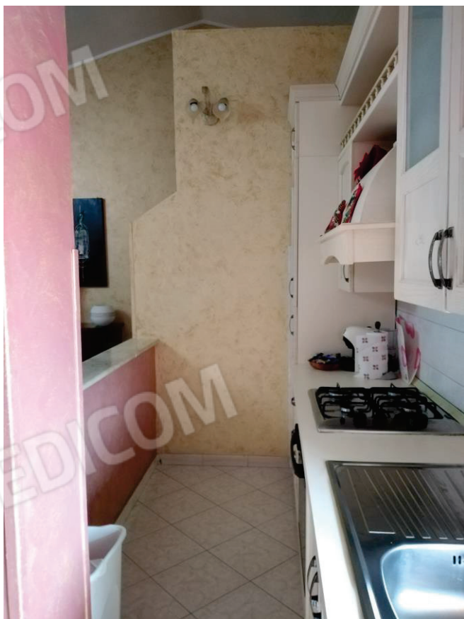
6 – 7 – 8 – 9: Vedute dello spazio unico, soggiorno – pranzo – angolo cottura e terrazzo zona giorno