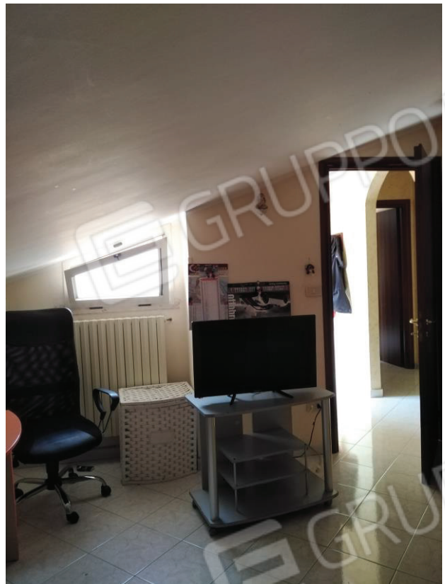
16 – 17: camera da letto 2 vista da due angolazioni diverse