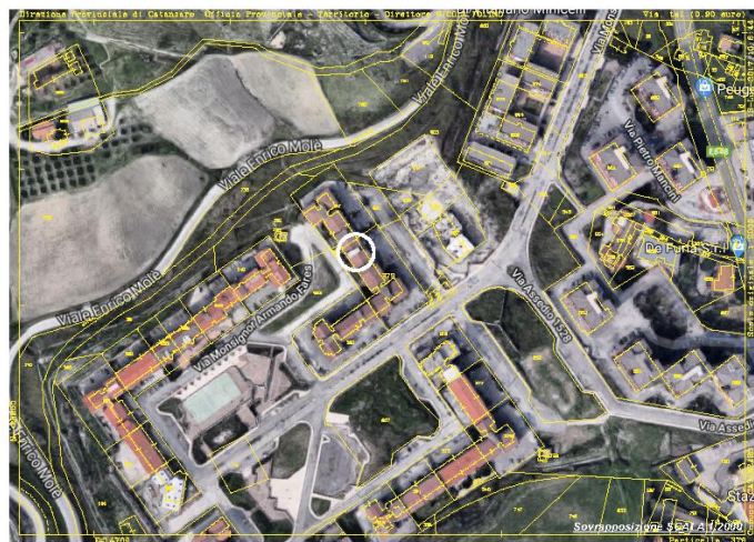
Immagine 1 - Sovrapposizione Foglio di mappa - Ortofoto

Al fine di procedere all'esatta individuazione del fabbricato in cui ricade l'immobile oggetto del pignoramento, si è proceduto alla sovrapposizione delle ortofoto prelevate da google maps, sovrapponendole al foglio di mappa (v. all. n. 7).