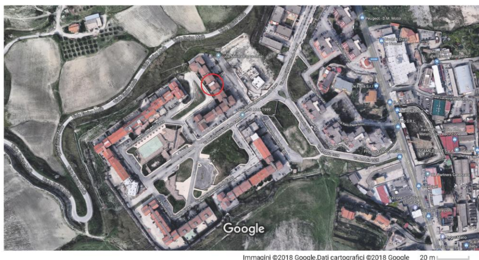
Immagine 1 - Ortofoto

L'immobile pignorato, come già detto al precedente p.to 1, consiste in un locale commerciale posto al piano terra, facente parte del maggiore stabile sito in Via A. Fares n. 20/b, 88100 Catanzaro (CZ), di seguito si riporta l'inquadramento dello stesso (v. Foto 1)