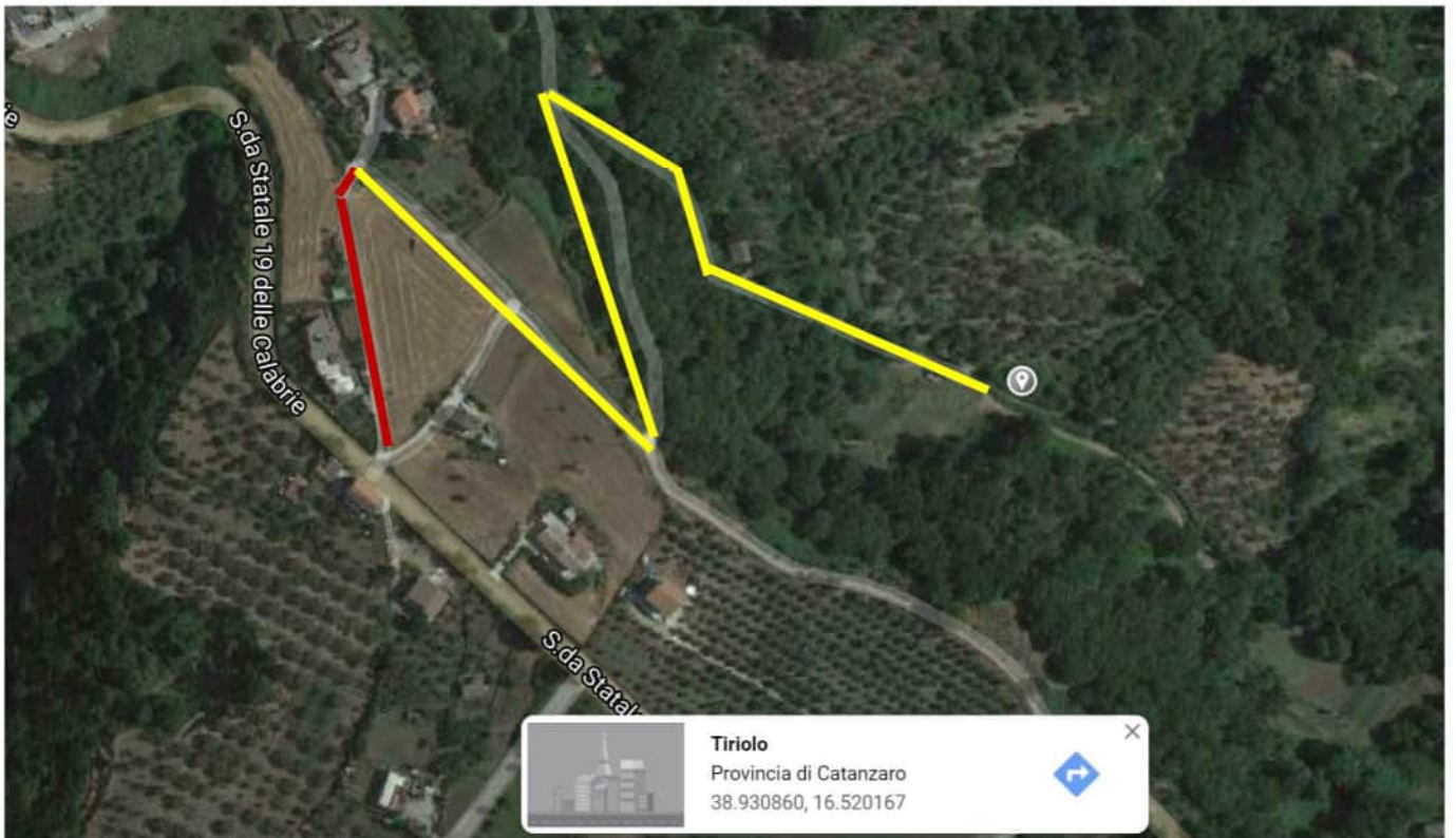
Fig. 1- Individuazione Lotti 1 e 8