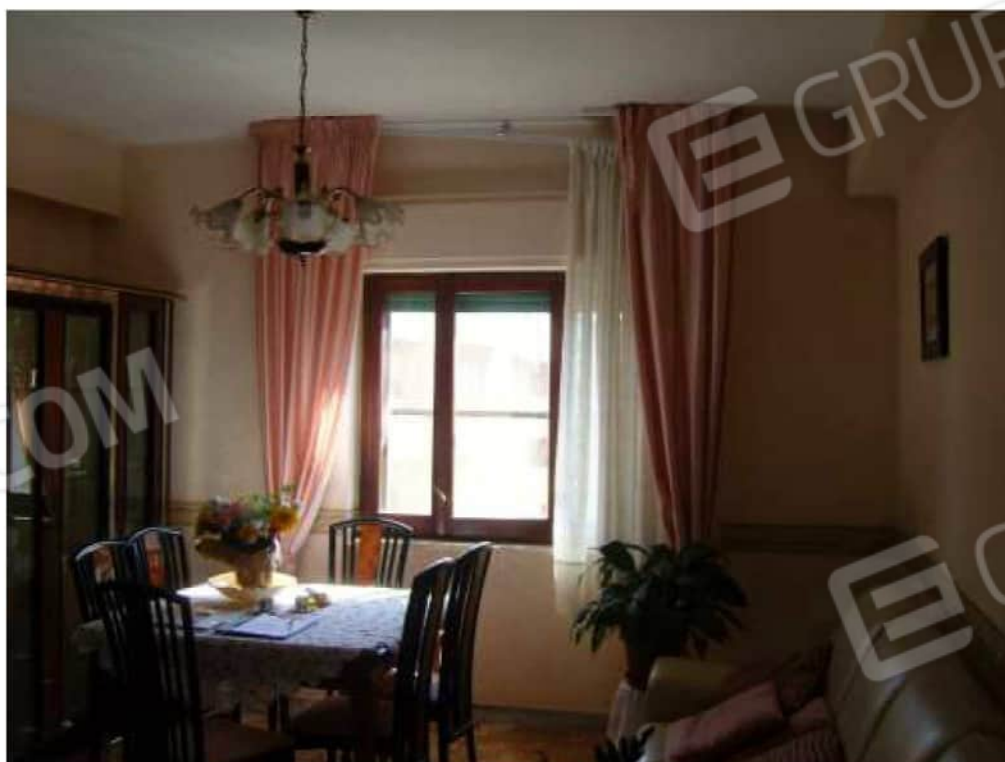
FOTO INTERNE ALL'IMMOBILE IN OGGETTO