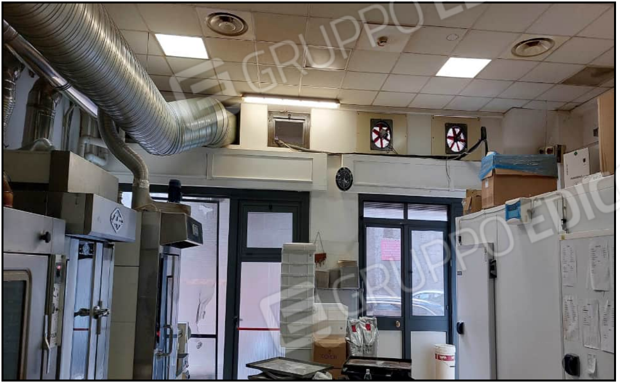
Foto 3. Vista dall'interno del locale dei due infissi