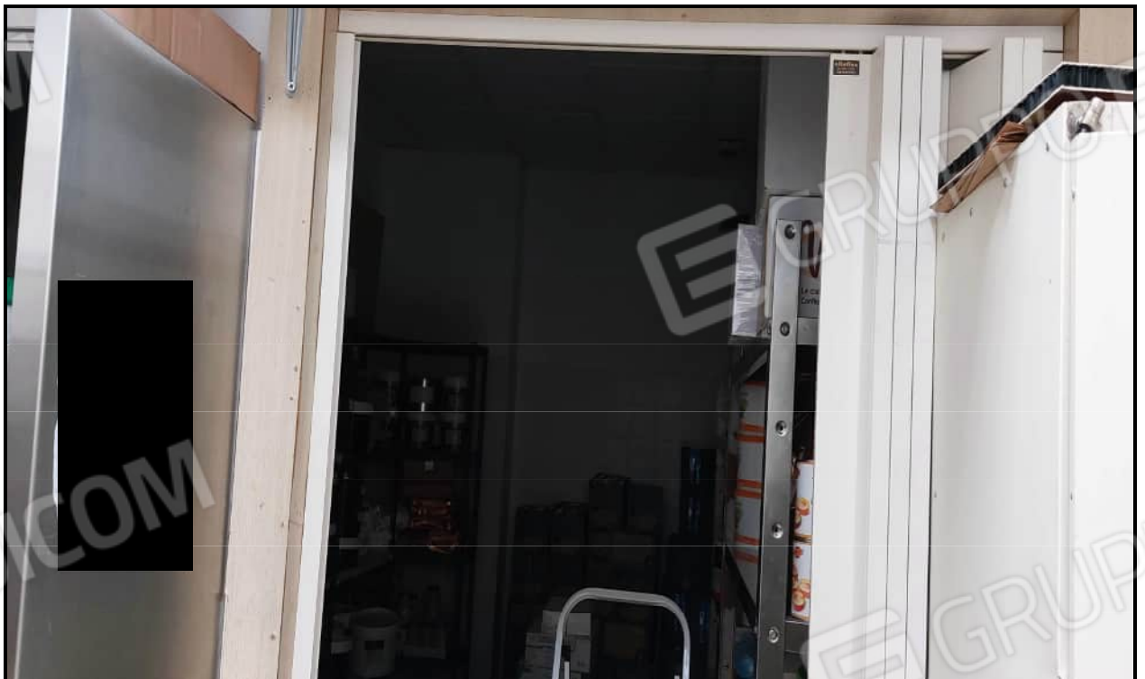
Foto 10 Vista ingresso ripostiglio