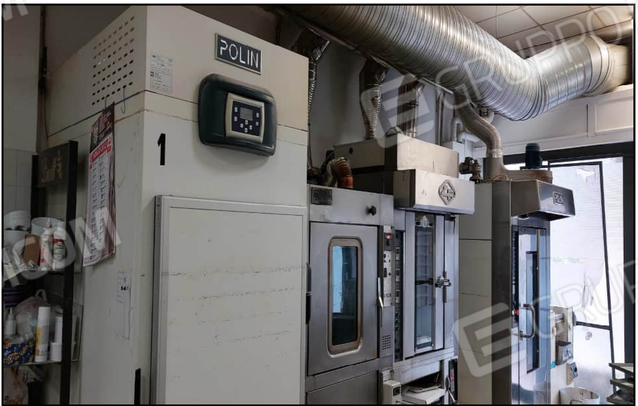
Foto 4. Vista frigoriferi e impiantistica del locale