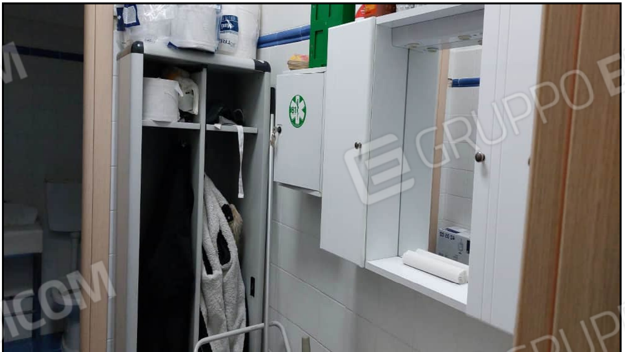
Foto 8. Altro spogliatoio con bagno sullo sfondo