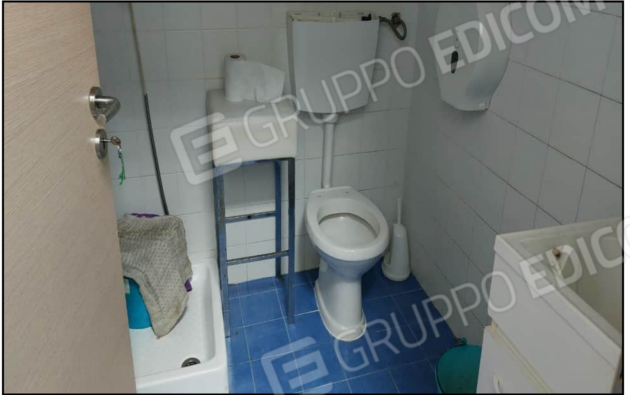
Foto 9 Vista interna bagno con doccia