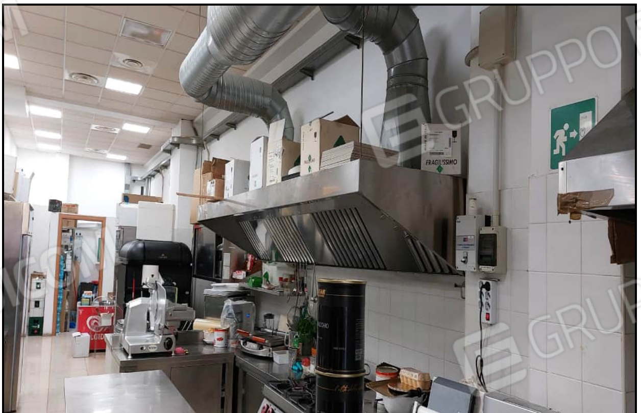
Foto 6. Vista piano cottura e cappe aspiranti