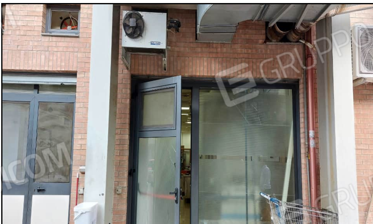
Foto 2. Porta di ingresso al locale dotata di maniglia esterna e maniglione antipanico interno per uscita di emergenza all'esterno