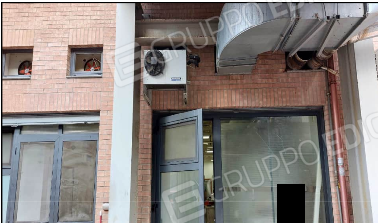
Foto 1. Vista dell'accesso al locale su prospetto posteriore in Via Lucrezia della Valle