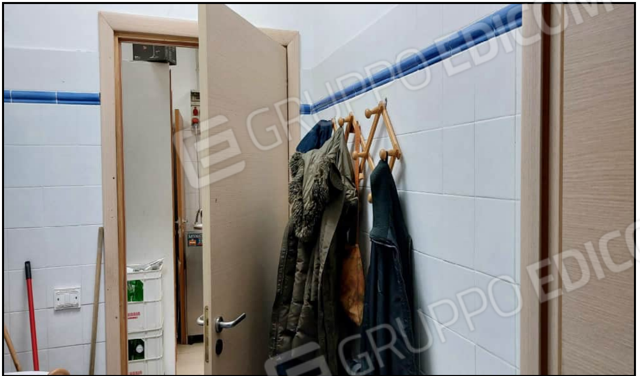
Foto 7. Vista interna spogliatoio