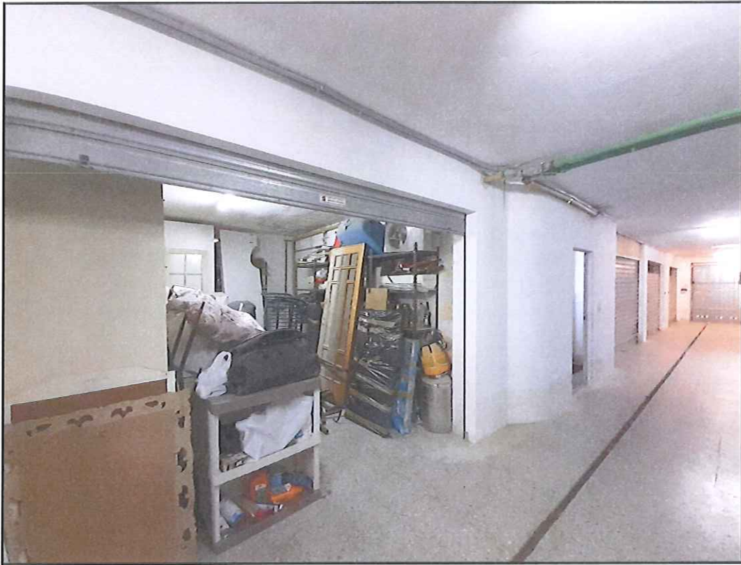
Foto 19. Magazzino a piano seminterrato sottostante l'appartamento