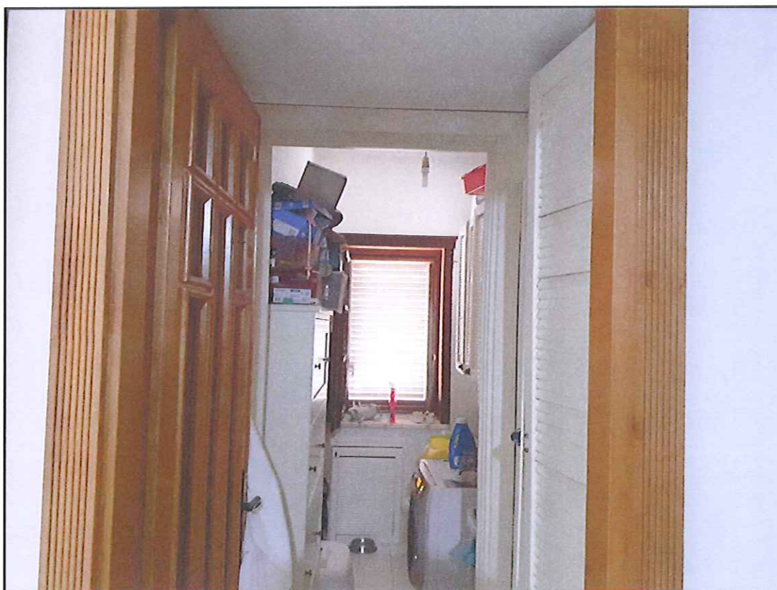
Foto 10 Bagno di servizio con ante bagno