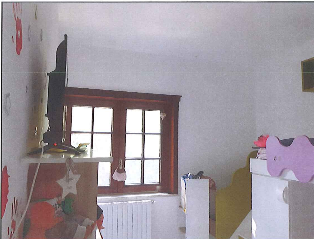
Foto 13. Altro camera della zona notte