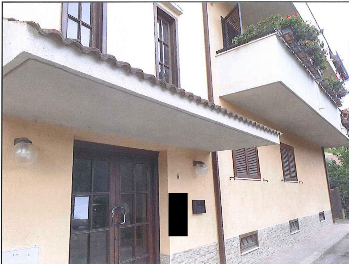
Foto 2. Ingresso del fabbricato con in destra il prospetto dell'immobile a piano terra