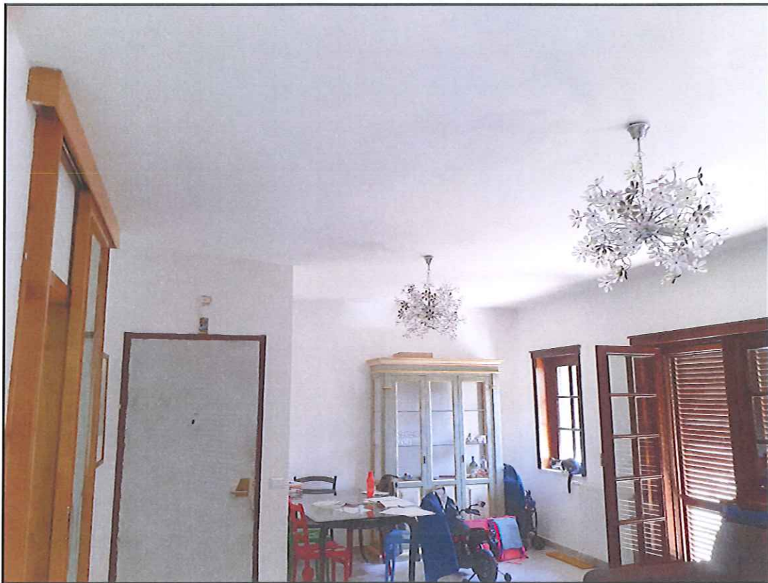
Foto 5. Ingresso e zona giorno dell'appartamento