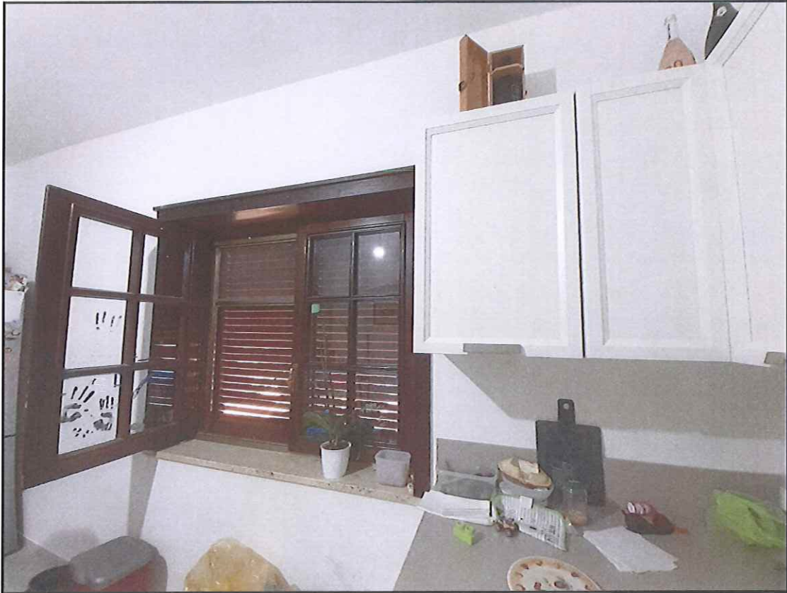
Foto 7. Infisso e pensili del vano cucina