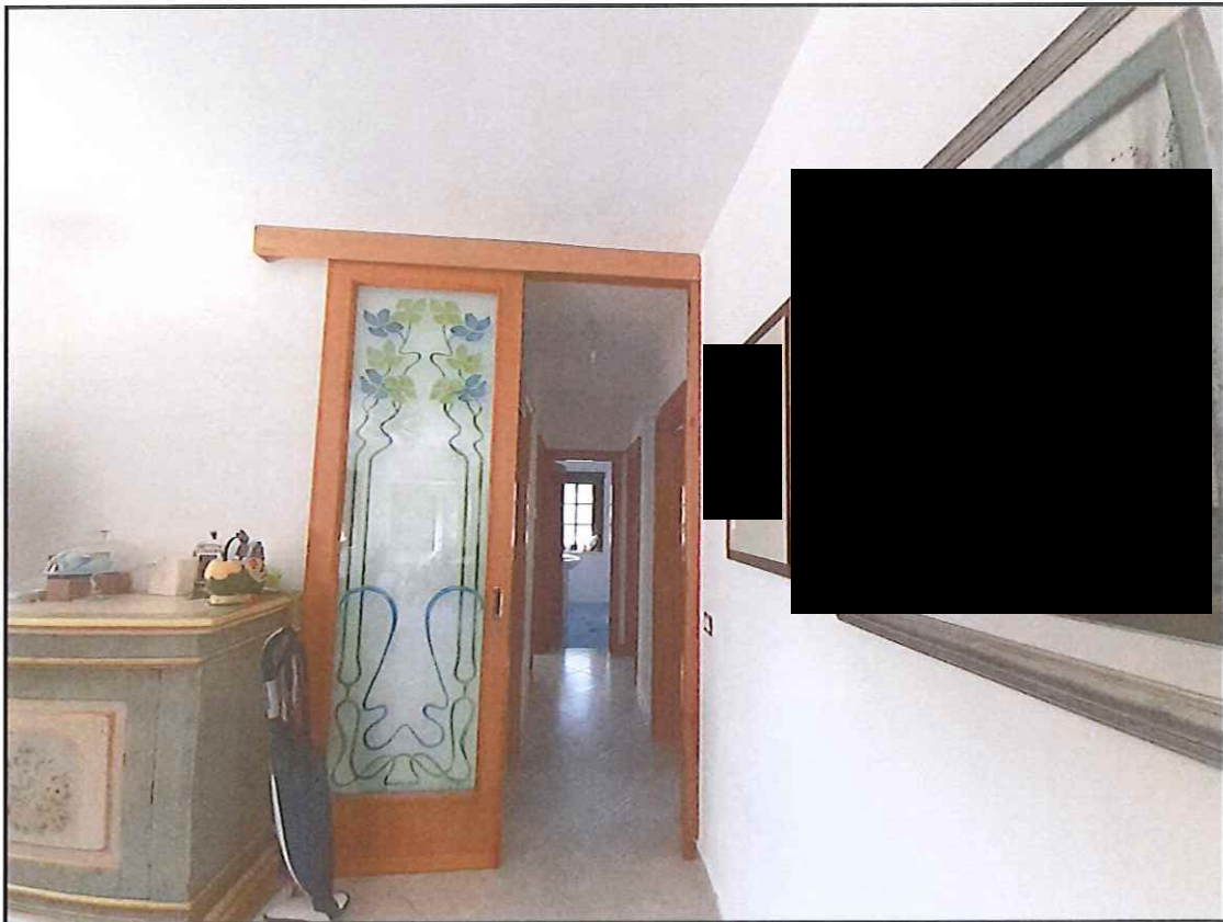
Foto 8. Disimpegno che dalla zona giorno conduce alla zona notte