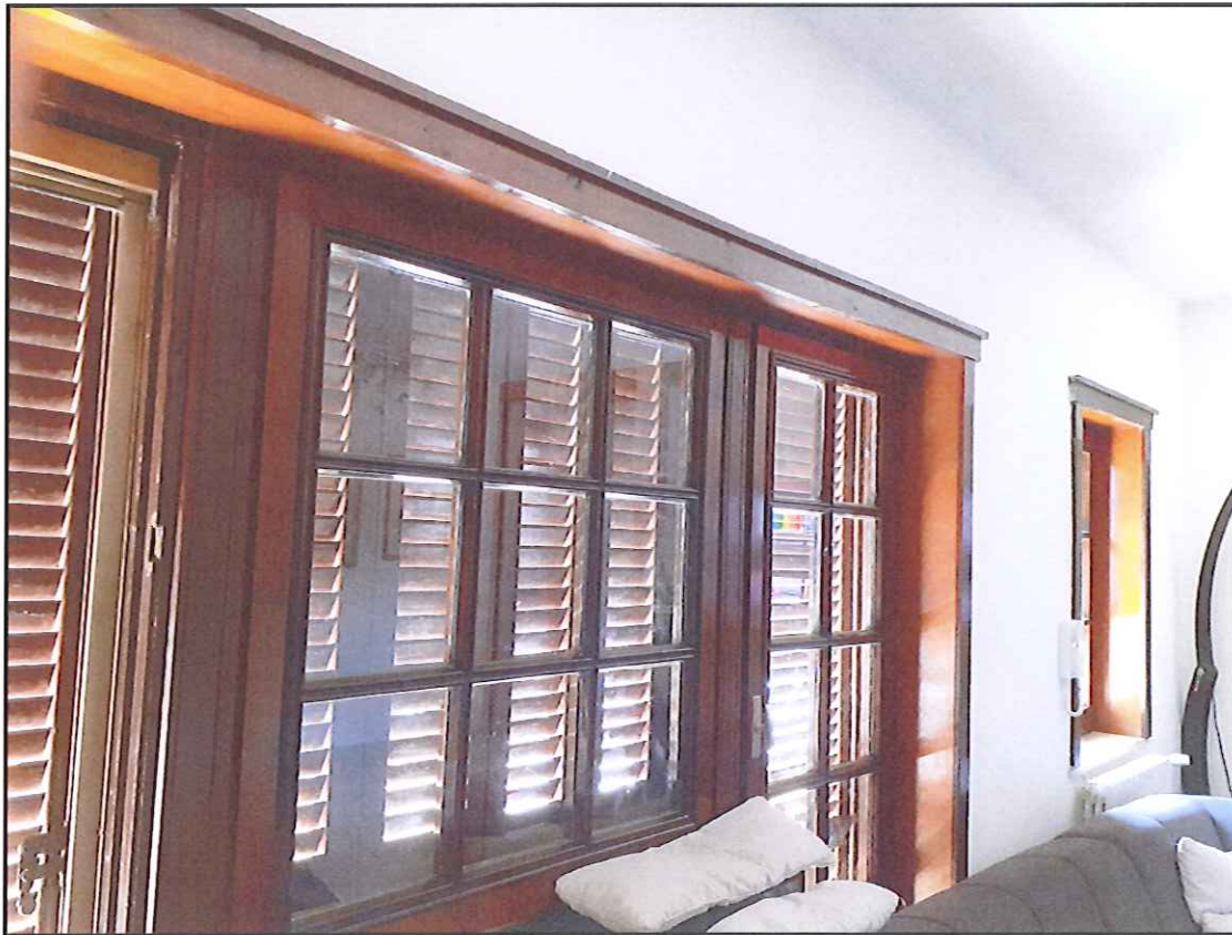
Foto 6. Infissi della zona giorno che affacciano su area di pertinenza esterna