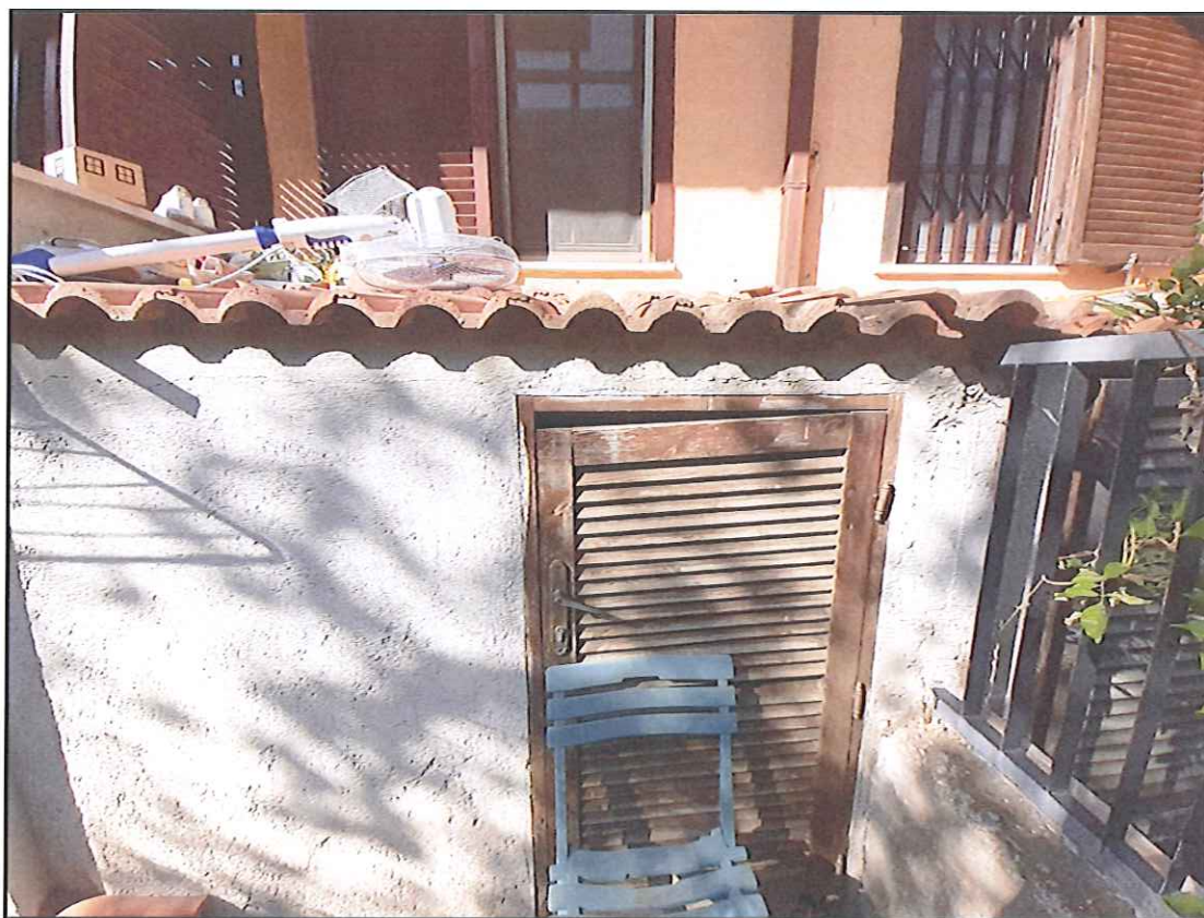
Foto 16. Vista frontale del locaie tecnico e confine lato Est con altra proprietà