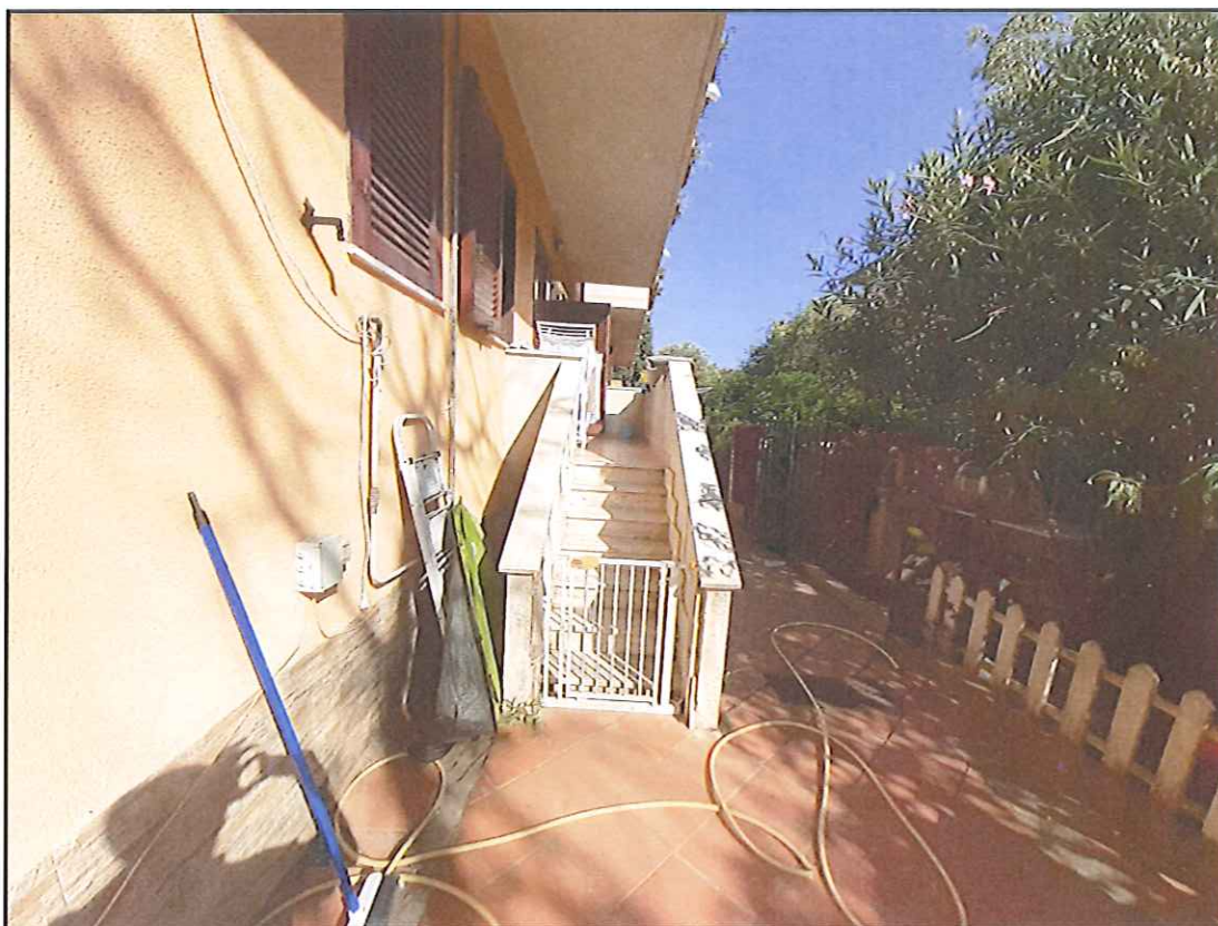
Foto 14. Area di pertinenza esterna pavimentata