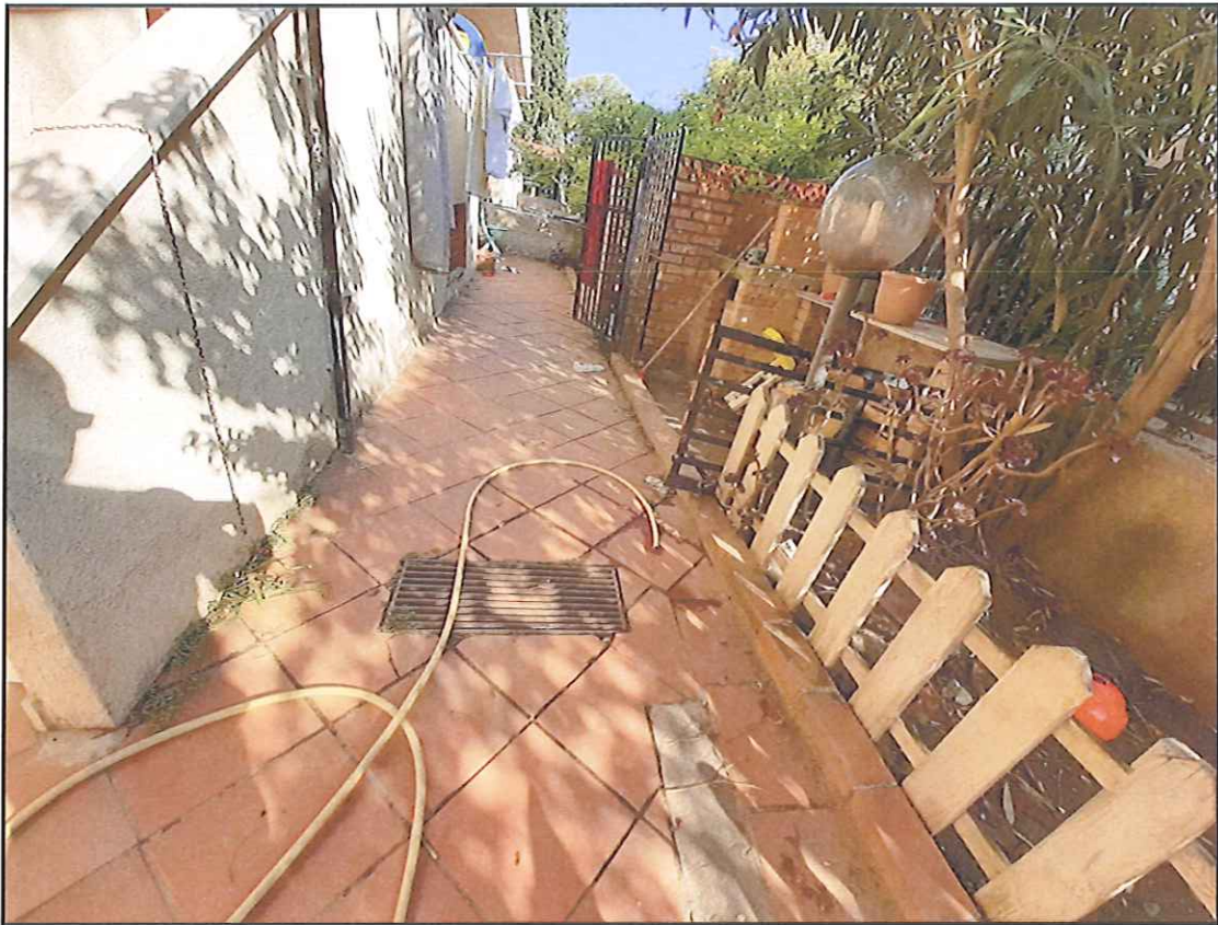
Foto 17. Particolare dell'aiuola e del confine lato Sud dell'area di pertinenza