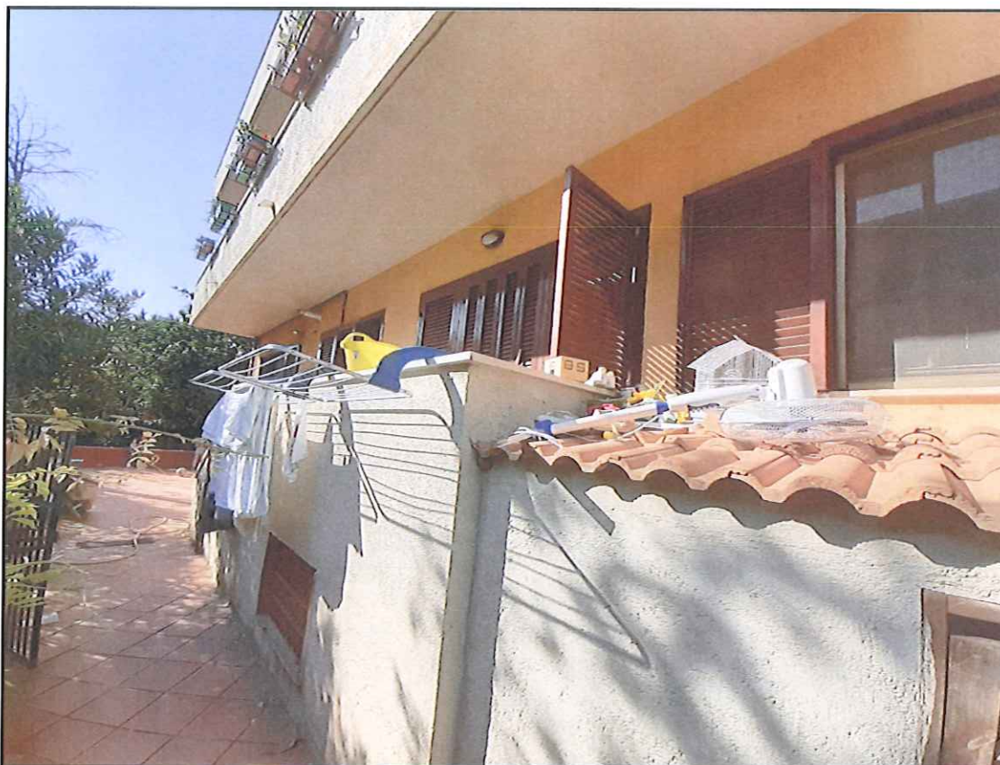
Foto 15. Locaie tecnico adiacente al pianerottolo di ingresso al soggiorno