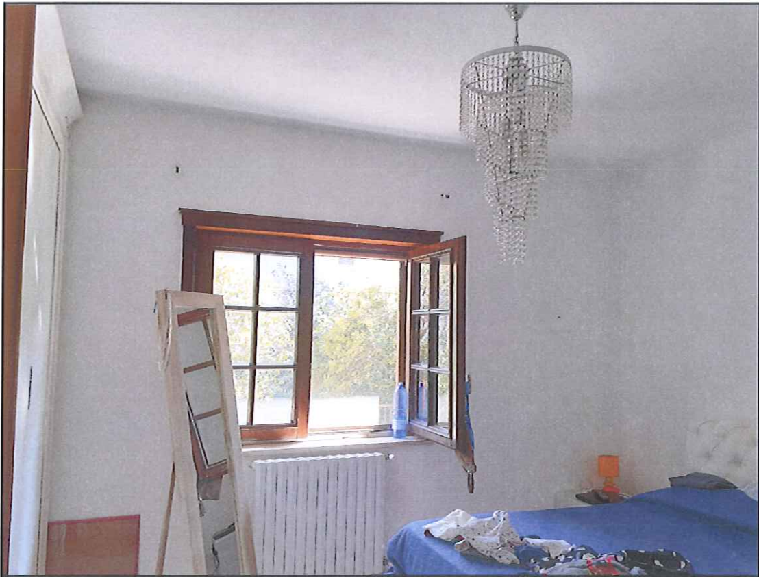
Foto 11. Camera da letto matrimoniale