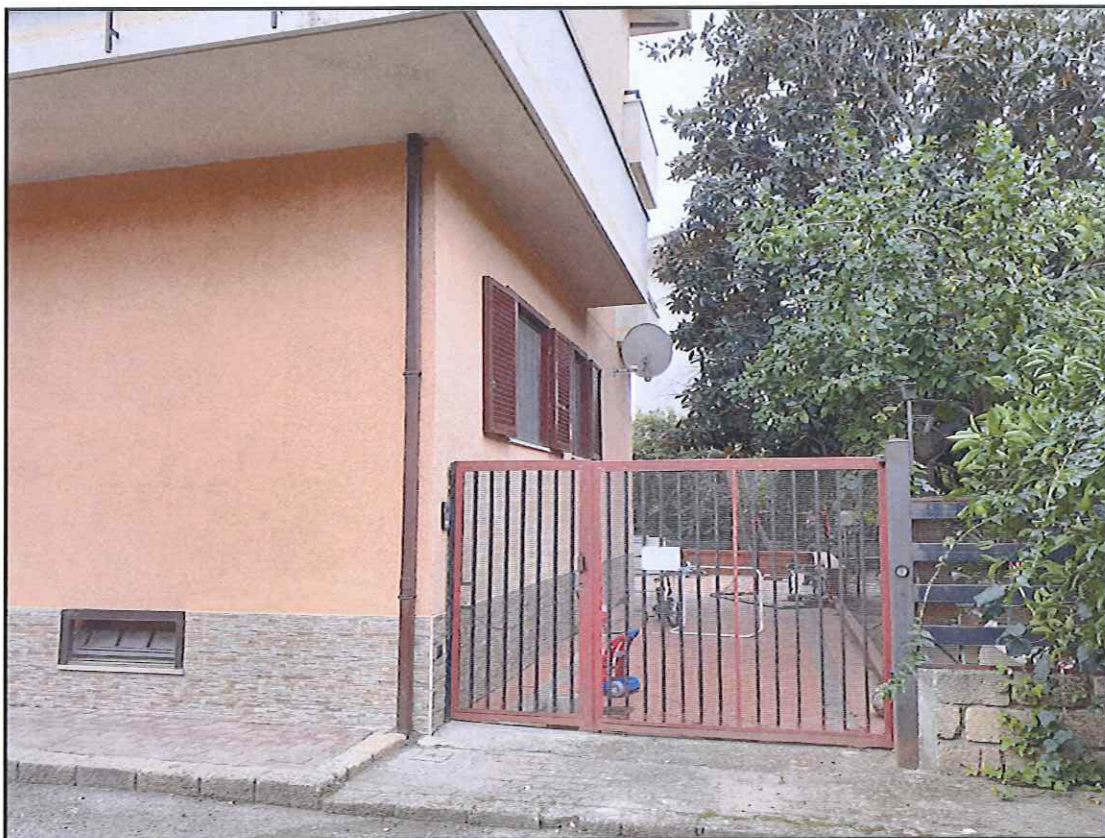
Foto 4. Cannello dell'area di pertinenza esterna e prospetto Ovest dell'immobile