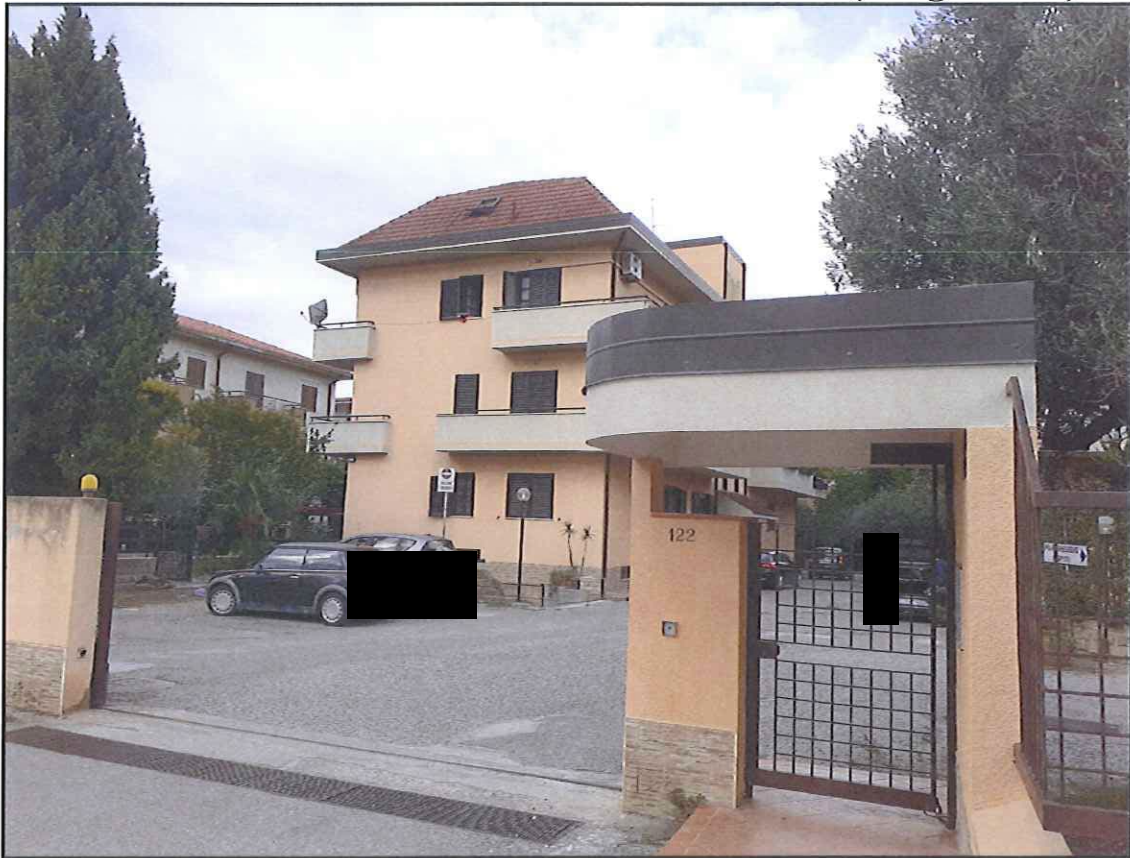
Foto 1. Vista dell'ubicazione immobile di Via Conti Falluc n° 122