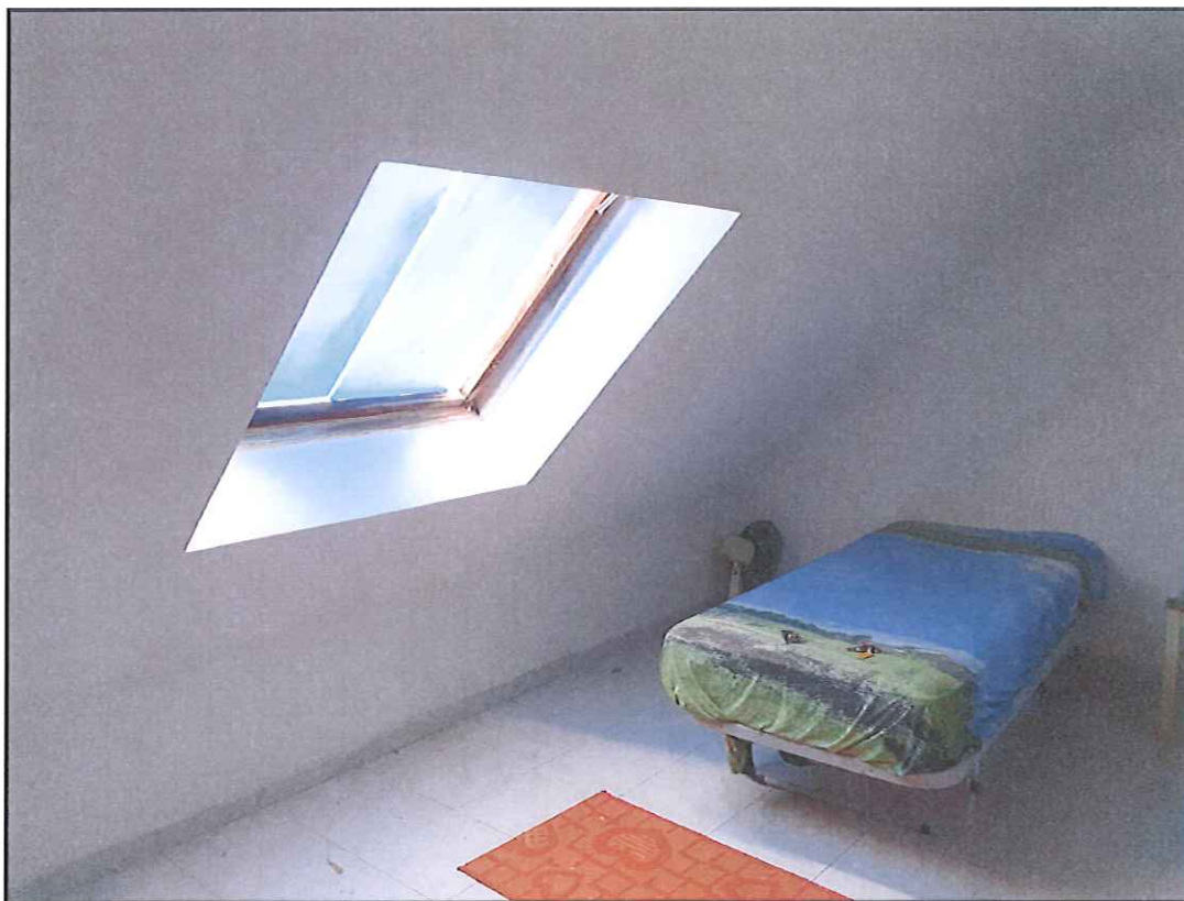
Foto 24. Vista lucernaio e letto nel locale sottotetto