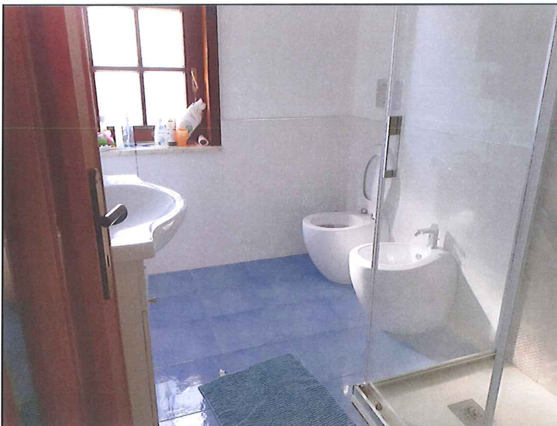
Foto 9 Bagno principale