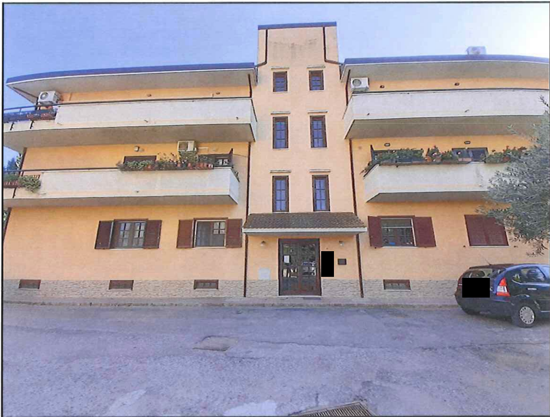
Foto 3. Vista dell'intero prospetto di ingresso lato nord del fabbricato