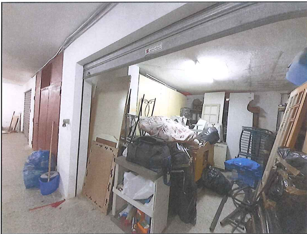
Foto 20. Altra vista del magazzino con macchie di umidità al soffitto