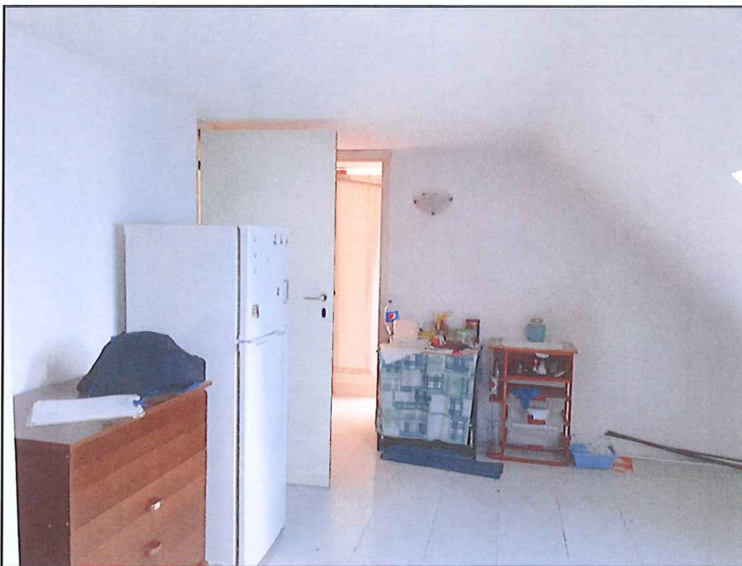
Foto 22. Parete divisoria con ingresso al bagno