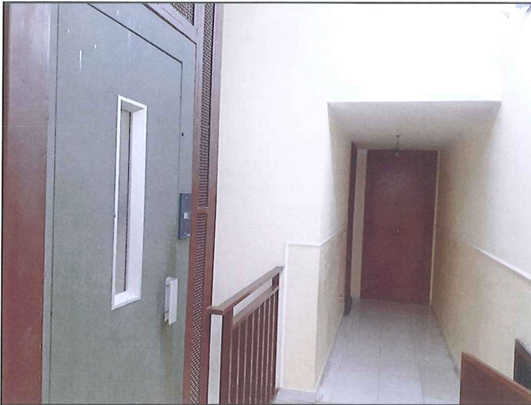
Foto 21. Accesso a locale deposito al sottotetto con la prima porta a sinistra delle scale