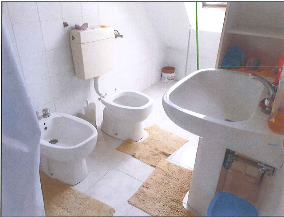
Foto 23. Bagno con wc, bidet, lavello e doccia