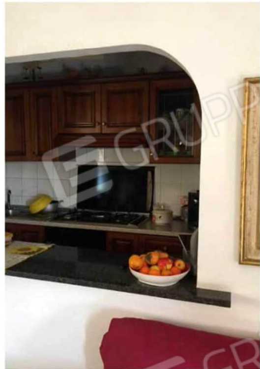
Viste ambiente cucina-soggiorno