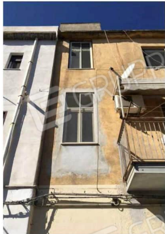
Viste esterno fabbricato e accesso da Via del Risorgimento numero civico 83