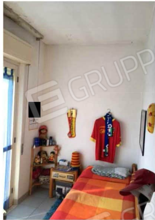
Viste ambiente cameretta più piccola