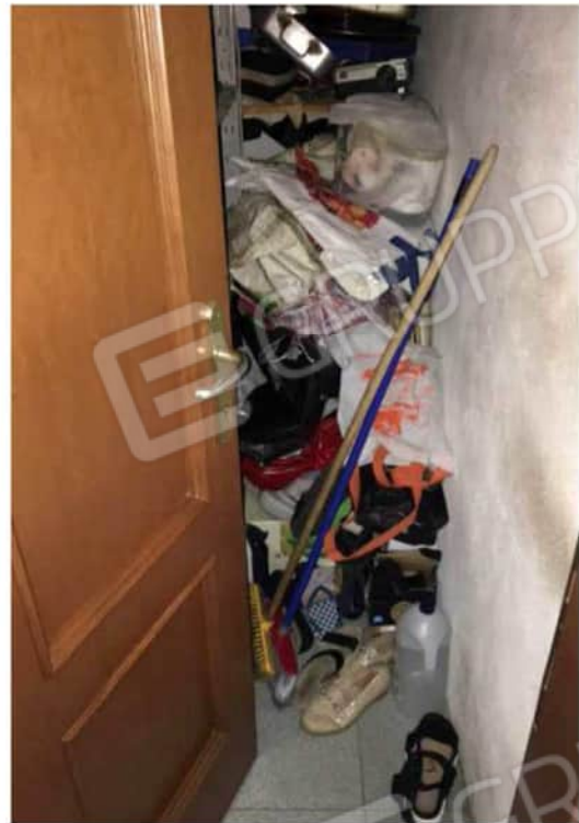
Viste ambiente disimpegno e ripostiglio