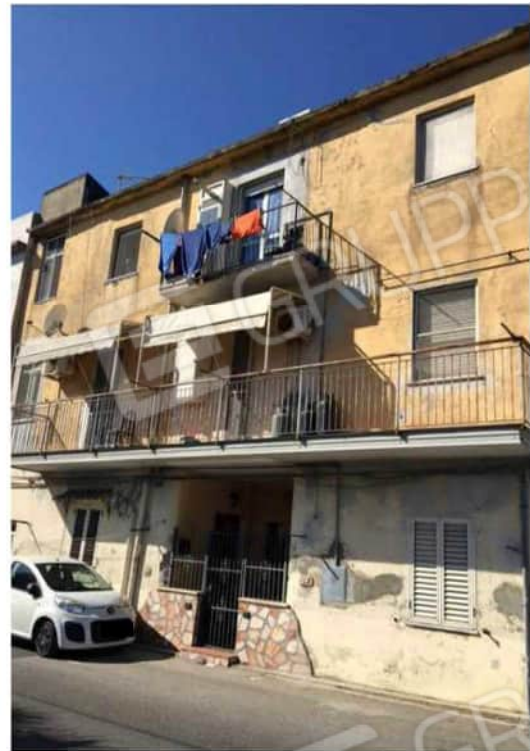
Viste esterno fabbricato