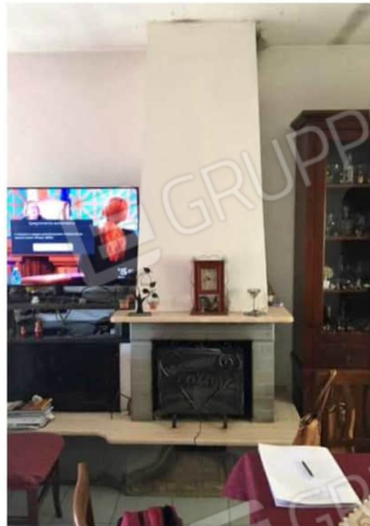
Viste ambiente ingresso – cucina - soggiorno