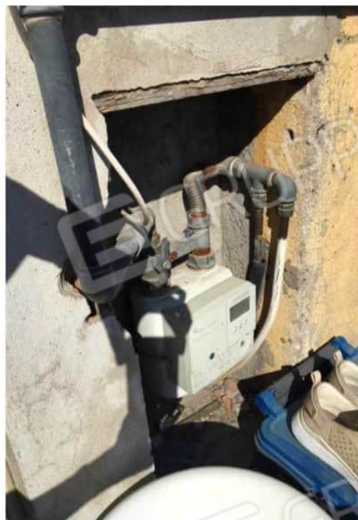
Viste esterna balcone e impianti posti sul balcone