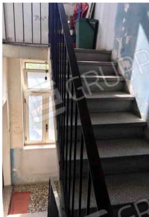
Viste accesso all'immobile sito al piano secondo dal corpo scala comune