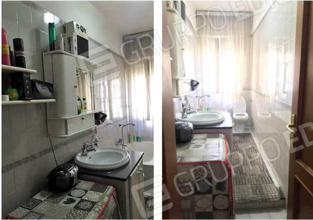
Viste ambiente unico servizio igienico

0961.774845-393.4717172/raffaella.squillace@archiworldpec.it R.G.E. n° 167/2022