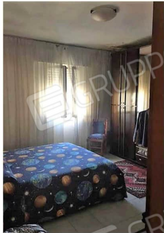
Viste ambiente camera letto matrimoniale