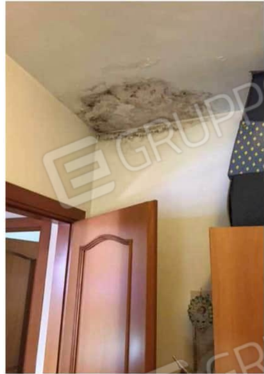
Viste ambiente cameretta più grande e in fondo al corridoio