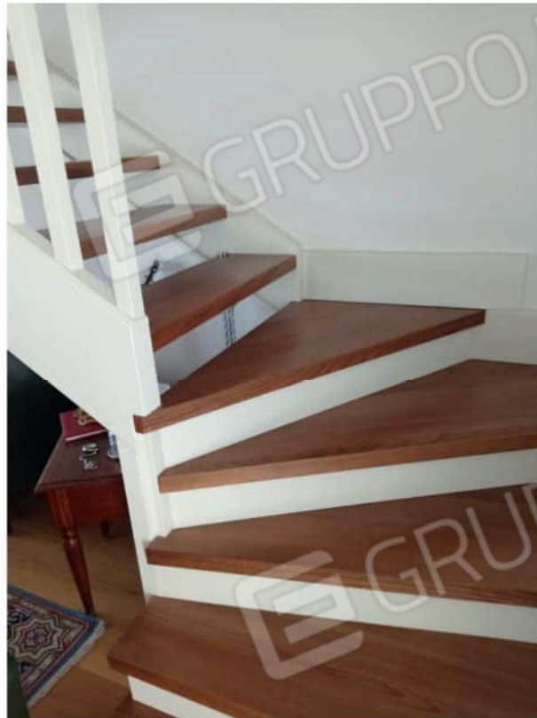
vista soggiorno terzo piano sottotetto