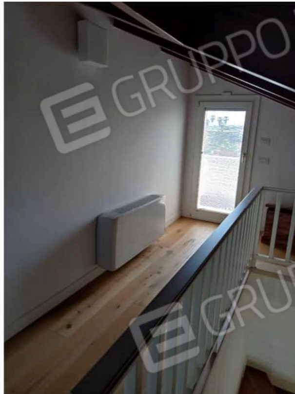
wc terzo piano sottotetto