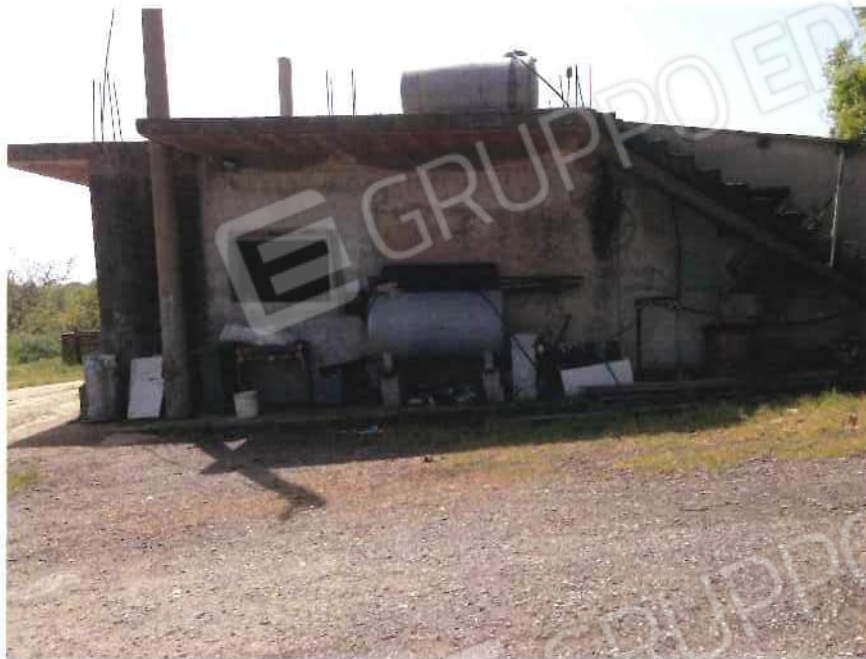
Foto 27 / 28 – Fondo in località “Colicchio” – foglio 31, mappali 215, 216, 217, 218, 219, 220, 221, 222, 257, 258, 403, 404, 405 (lotto 9)