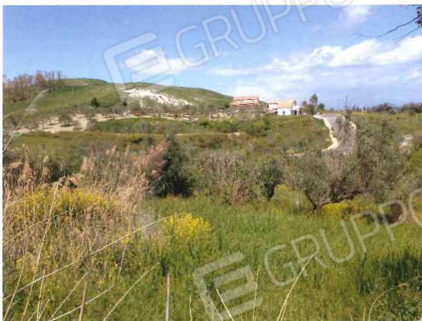
Foto 19 / 20 – Fondo in località “Petruso” – fg. 34, mappale 20 (lotto 7)