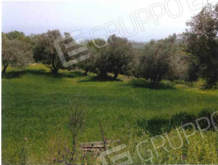
Foto 23 / 24 – Fondo in località “Colicchio” – foglio 31, mappali 215, 216, 217, 218, 219, 220, 221, 222, 257, 258, 403, 404, 405 (lotto 9)