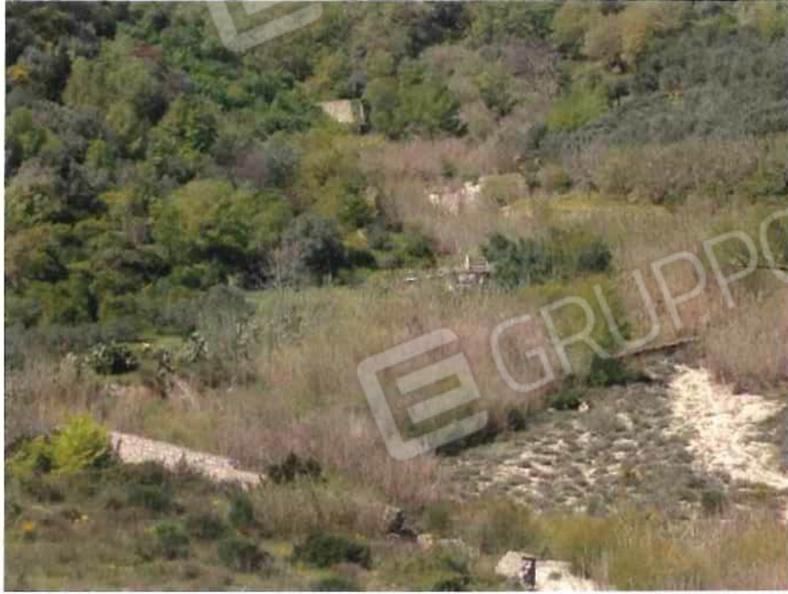
Foto 43 – Fondo in località “Sambrase - Vilardi– foglio 10, mappali 60, 315 (lotto 12)