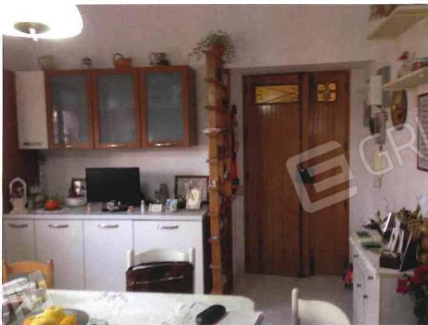
Foto 18 – Bene in via delle Serre, 48, fraz. Marina – fg. 34, mappale 202, sub 2 – interni (lotto 6)