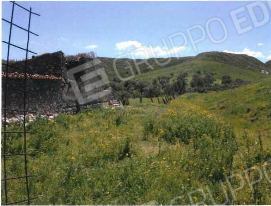
Foto 39 / 40 – Fondo in località “Feghicello”– foglio 12, mappali 77, 78, 99, 142, 145, 146, 150, 155 (lotto 11)