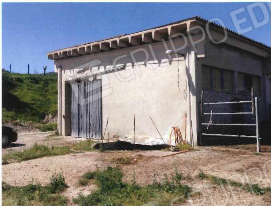
Foto 33 / 34 – Fondo in località “S. Pietro” (stalla) – foglio 10, mappali 137, 138, 141, 175 (lotto 10)