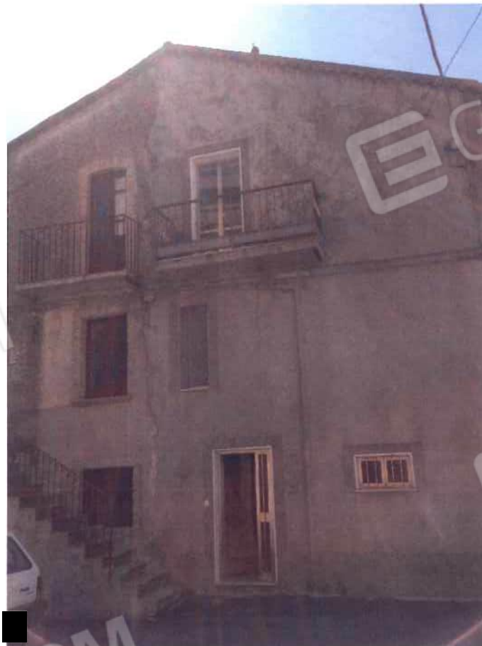
Foto 8 – Fabbricato in via Loi angolo via Roma - foglio, mappale 518, sub 1 (lotto 3)