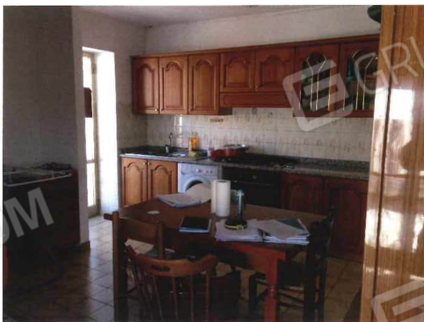
Foto 10 – Fabbricato in via Loi angolo via Roma - foglio, mappale 518, sub 1 – interni (lotto 3)