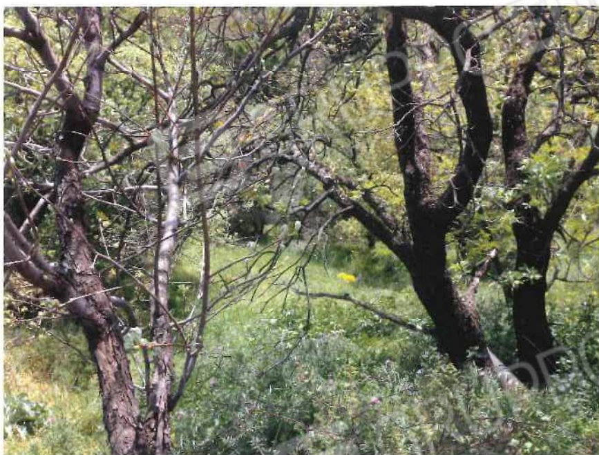
Foto 25 / 26 – Fondo in località “Colicchio” – foglio 31, mappali 215, 216, 217, 218, 219, 220, 221, 222, 257, 258, 403, 404, 405 (lotto 9)