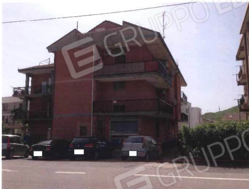
Foto 17 – Fabbricato in via delle Serre, 48, fraz. Marina - bene identificato con fg. 34, mappale 202, sub 2 (lotto 6)