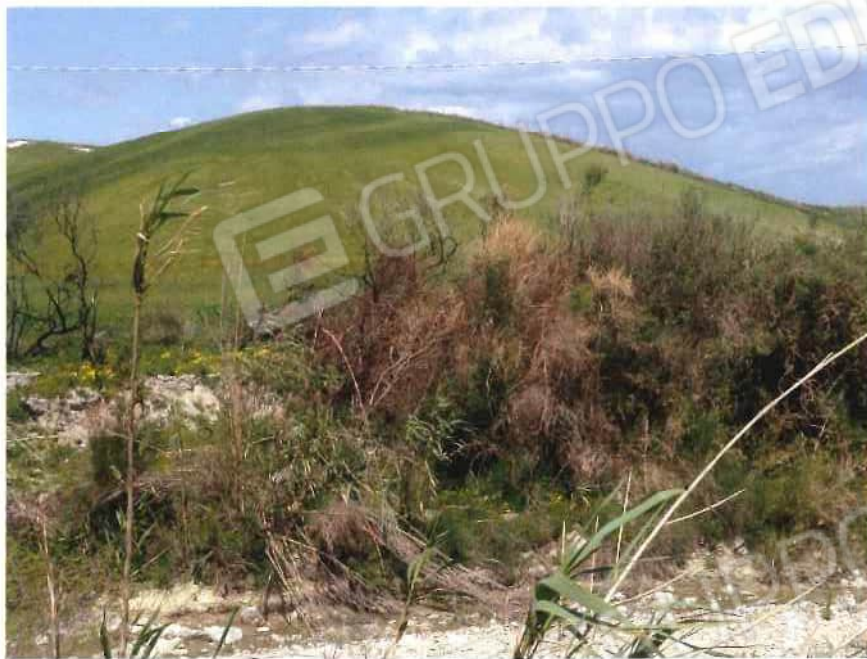
Foto 21 / 22 – Fondo in località “Ponzo” – foglio 13, mappali 24, 25, 38, 39, 48 (lotto 8)