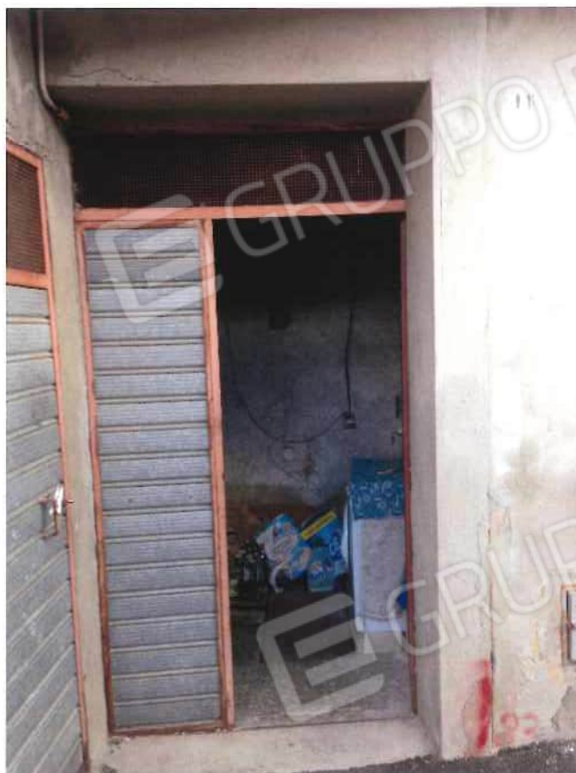
Foto 5 / 6 – Magazzini del Fabbricato in via Loi nn. 13 – 17 - foglio 21, mappale 456, sub 1 – 2 (lotto 1)