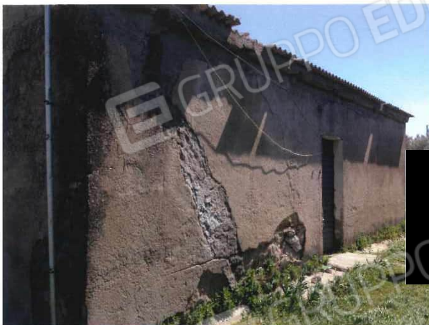
Foto 37 / 38 – Fondo in località “S. Pietro” (fabbricati fatiscenti) – foglio 10, mappali 137, 138, 141, 175 (lotto 10)