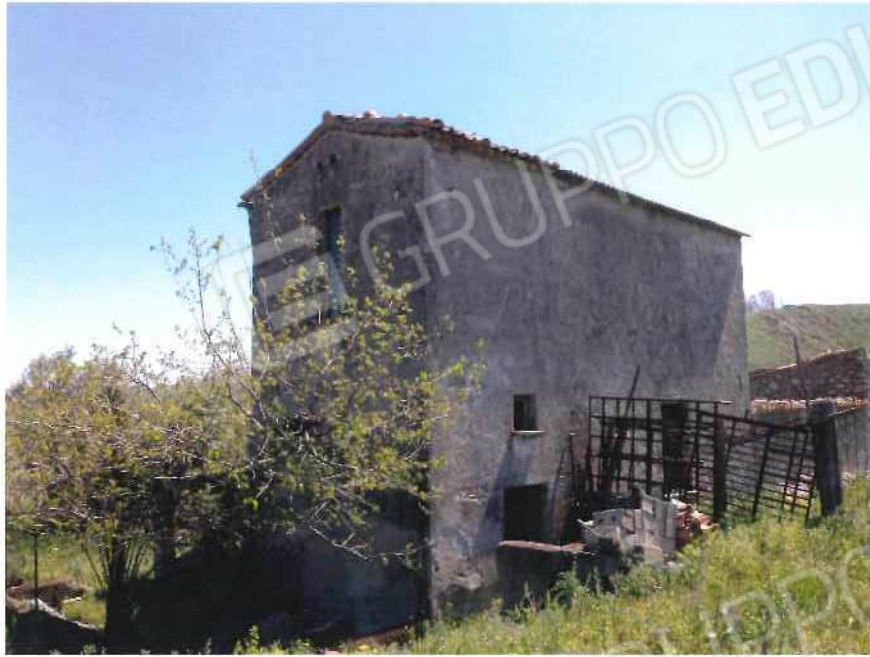
Foto 41 / 42 – Fondo in località “Feghicello” (fabbricati) – fg. 12, mappali 77, 78, 99, 142, 145, 146, 150, 155 (lotto 11)