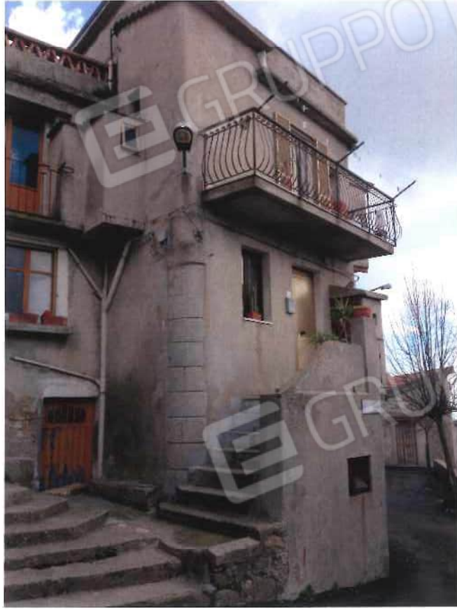
Foto 1 / 2 – Fabbricato in via Loi nn. 13 – 17 - foglio 21, mappale 456, sub 1 – 2 (lotto 1)