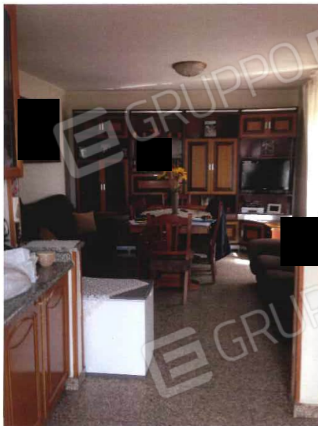
Foto 3 / 4 – Fabbricato in via Loi nn. 13 – 17 - foglio 21, mappale 456, sub 1 – 2 – interni (lotto 1)