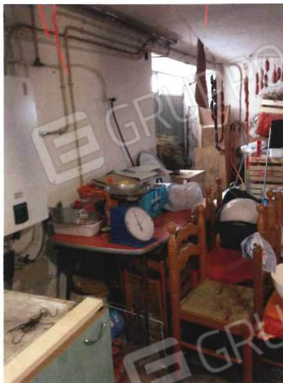
Foto 15 – Fabbricato, adibito ad abitazione, trav. II via Piave n. 20 - foglio 21, mappale 570 - interni (lotto 4)