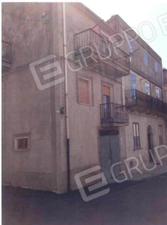
Foto 9 – Fabbricato in via Loi angolo via Roma - foglio, mappale 518, sub 1 (lotto 3)