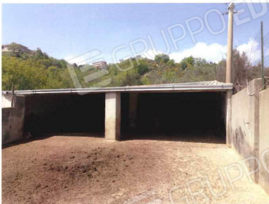
Foto 29 / 30 – Fondo in località “Colicchio” – foglio 31, mappali 215, 216, 217, 218, 219, 220, 221, 222, 257, 258, 403, 404, 405 (lotto 9)