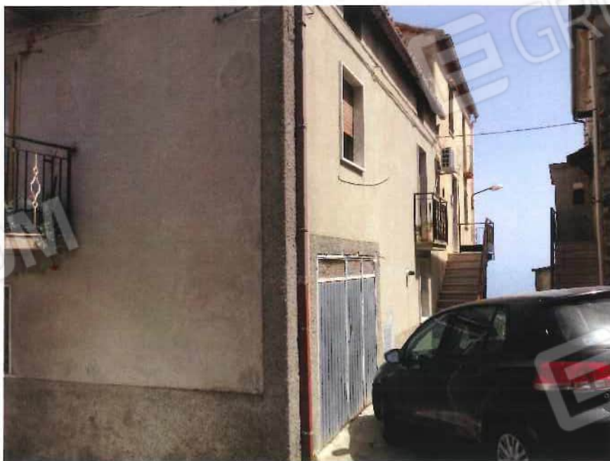
Foto 12 – Fabbricato, adibito ad abitazione, trav. II via Piave n. 20 - foglio 21, mappale 570 (lotto 4)