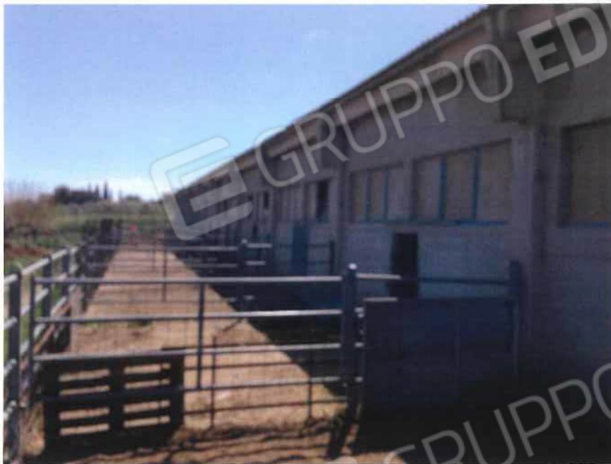
Foto 35 / 36 – Fondo in località “S. Pietro” (stalla) – foglio 10, mappali 137, 138, 141, 175 (lotto 10)