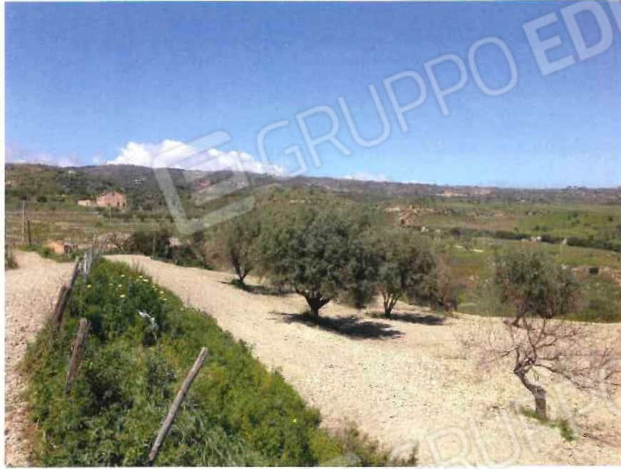
Foto 31 / 32 – Fondo in località “S. Pietro” – foglio 10, mappali 137, 138, 141, 175 (lotto 10)