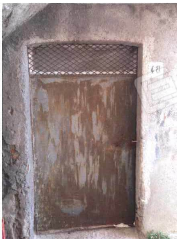
Foto 16 - Magazzino / deposito IIa trav. Via Piave, 48 - foglio 21, mappale 571, sub 1 (lotto 5)