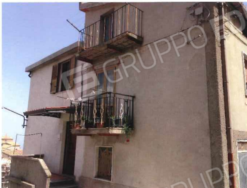
Foto 13 – Fabbricato, adibito ad abitazione, trav. II via Piave n. 20 - foglio 21, mappale 570 (lotto 4)