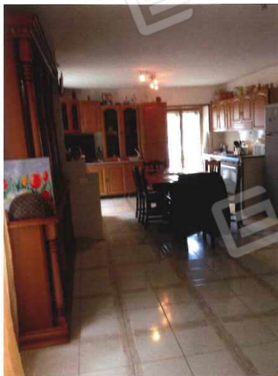
Foto 14 – Fabbricato, adibito ad abitazione, trav. II via Piave n. 20 - foglio 21, mappale 570 - interni (lotto 4)