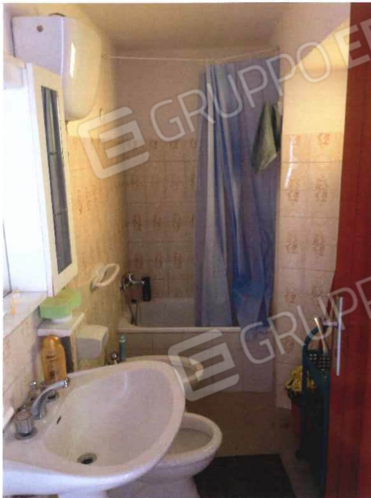
Foto 11 – Fabbricato in via Loi angolo via Roma - foglio, mappale 518, sub 1 – interni (lotto 3)