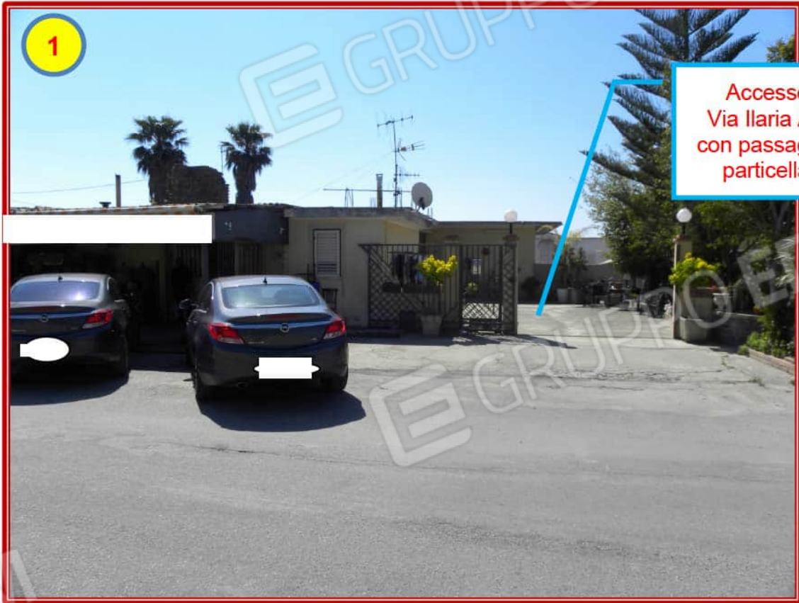
Foto nn. 1- 18: Unità Immobiliare ad uso residenziale nel NCEU fg. 6 part. 2699 sub. 3