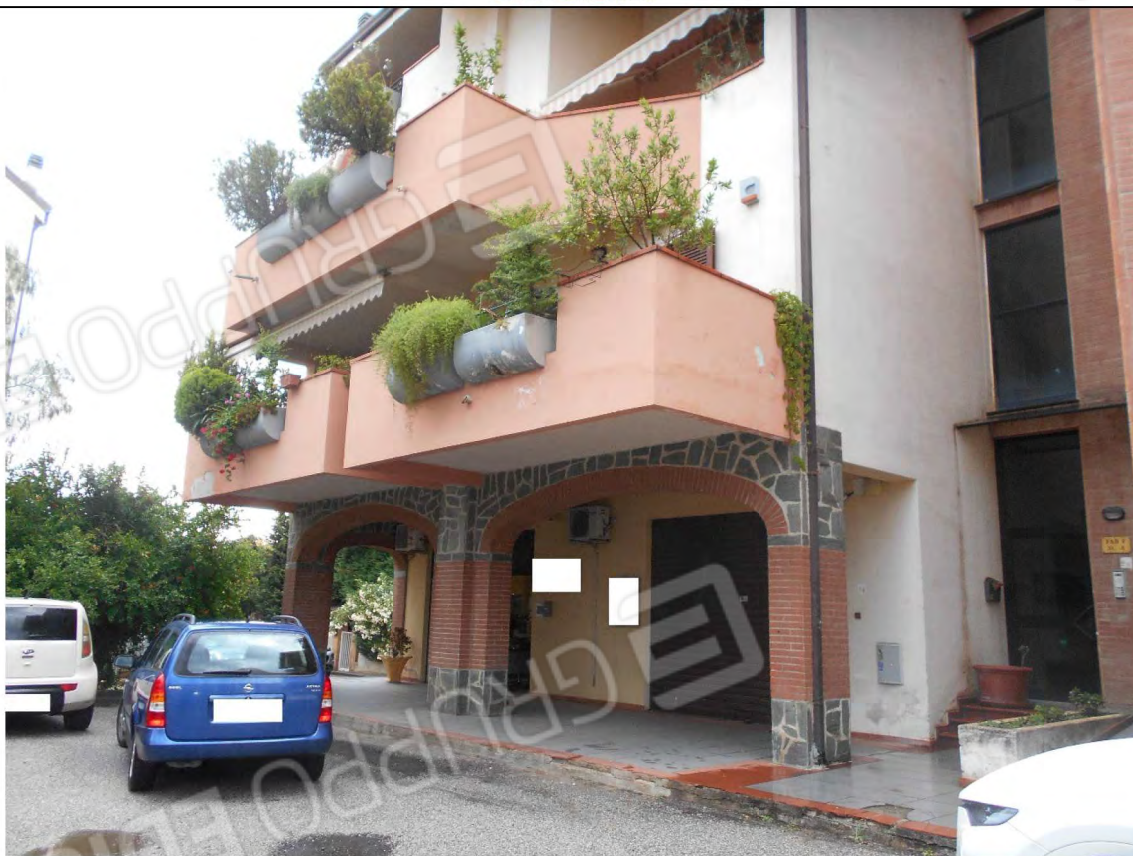
Prospetto OVEST particolare