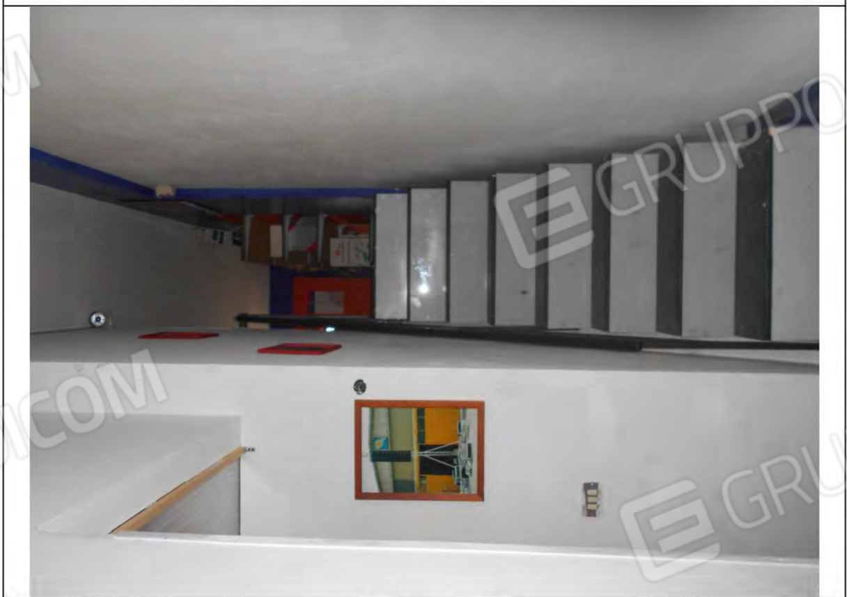
Scala accesso soppalco