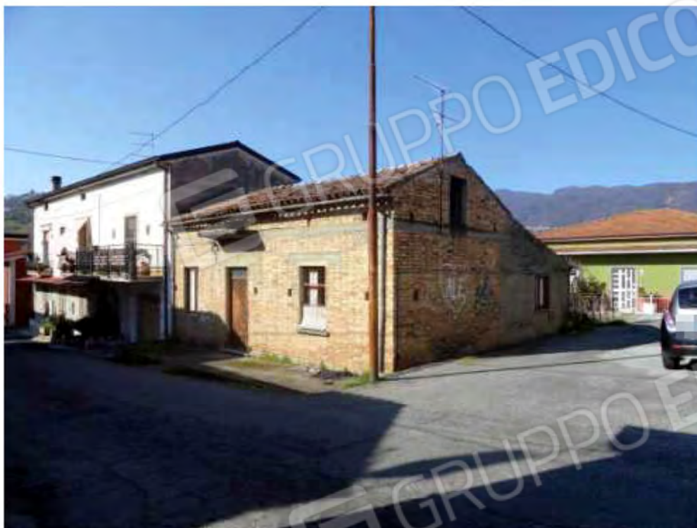
POSA N° 3 – FOTO CON PUNTO DI VISTA ALL’ESTERNO DELL’IMMOBILE - ZONA INGRESSO PRINCIPALE -PATIO