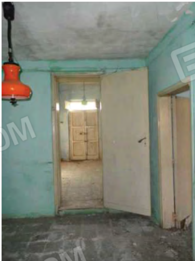
POSA N° 10 – FOTO CON PUNTO DI VISTA ALL'INTERNO DELL'IMMOBILE - ZONA - STANZA PROSPICIENTE IL GIARDINETTO - VISTA VERSO L'INGRESSO POSTO SUL PATIO