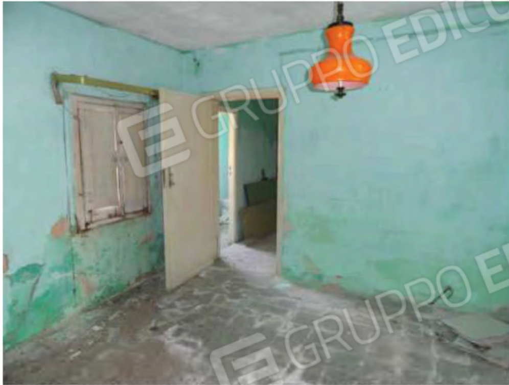
POSA N° 5 – FOTO CON PUNTO DI VISTA ALL'INTERNO DELL'IMMOBILE - ZONA STANZA ATTIGUA AL GIARDINETTO