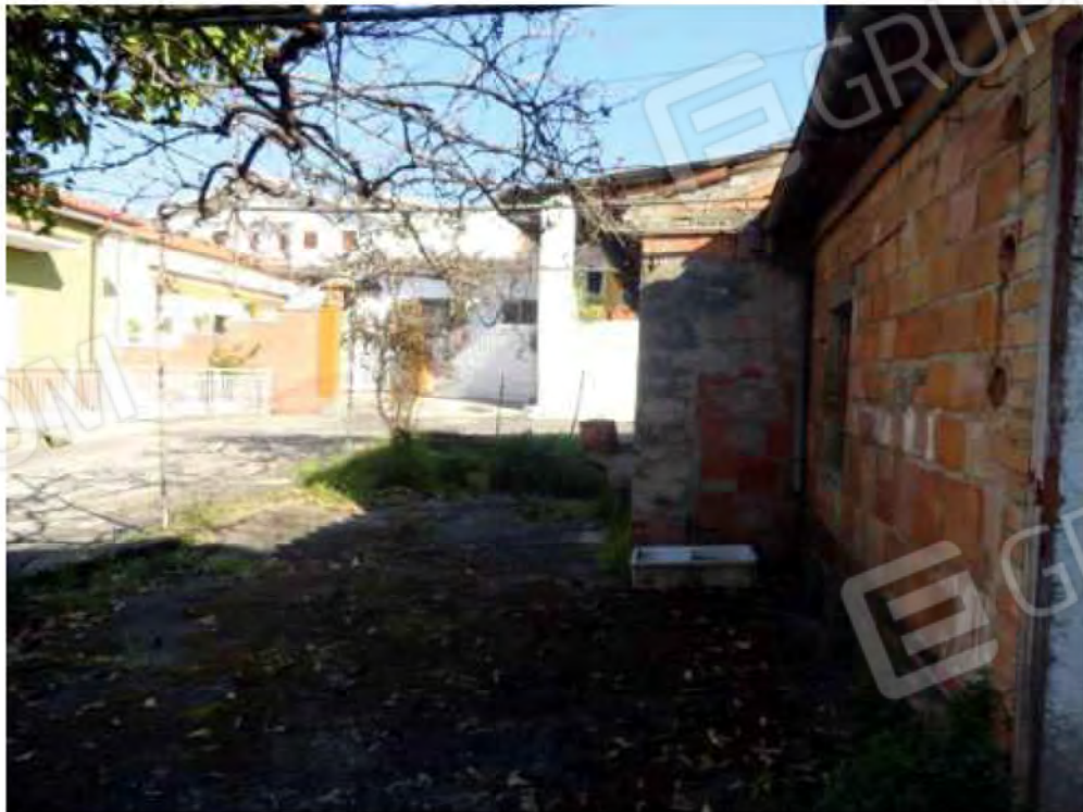
POSA N° 12 – FOTO CON PUNTO DI VISTA ALL'ESTERNO DELL'IMMOBILE - ZONA – INTERNA AL GIARDINETTO - VISTA VERSO VIA TELESIO