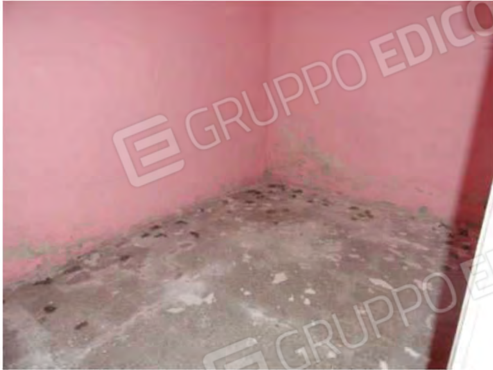
POSA N° 9 – FOTO CON PUNTO DI VISTA ALL'INTERNO DELL'IMMOBILE - ZONA - STANZA PROSPICIENTE IL PATIO – PARTICOLARE PAVIMENTO