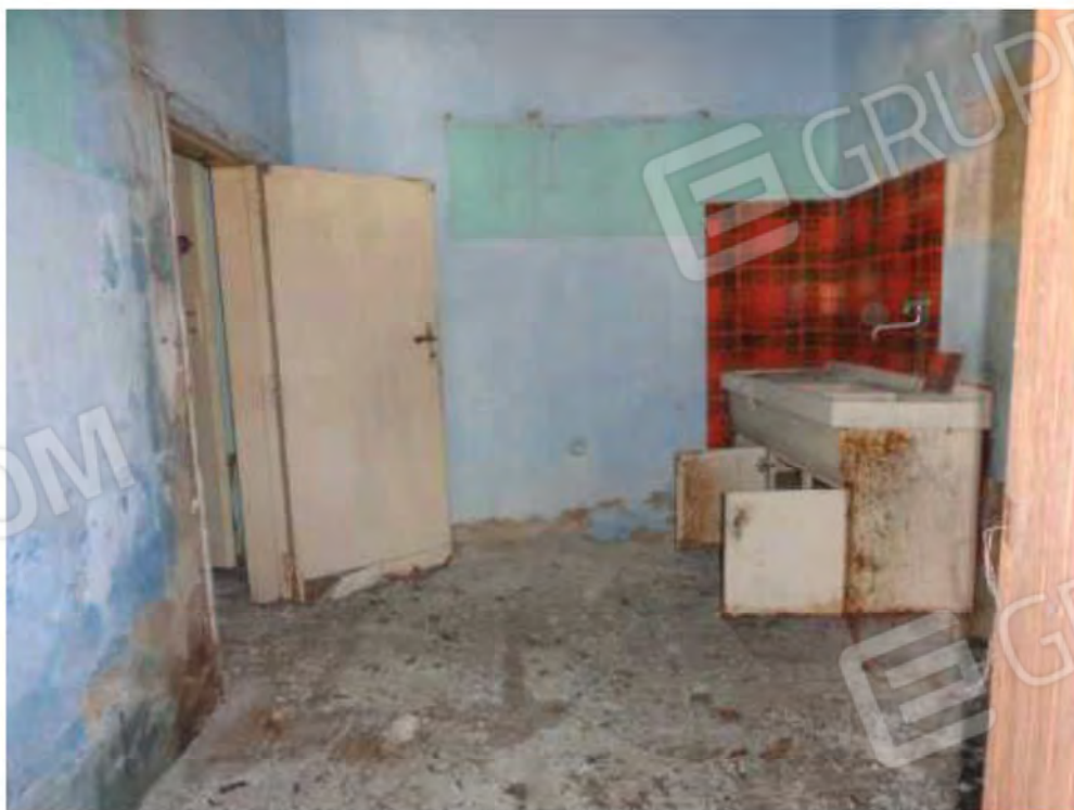
POSA N° 4 – FOTO CON PUNTO DI VISTA ALL’INTERNO DELL’IMMOBILE – ZONA LAVELLO - CUCINA