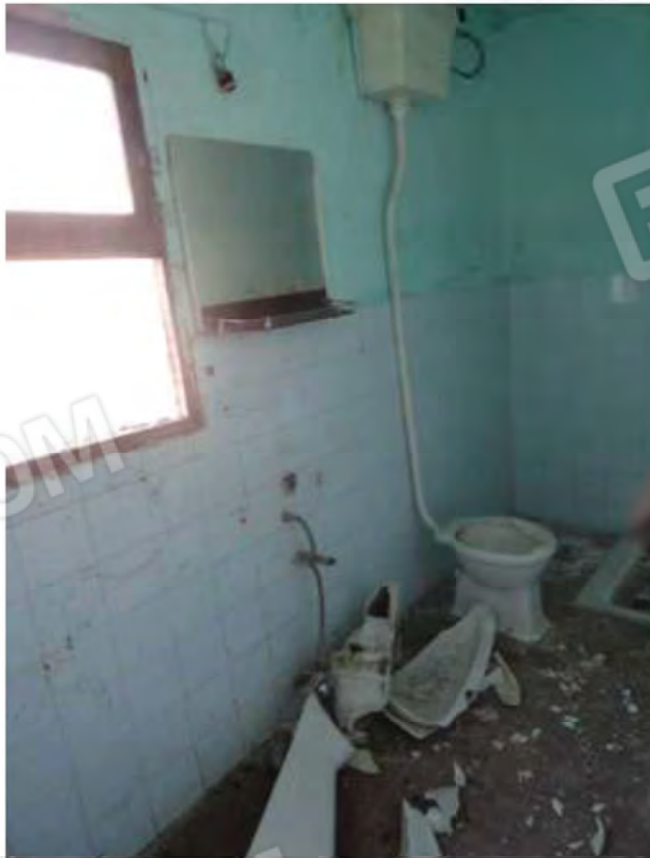
POSA N° 6 – FOTO CON PUNTO DI VISTA ALL'INTERNO DELL'IMMOBILE - ZONA SERVIZIO (WC)