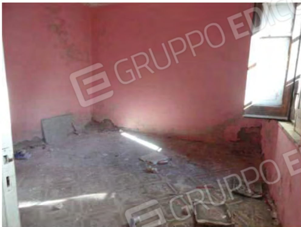
POSA N° 7 – FOTO CON PUNTO DI VISTA ALL'INTERNO DELL'IMMOBILE - ZONA - STANZA PROSPICIENTE IL PATIO