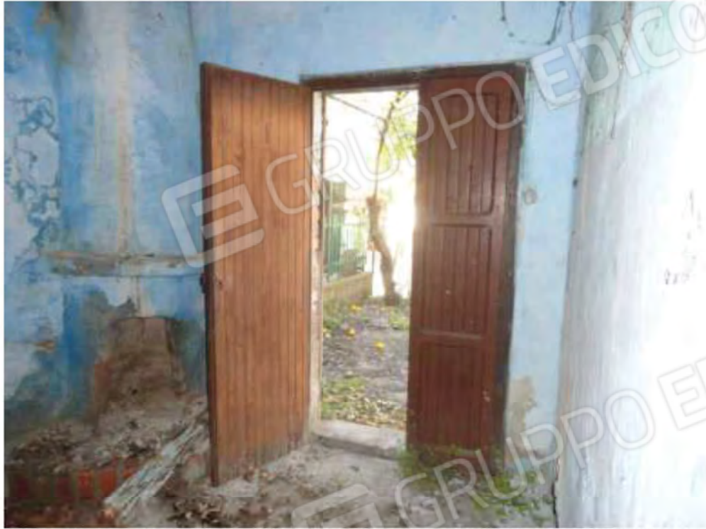
POSA N° 11 – FOTO CON PUNTO DI VISTA ALL'INTERNO DELL'IMMOBILE - ZONA - STANZA PROSPICIENTE IL GIARDINETTO - VISTA DEL GIARDINETTO DALL'INTERNO