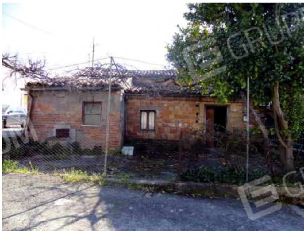
POSA N° 2 – FOTO CON PUNTO DI VISTA ALL'ESTERNO DELL'IMMOBILE - ZONA GIARDINETTO (FRONTALE)