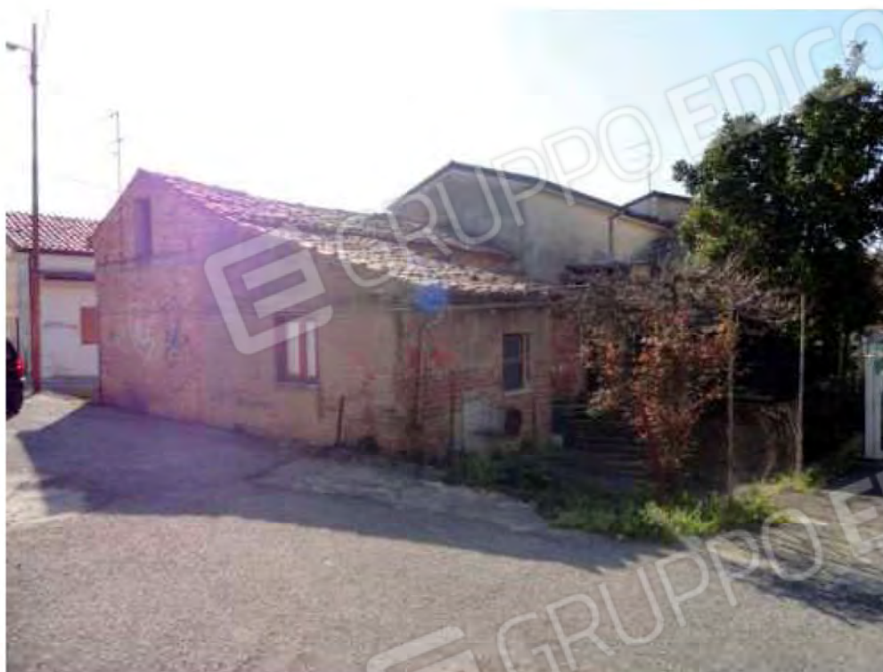
POSA N° 1 – FOTO CON PUNTO DI VISTA ALL'ESTERNO DELL'IMMOBILE - ZONA GIARDINETTO (ANGOLARE)