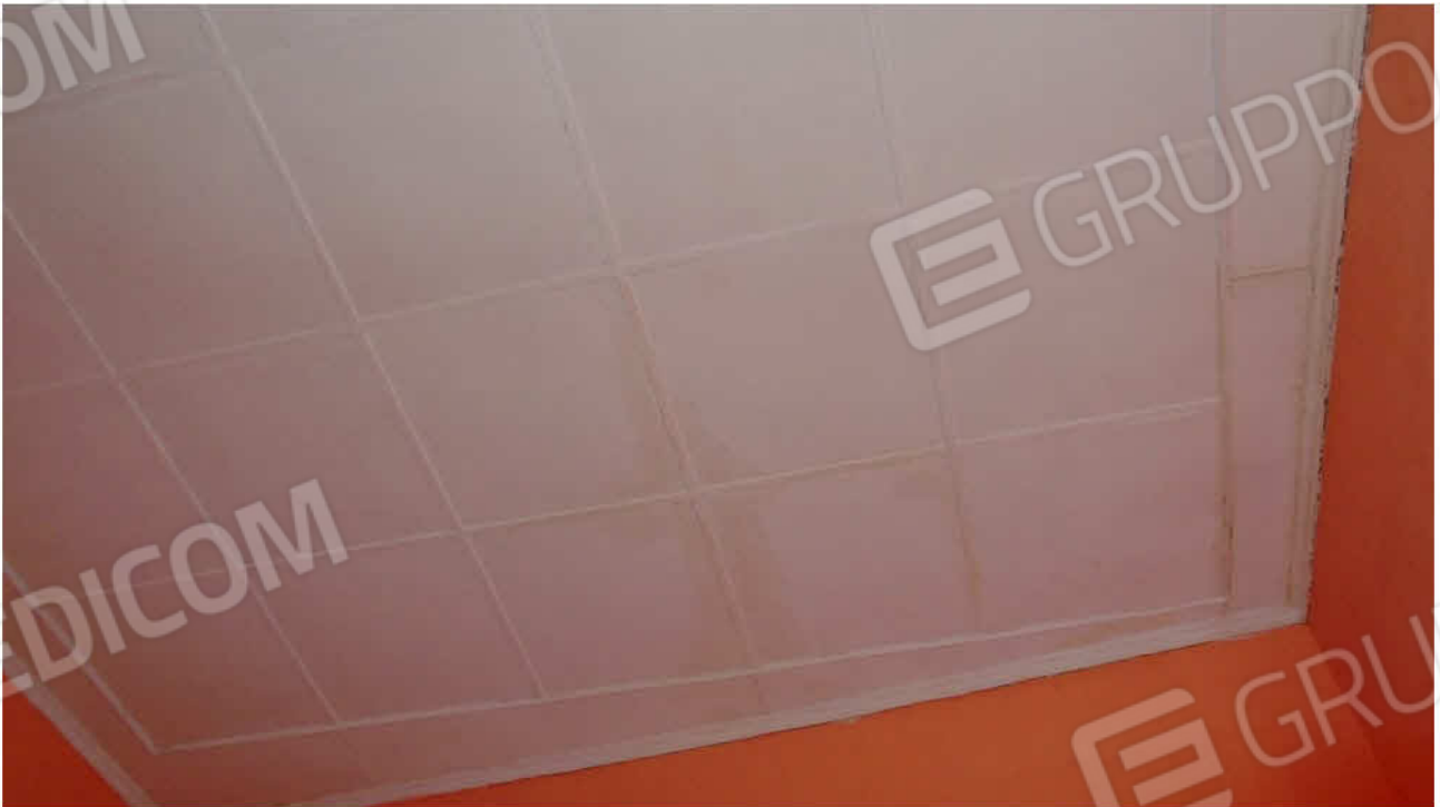
Foto n. 6 soffitto cucina