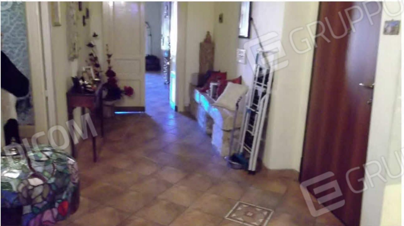
Foto n. 4 ingresso