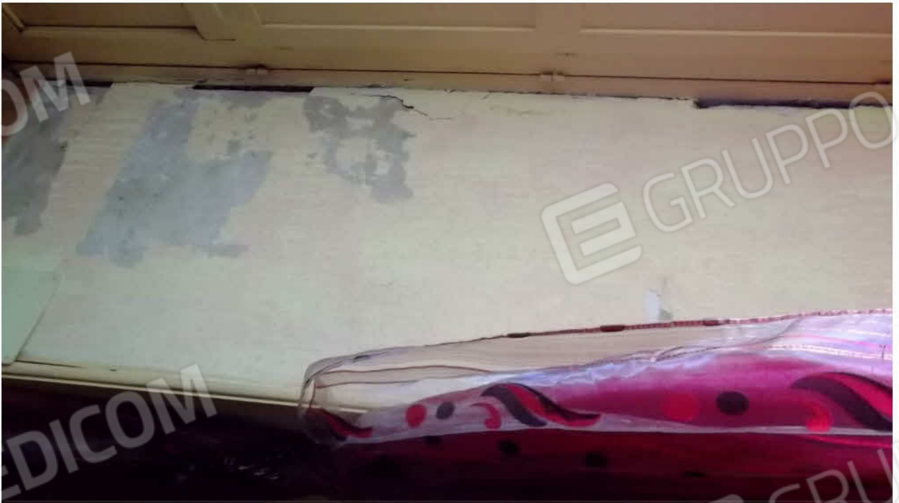
Foto 12 Infissi