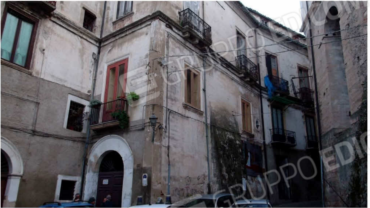
Foto n. 1 esterna