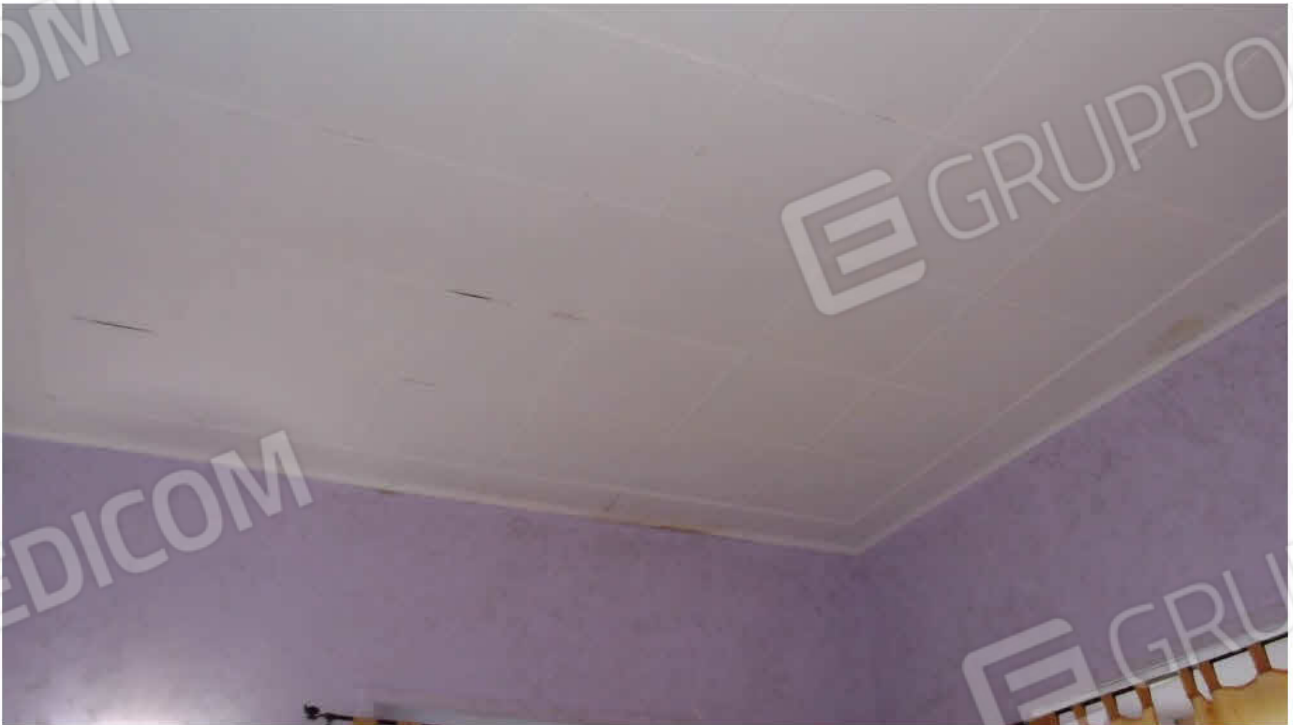
Foto n. 8 soffitto Salone