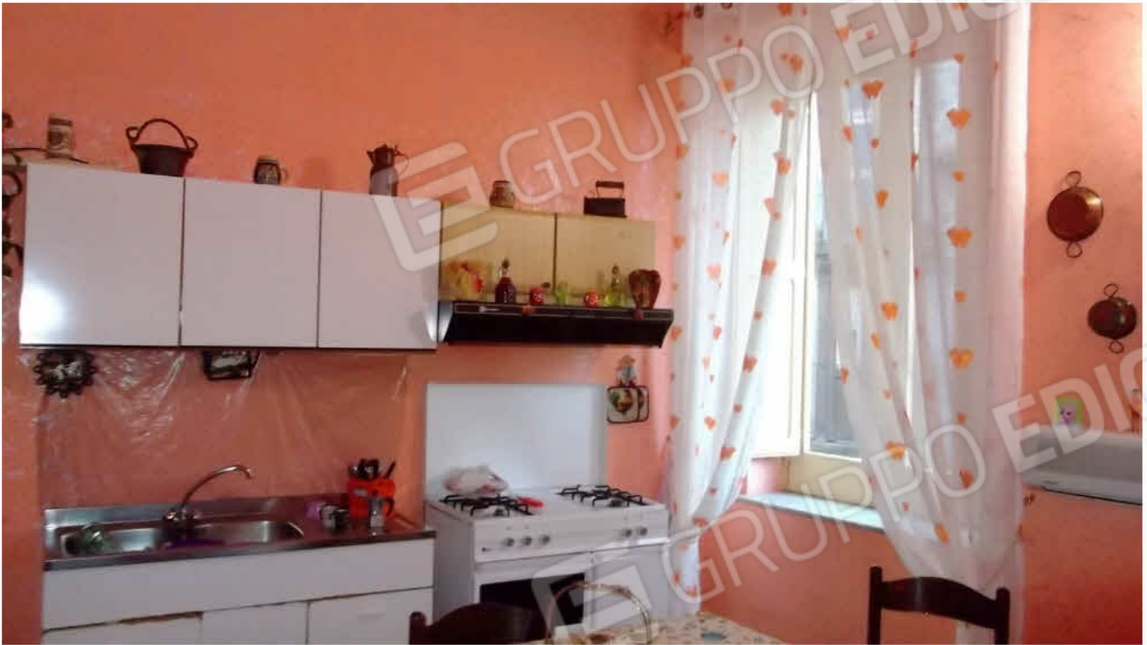
Foto n. 5 Cucina