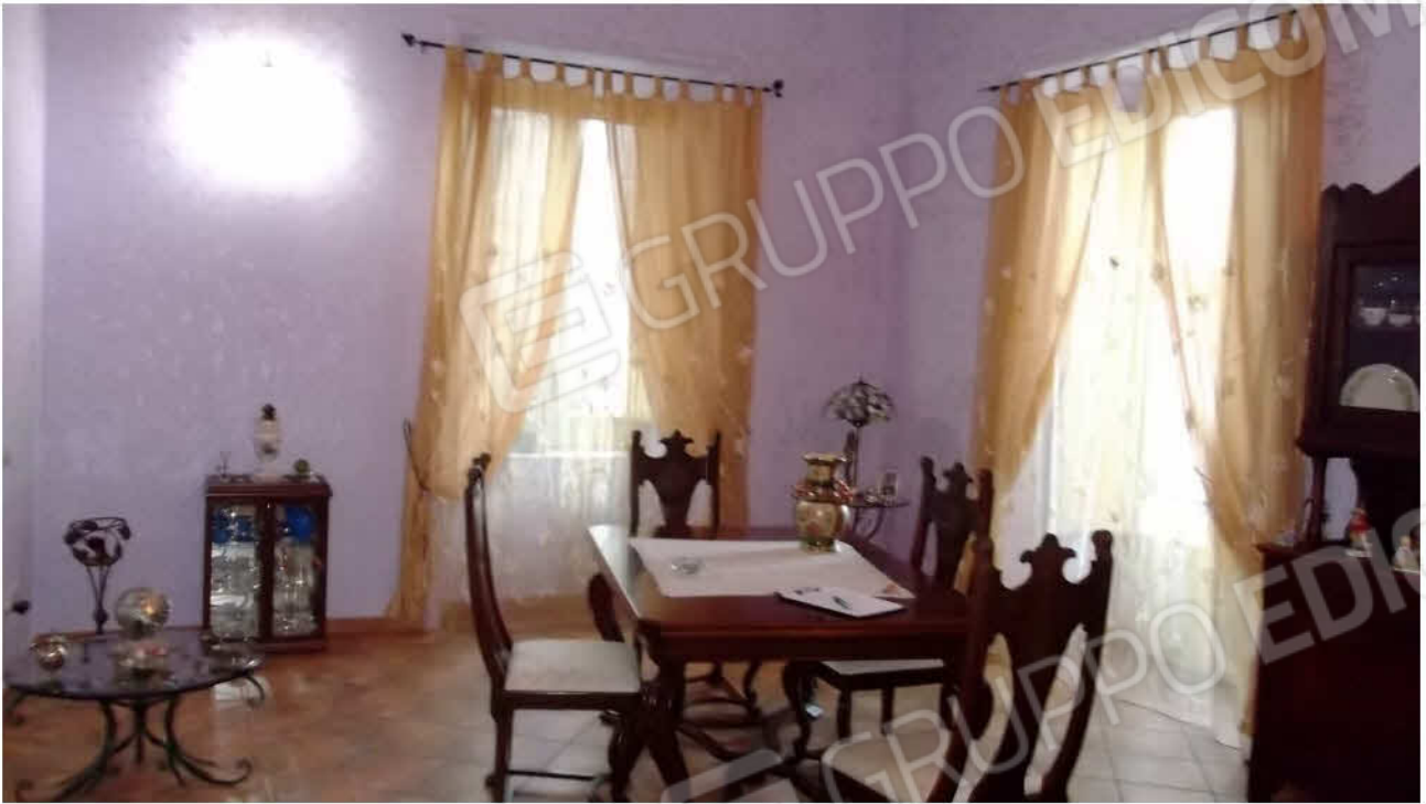
Foto n. 7 Salone