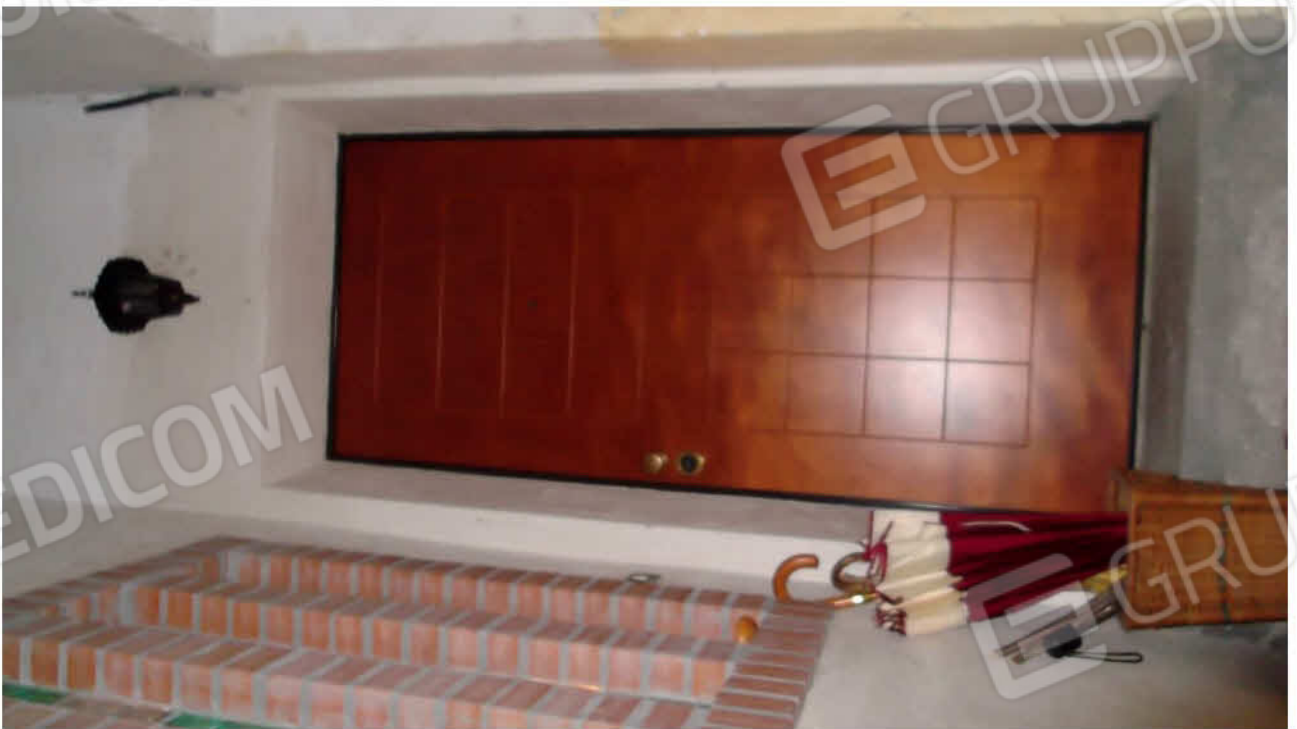
Foto n.2 Ingresso vano scala