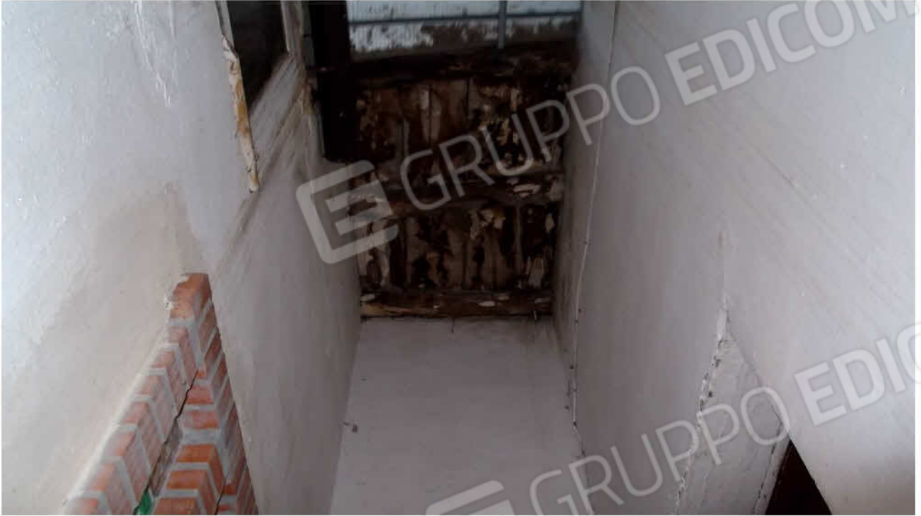
Foto n.3 vano scala