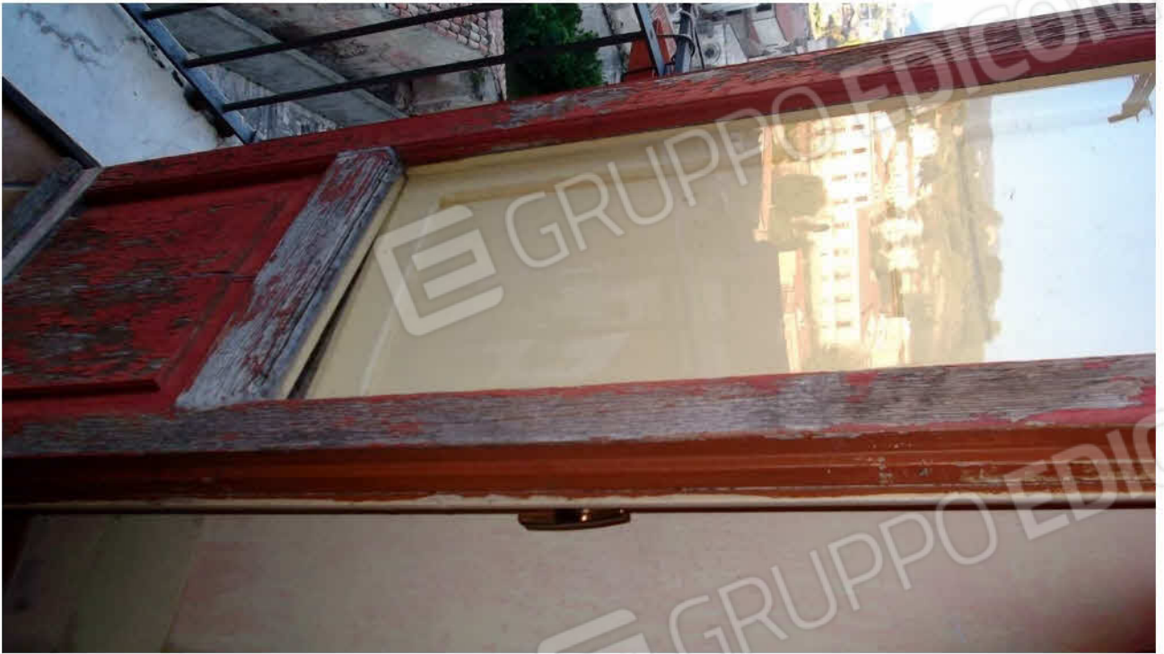
Foto 11 Infissi