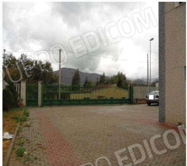
Stabilimento industriale e piazzale esterno