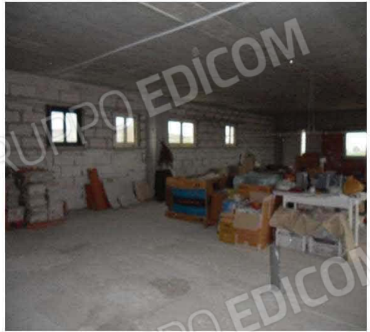
Piano primo al rustico