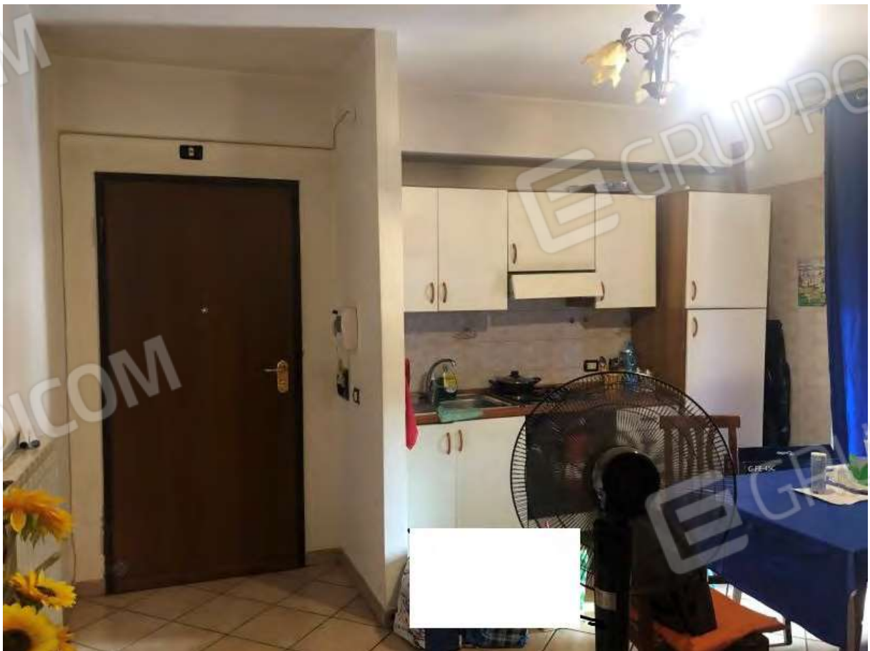
Foto 6 - Appartamento in Rende (CS), Via Verdi, ingresso comunicante con la cucina/giorno.