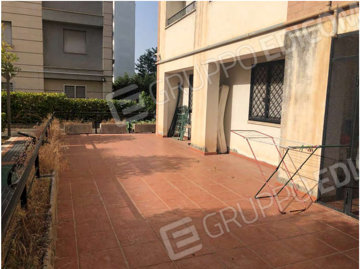
Foto 23 - Appartamento in Rende (CS), Via Verdi, corte esclusiva.