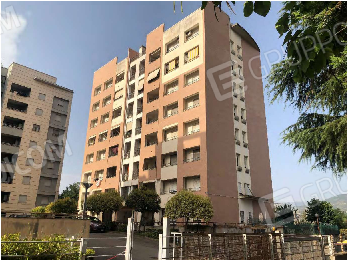
Foto 2 - Fabbricato in Rende (CS), Via Verdi, ingresso alla corte esterna comune con cancello carrabile e pedonale.