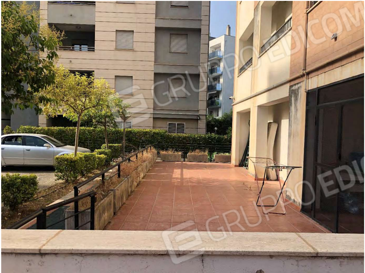
Foto 5 - Appartamento in Rende (CS), Via Verdi, corte esclusiva pavimentata.