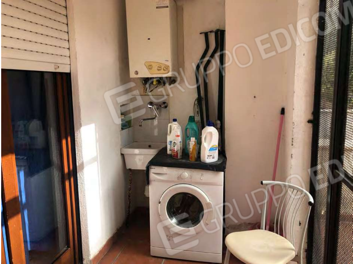
Foto 21 - Appartamento in Rende (CS), Via Verdi, interno veranda.