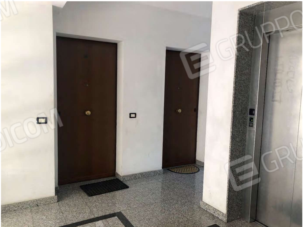
Foto 4 - Appartamento in Rende (CS), Via Verdi, atrio di accesso al piano terra.