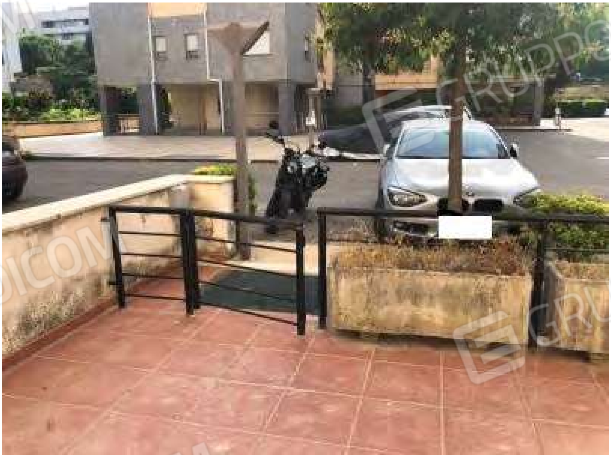
Foto 26 - Appartamento in Rende (CS), Via Verdi, corte esclusiva.