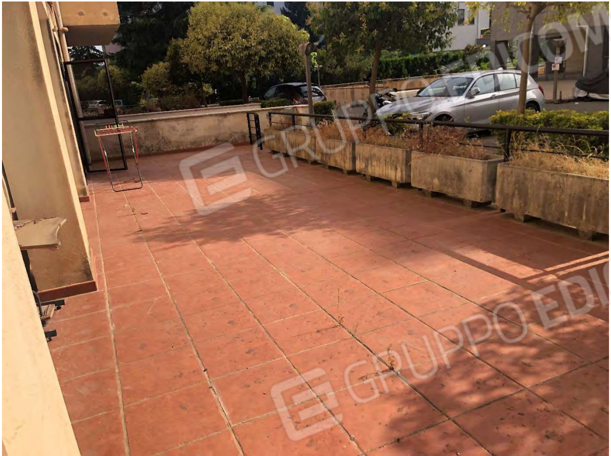
Foto 25 - Appartamento in Rende (CS), Via Verdi, corte esclusiva.