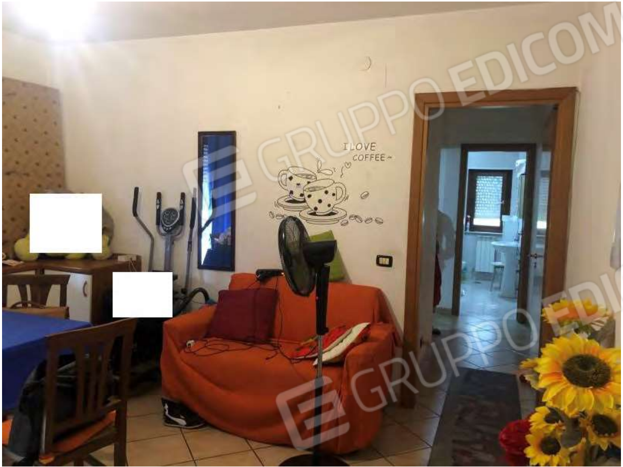
Foto 9 - Appartamento in Rende (CS), Via Verdi, cucina/giorno e corridoio.