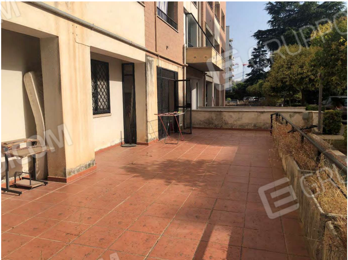
Foto 24 - Appartamento in Rende (CS), Via Verdi, corte esclusiva.