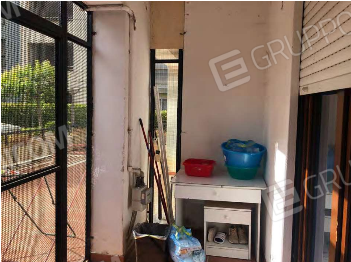
Foto 22 - Appartamento in Rende (CS), Via Verdi, interno veranda.