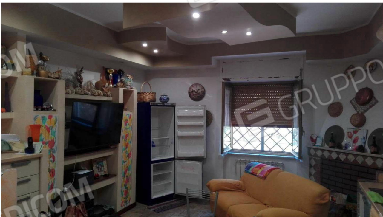
Cucina-Soggiorno lato abitato da Sig.ra [redacted]