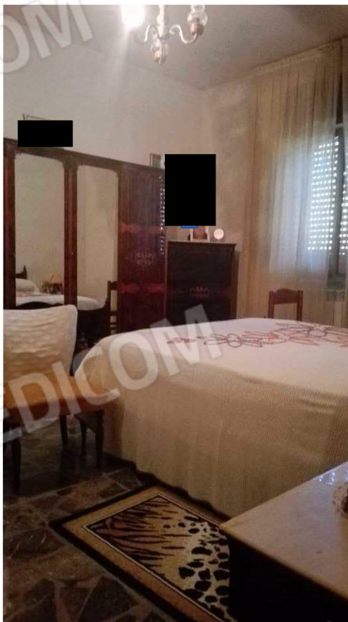
Stanza da letto