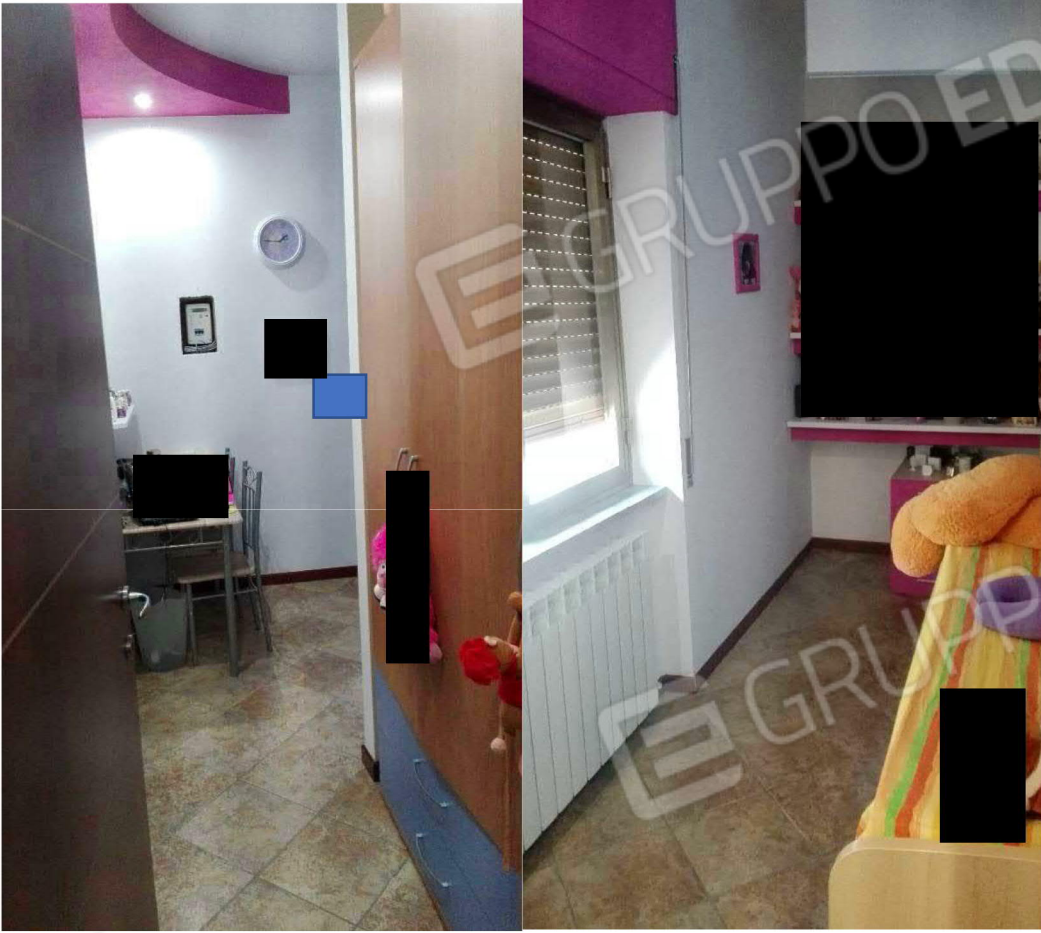
Camera da letto 2