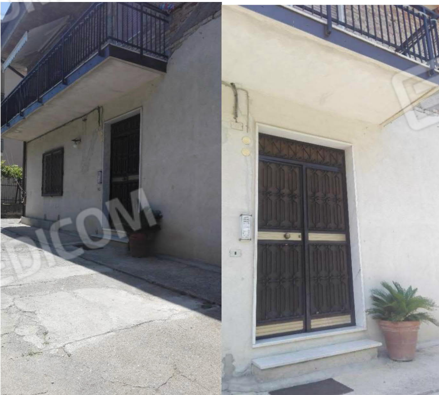
Ingresso lato abitato da Sig.ra [redacted]