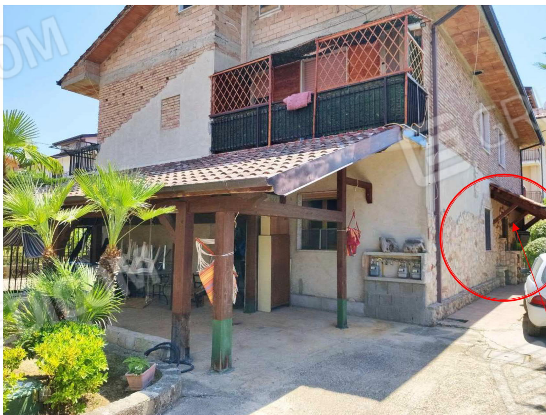
Ingresso parte lato abitato da Sig.ra [redacted]