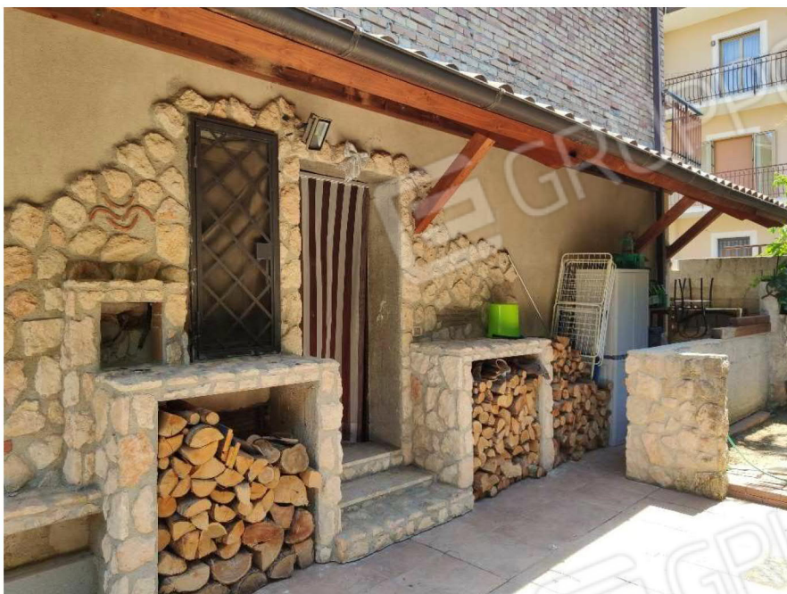
Particolare ingresso lato abitato da Sig.ra [redacted]