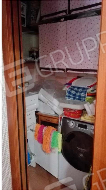
Bagno e ripostiglio