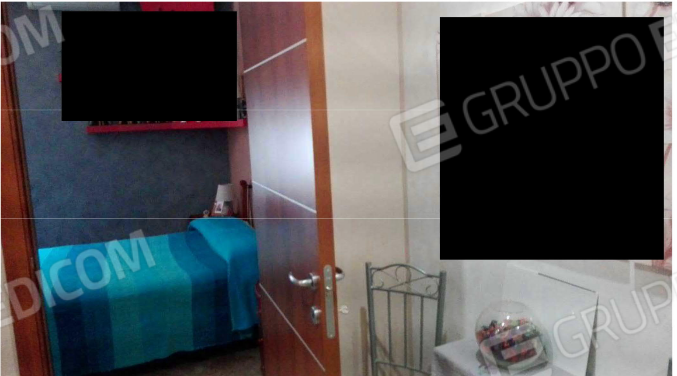
Camera da letto 1