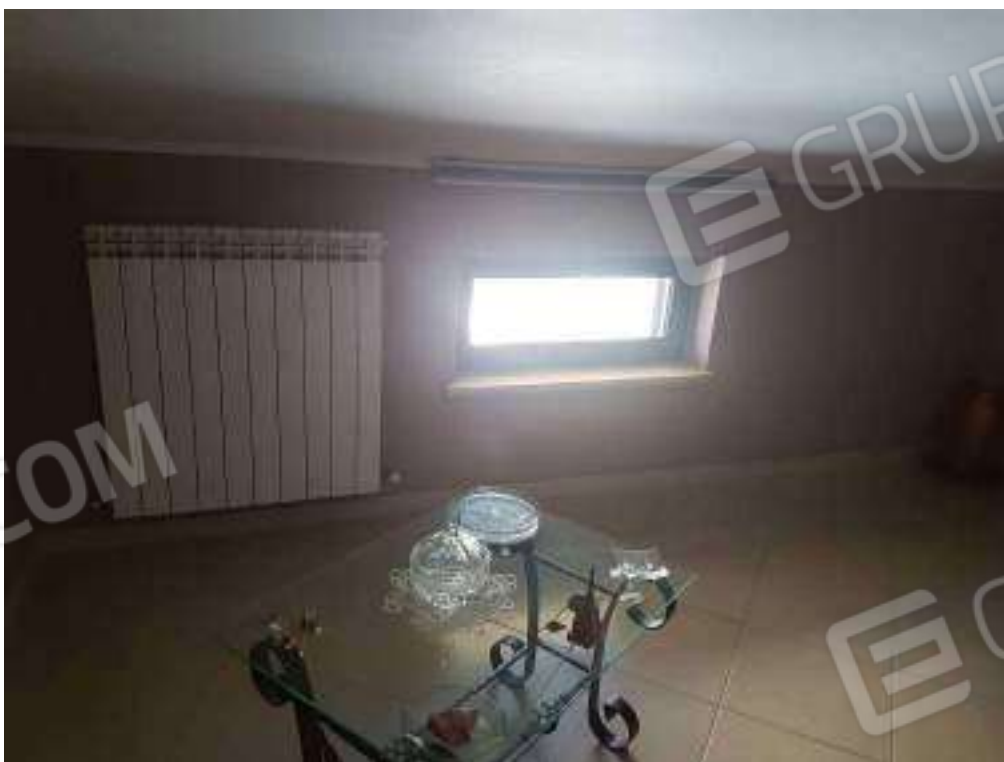
Foto 36: finestra e radiatori in alluminio, cucina – soggiorno – pranzo