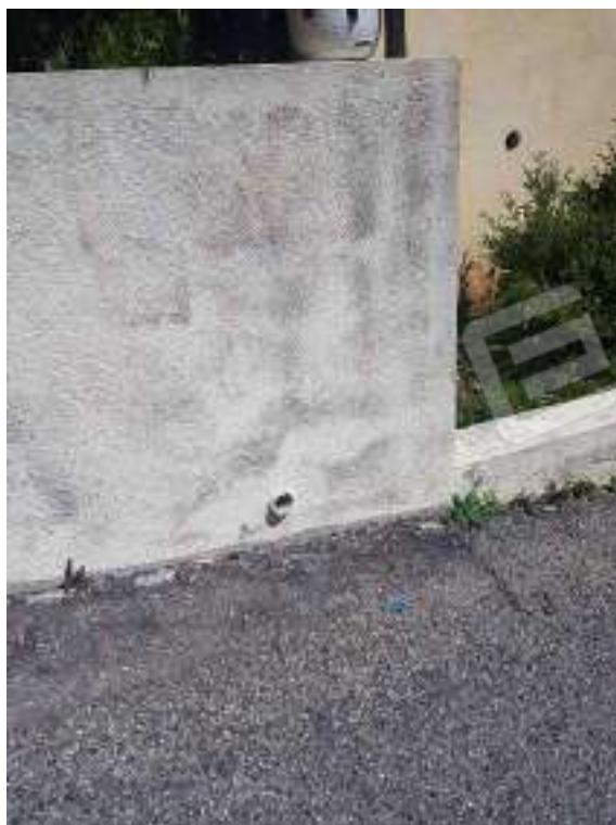
Foto 44: parete esterna palazzina, insalubre, soggetta alle intemperie