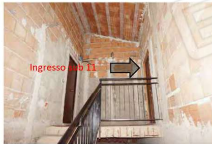
Immagine 34 vista esterna sub 11

— Individuazione del sub 11 sul prospetto dell'edificio