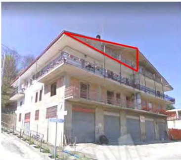
Immagine 33 vista esterna sub 11

— Individuazione del sub 11 sul prospetto dell'edificio