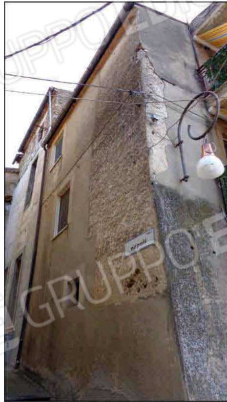
Prospetto laterale vico II via Napoli