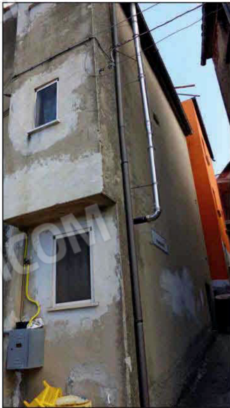
Prospetto laterale vico I via Napoli