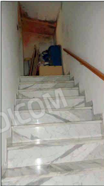
Macchie evidenti di umidità in corrispondenza dell'ultimo pianerottolo