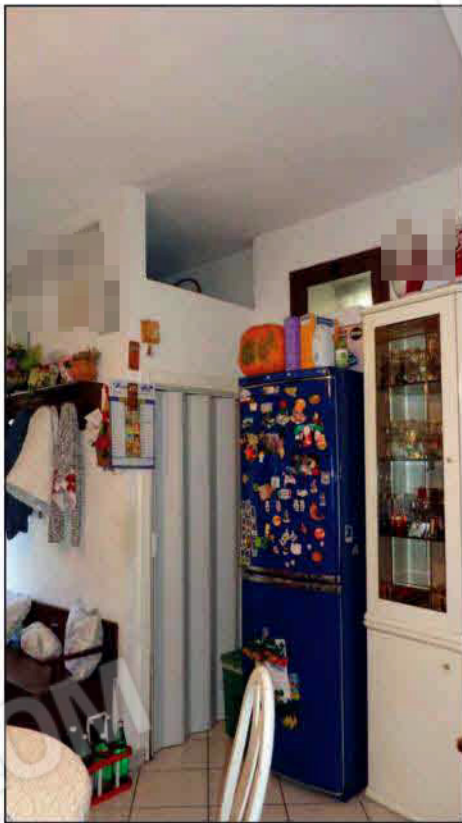
Vista della zona giorno - vano ripostiglio