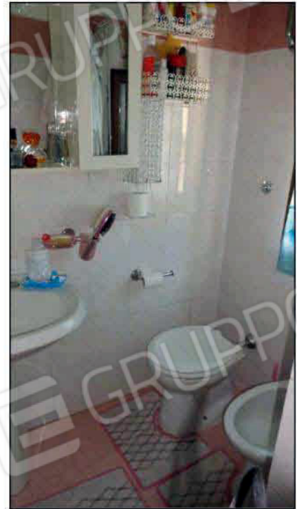
Locale servizio igienico - P1