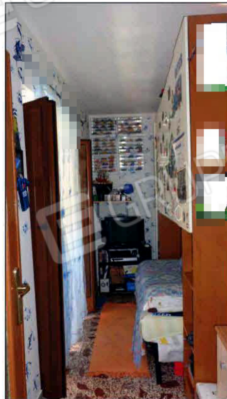
Cameretta - P1