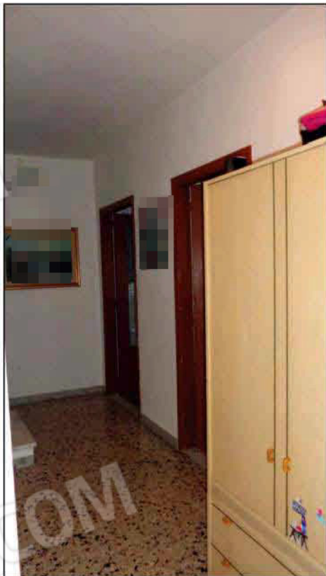
Disimpegno di accesso alle due camere - P1