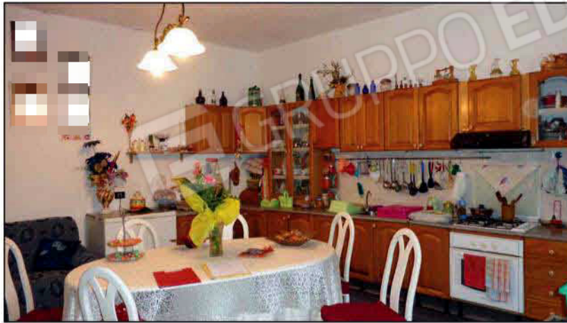
Vista della zona di soggiorno dall'ingresso - PT