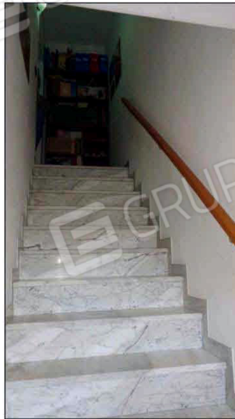
Scala di accesso ai livelli superiori