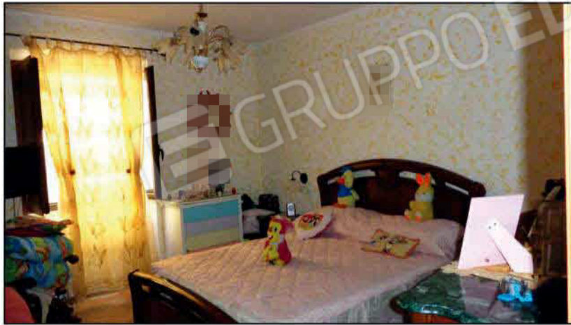
Camera da letto - P1