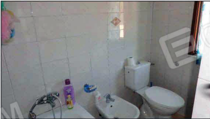
Locale servizio igienico - P2