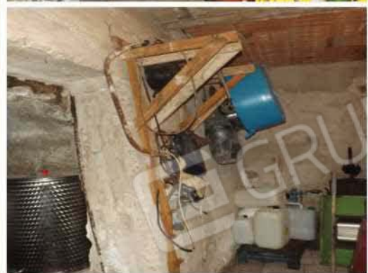
VISTA INTERNA DELL'UNITA' IMMOBILIARE N°2