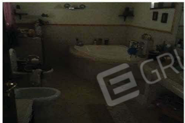
VISTA INTERNA DELL'UNITA' IMMOBILIARE N°1