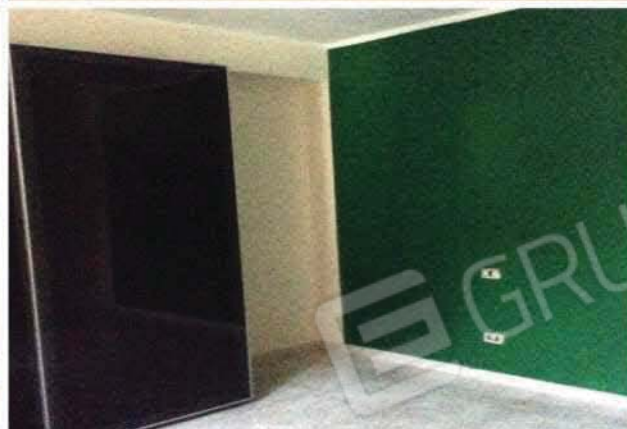
VISTA INTERNA DELL'UNITA' IMMOBILIARE N°4