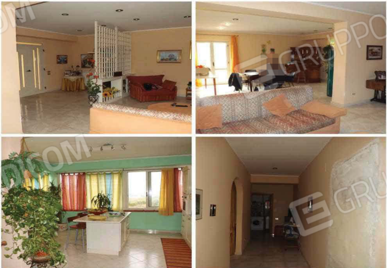
VISTA INTERNA DELL'UNITA' IMMOBILIARE N°3