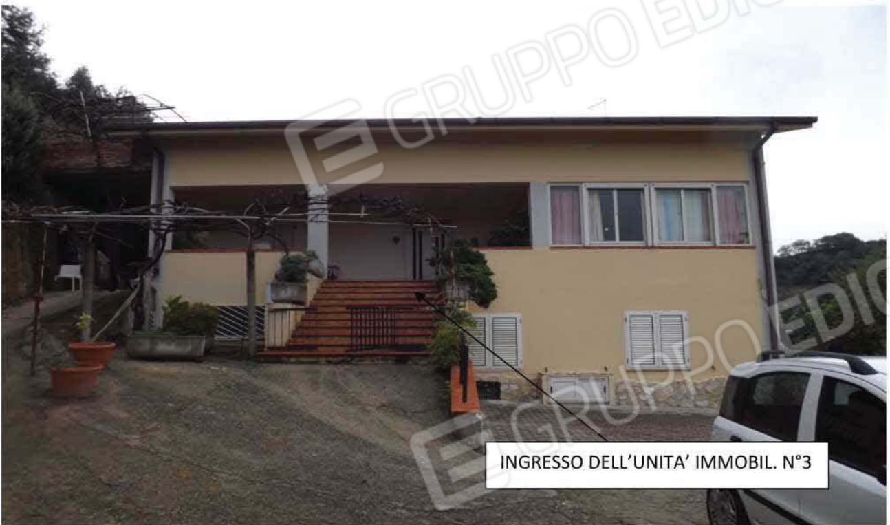
VISTA ESTERNA DELL'UNITA' IMMOBILIARE N°3