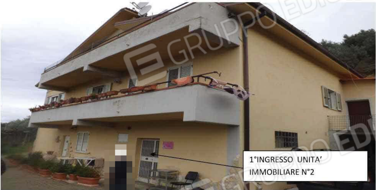
VISTA ESTERNA DELL'UNITA' IMMOBILIARE N°2