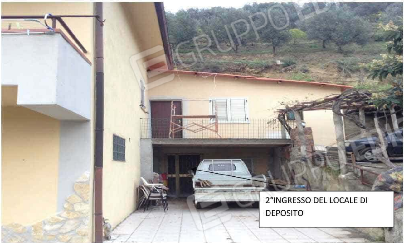
VISTA ESTERNA DELL'UNITA' IMMOBILIARE N°2