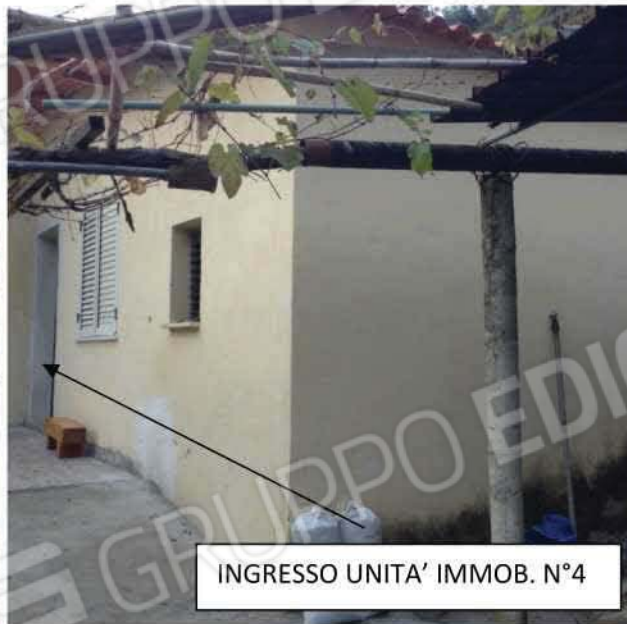
VISTA ESTERNA DELL'UNITA' IMMOBILIARE N°4